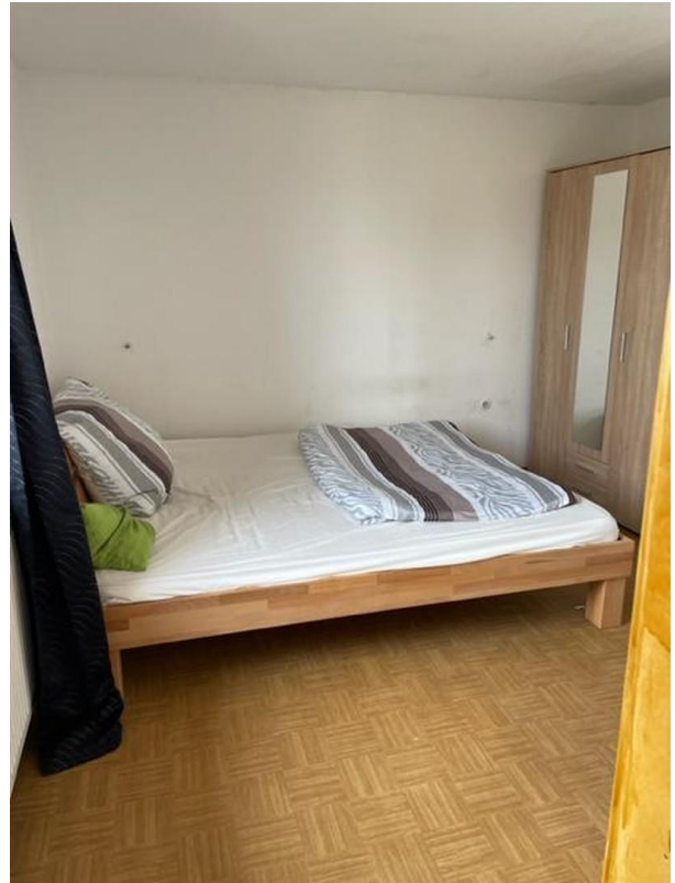
Zimmer Obergeschoss 2