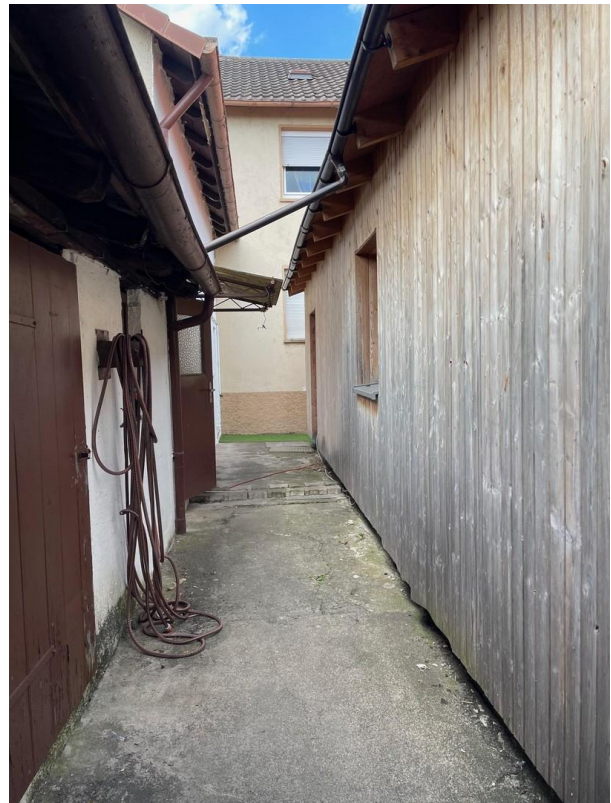
Blick vom Garten zum Haus