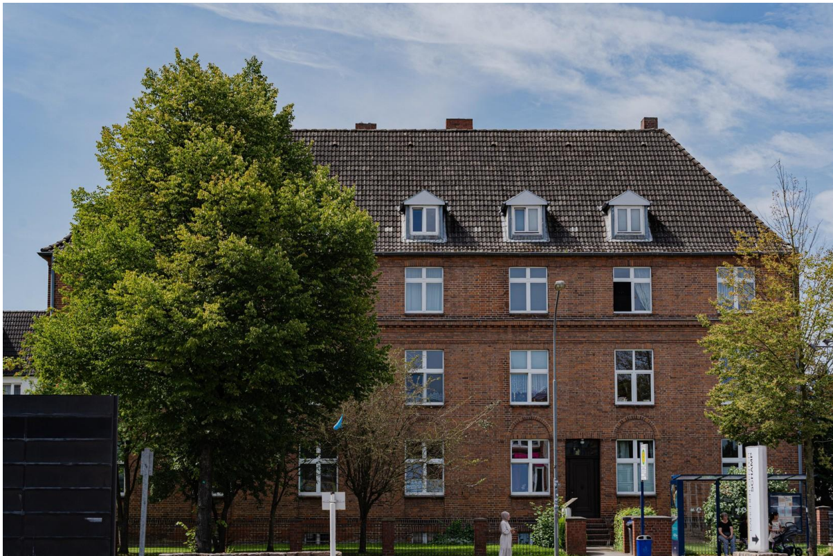
Haus - Außensicht