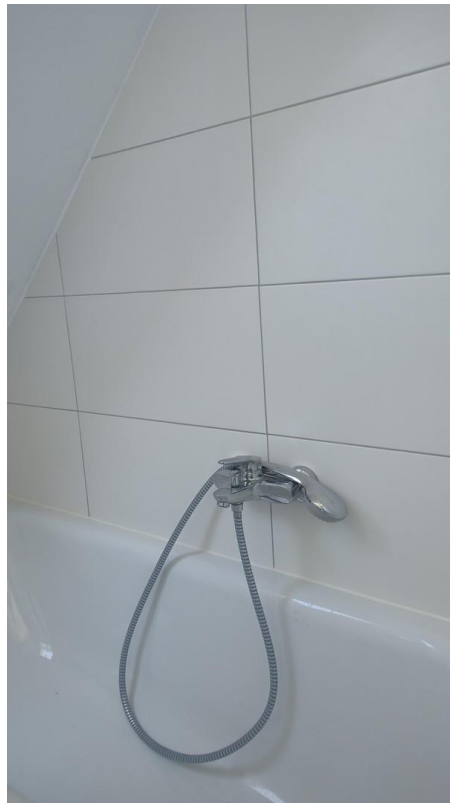
Bad OG mit Wanne