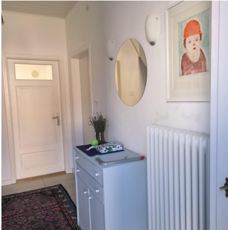
Diele mit Blick auf Küchentür