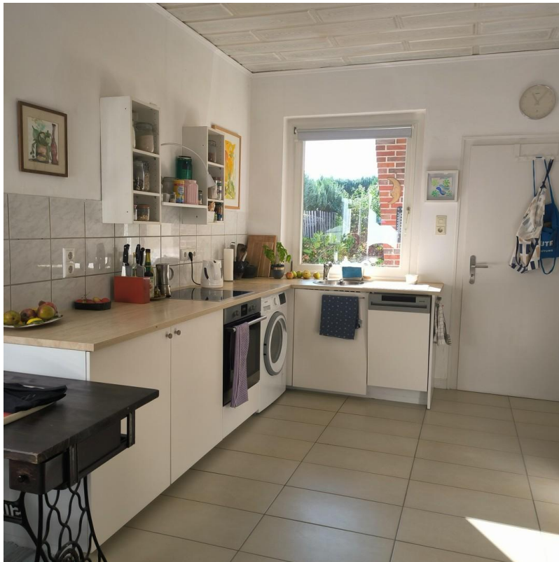
Küche mit Küchenzeile