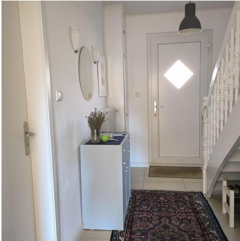
Eingangsdiele mit Bliegek auf