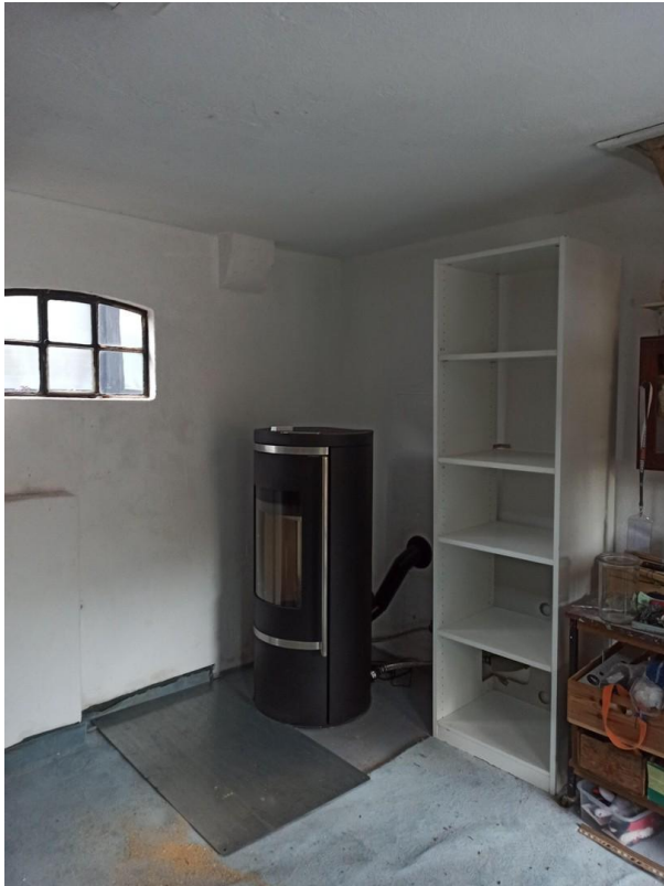
Wasser geführter Pelletofen