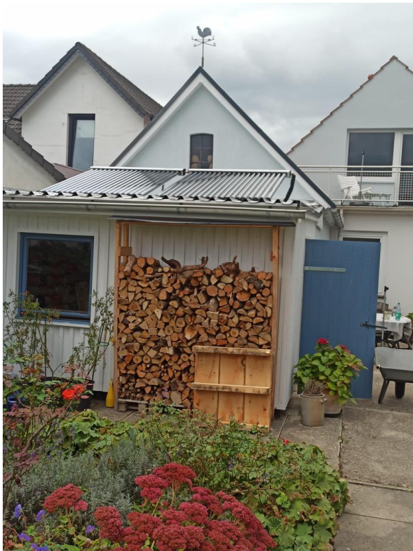
Holzabau mit Solarthermie