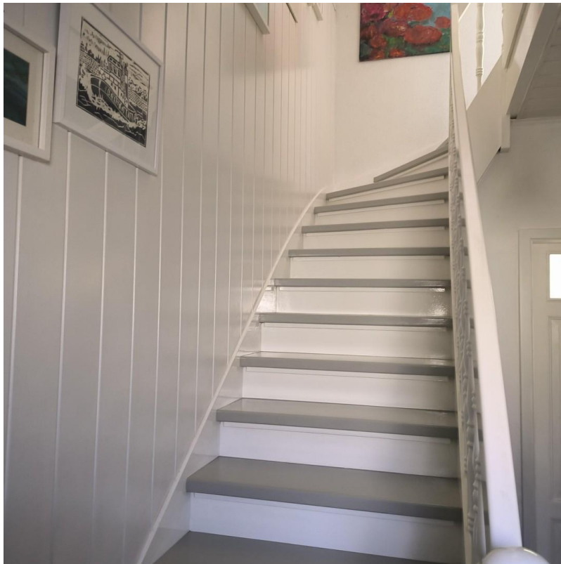
Treppe zum 1.OG