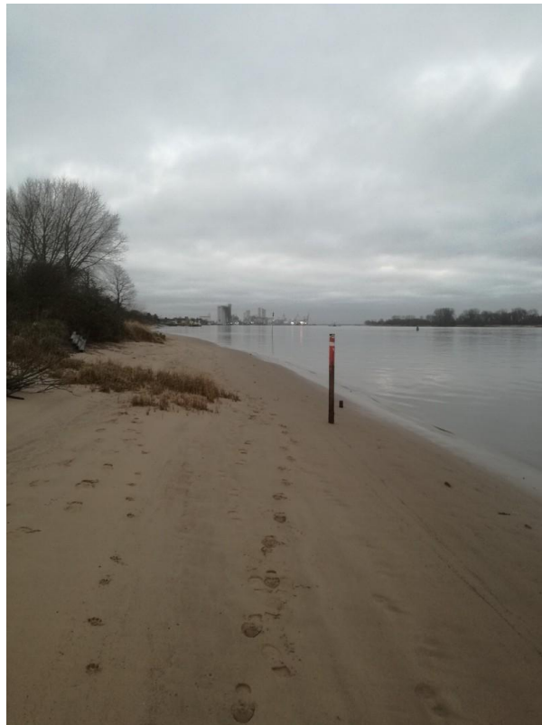
Weserstrand am Schlengenpadd