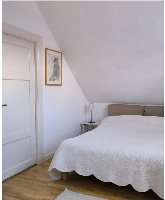
Schlafen 1 OG