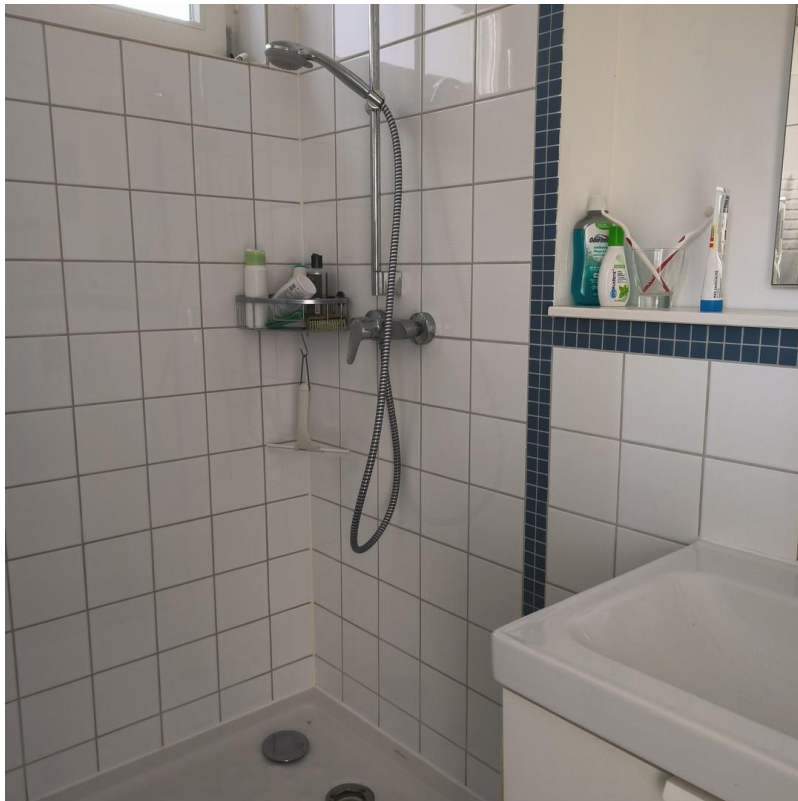
Bad EG- Duschbereich