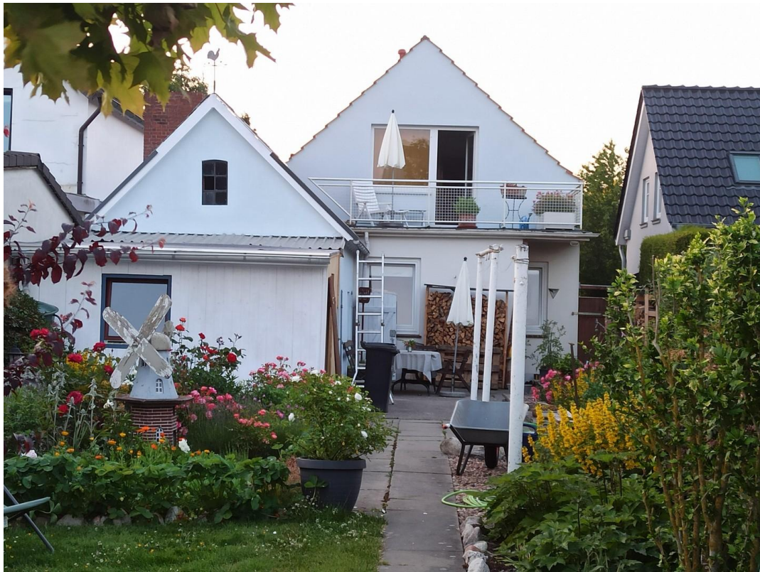
Blick auf die Gartenfassade