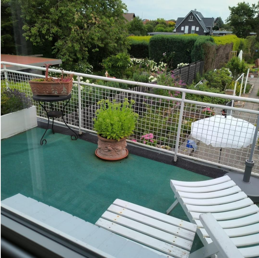
Balkon, Platz zum Verweilen