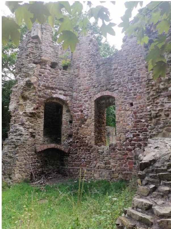
Schlossruine Wüstes Schloss