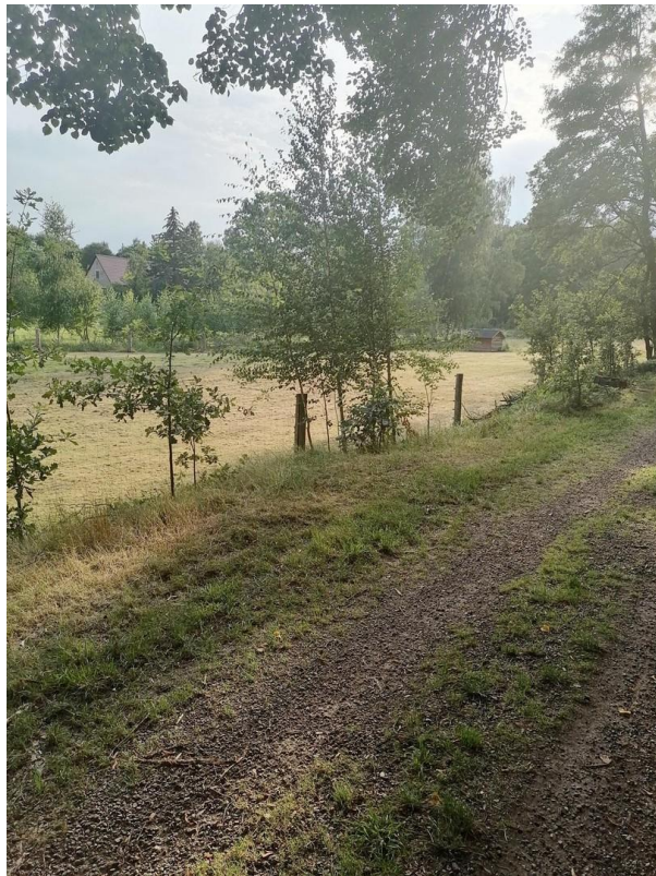
Wanderweg zum Schloss