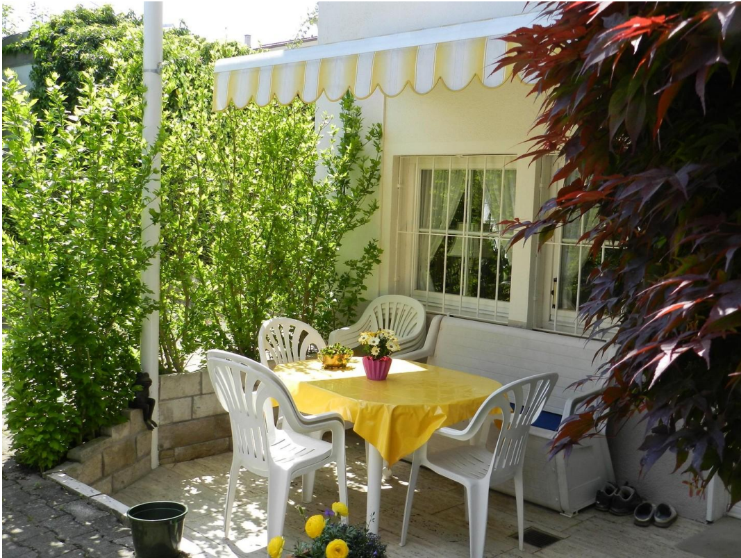
Terrasse am Haus