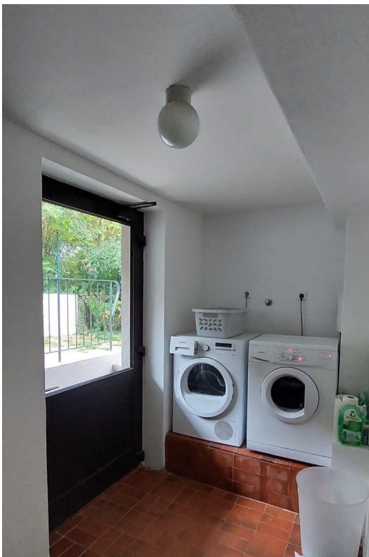
Haushaltraum m. Tür zum Garten