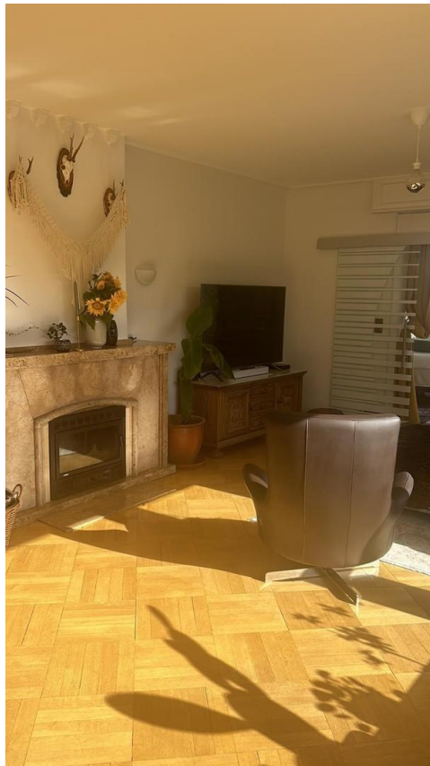
Wohnzimmer mit Kamin 1.OG