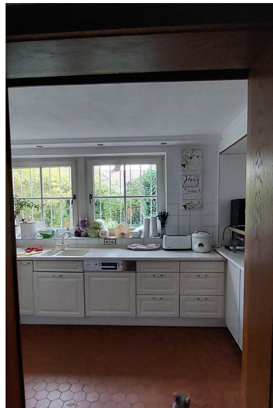
Küche UG mit Blick in den Gart