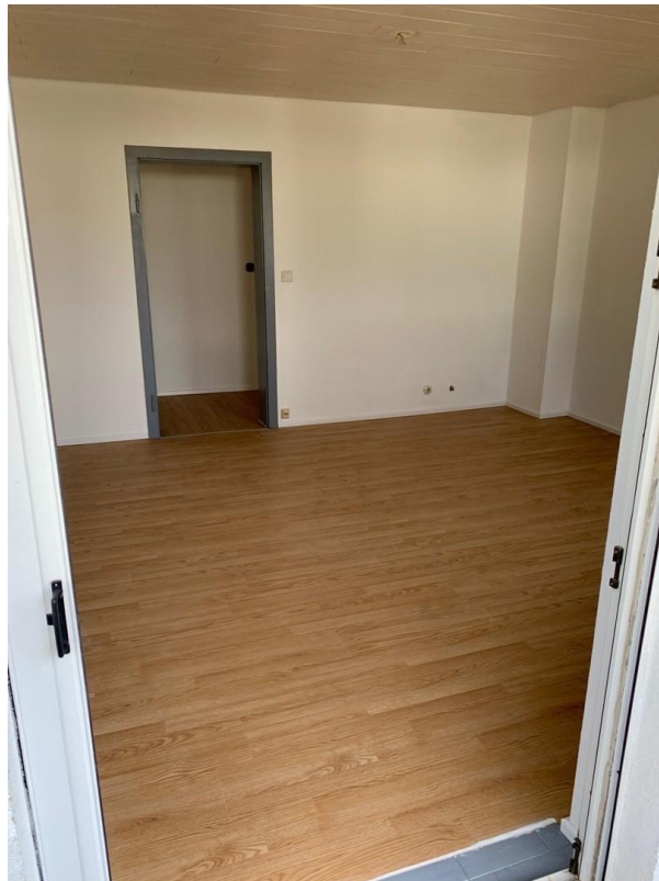
Wohnzimmer vom Balkon aus