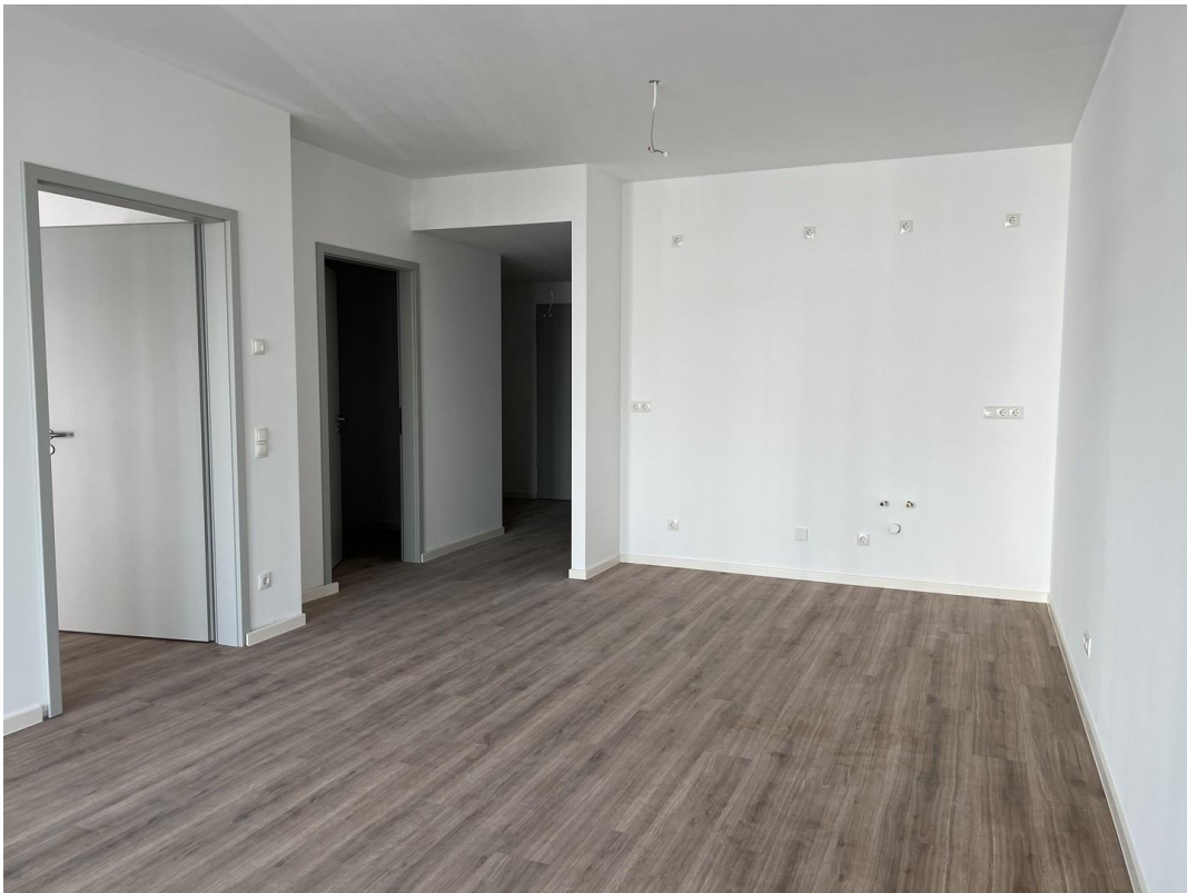
Wohnzimmer mit offener Küche