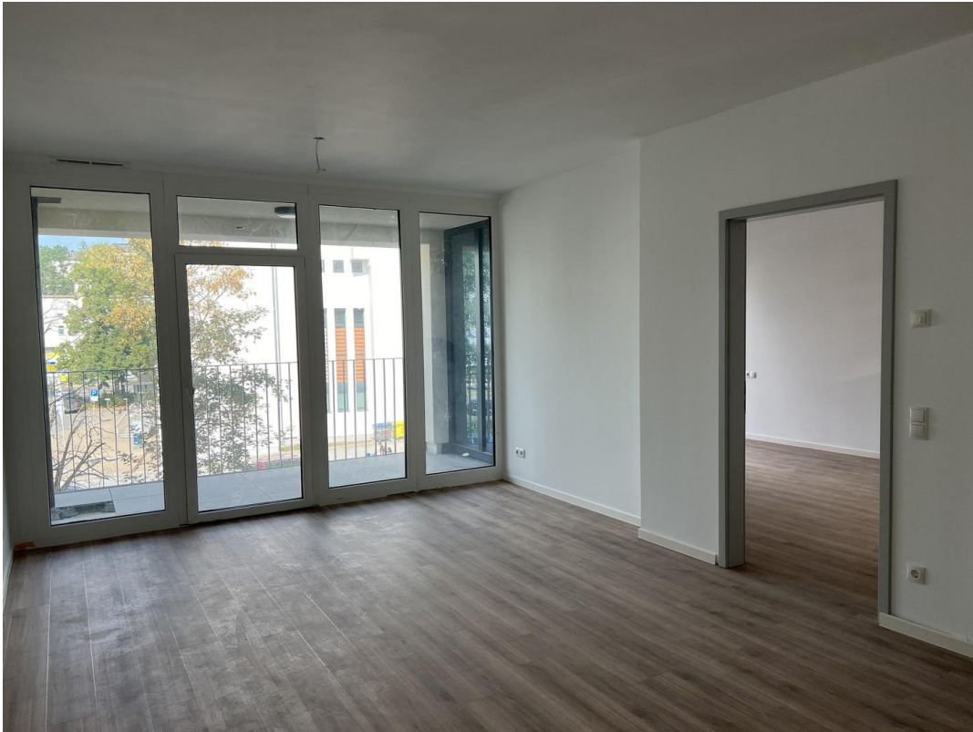
Wohnzimmer mit offener Küche