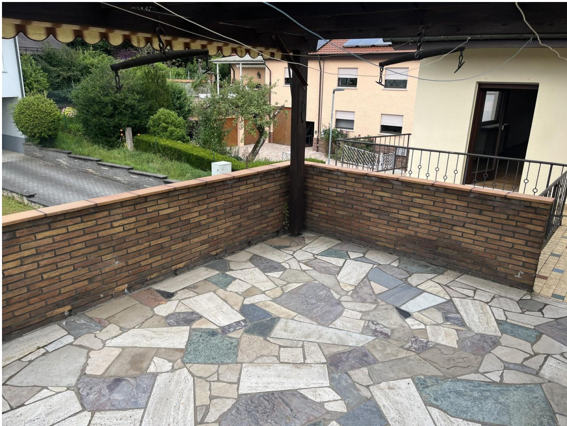
Balkon überdacht Südseite