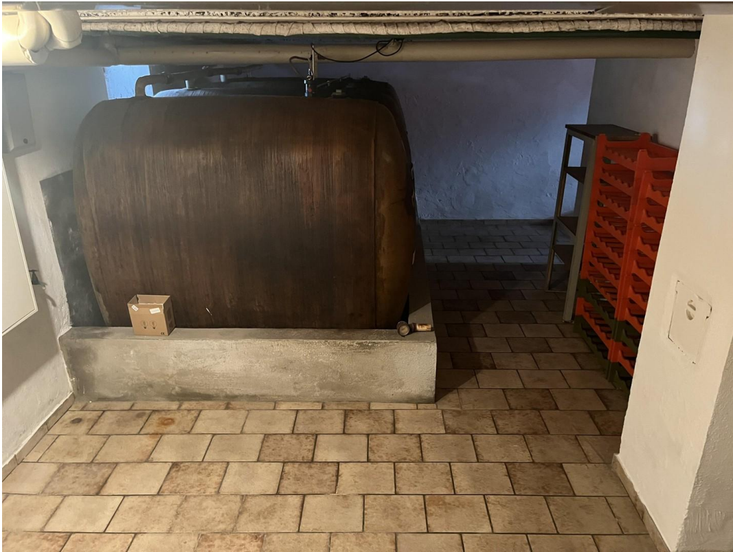
Keller mit Öltanks