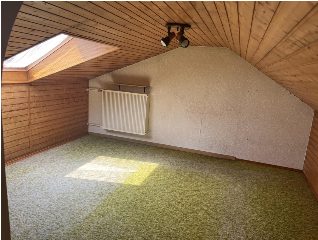
Kinderzimmer /Arbeitszimmer DG