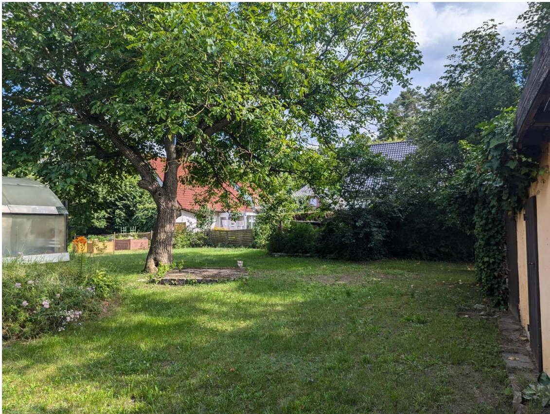
Tiefe des Grundstücks