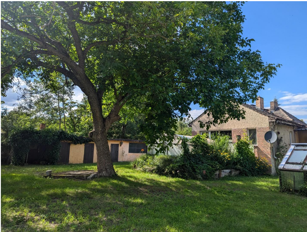
Hinteransicht Haus rechts