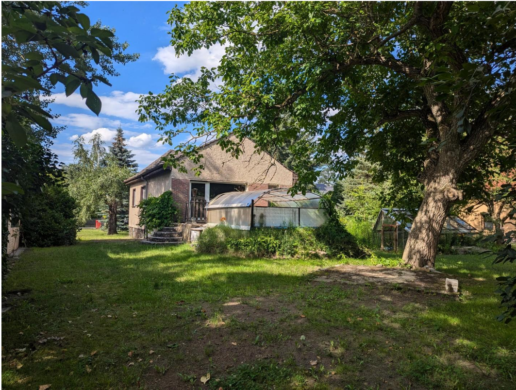
Hinteransicht Haus links