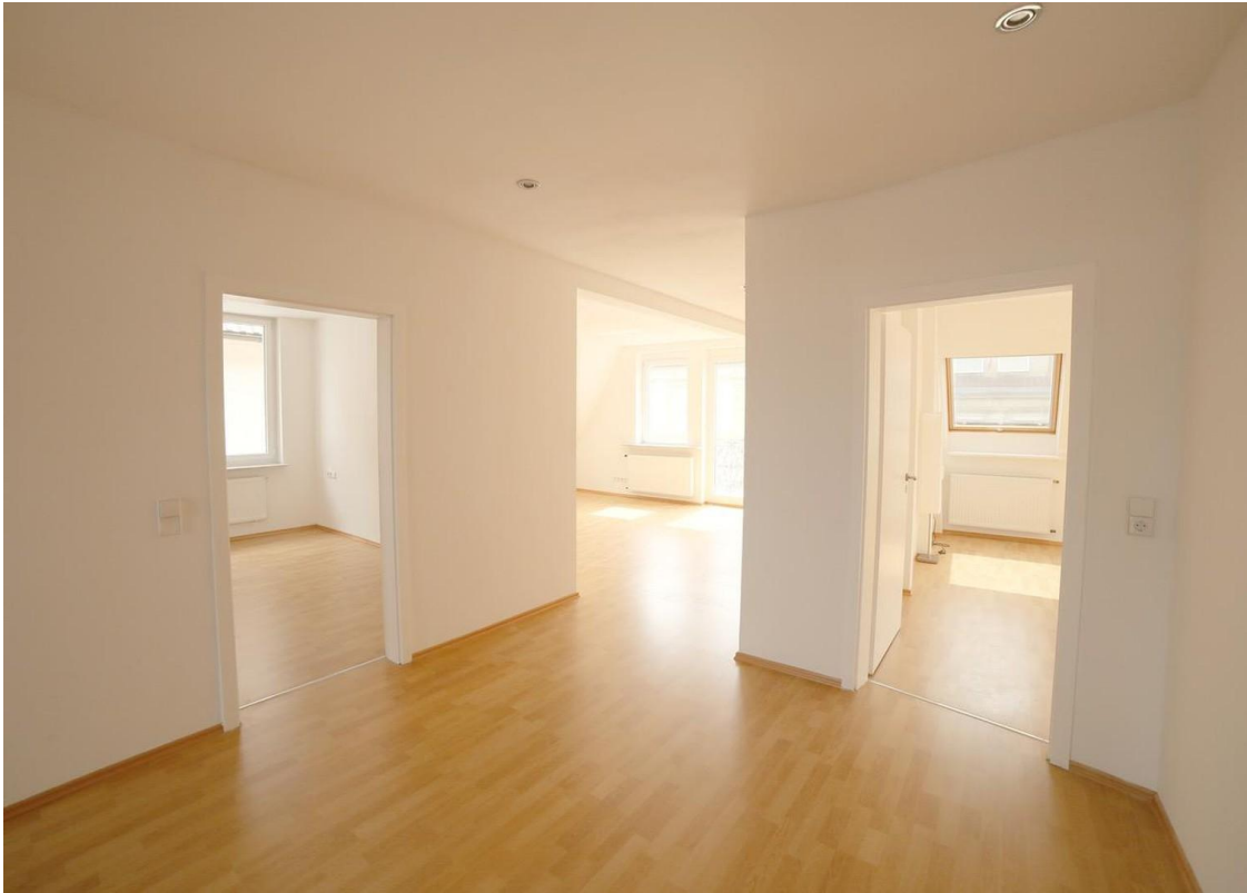
Flur zu den Räumen