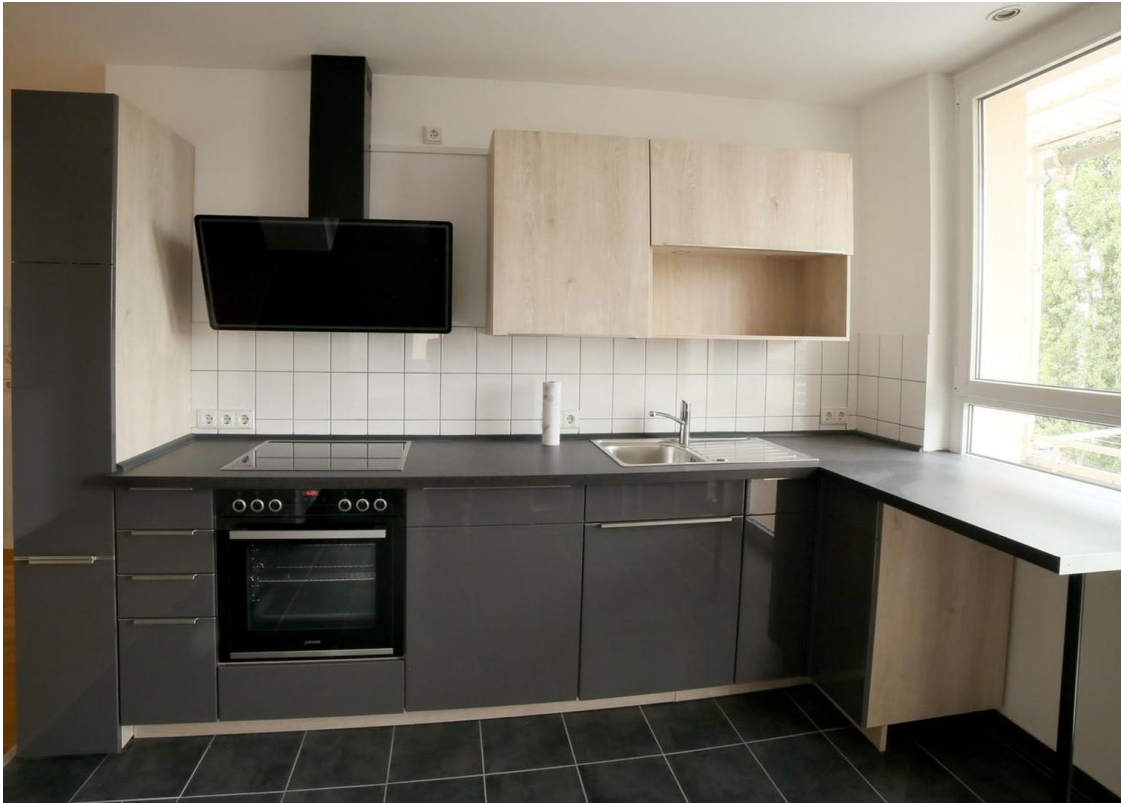
freier Platz für W-Maschine