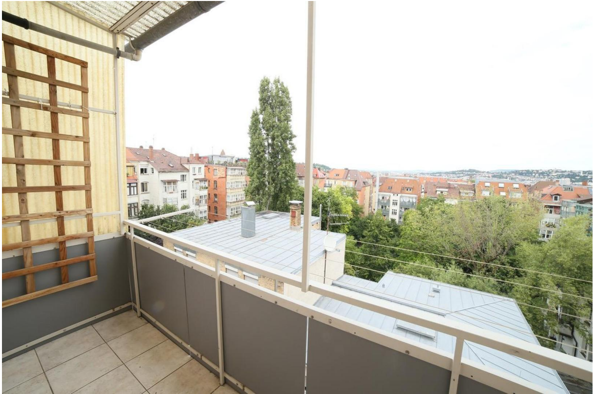
noch ne Perspektive