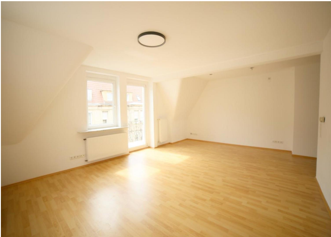
Wohnzimmer offen mit Balkon