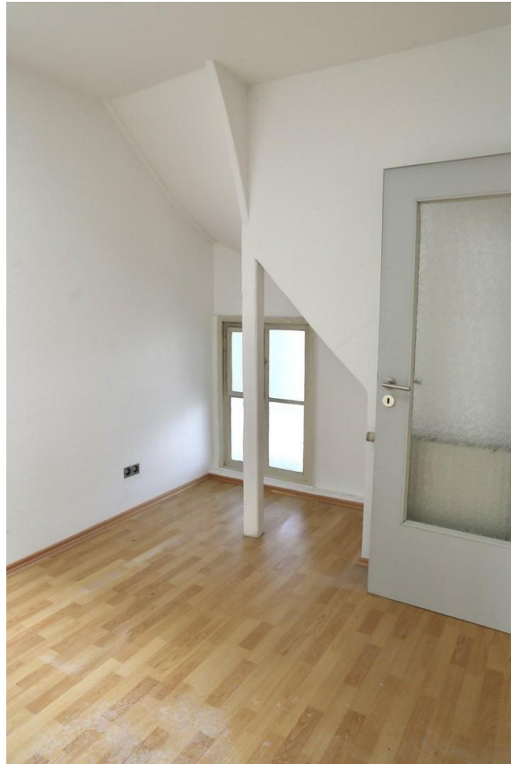
halbes Zimmer mit Lichtschacht