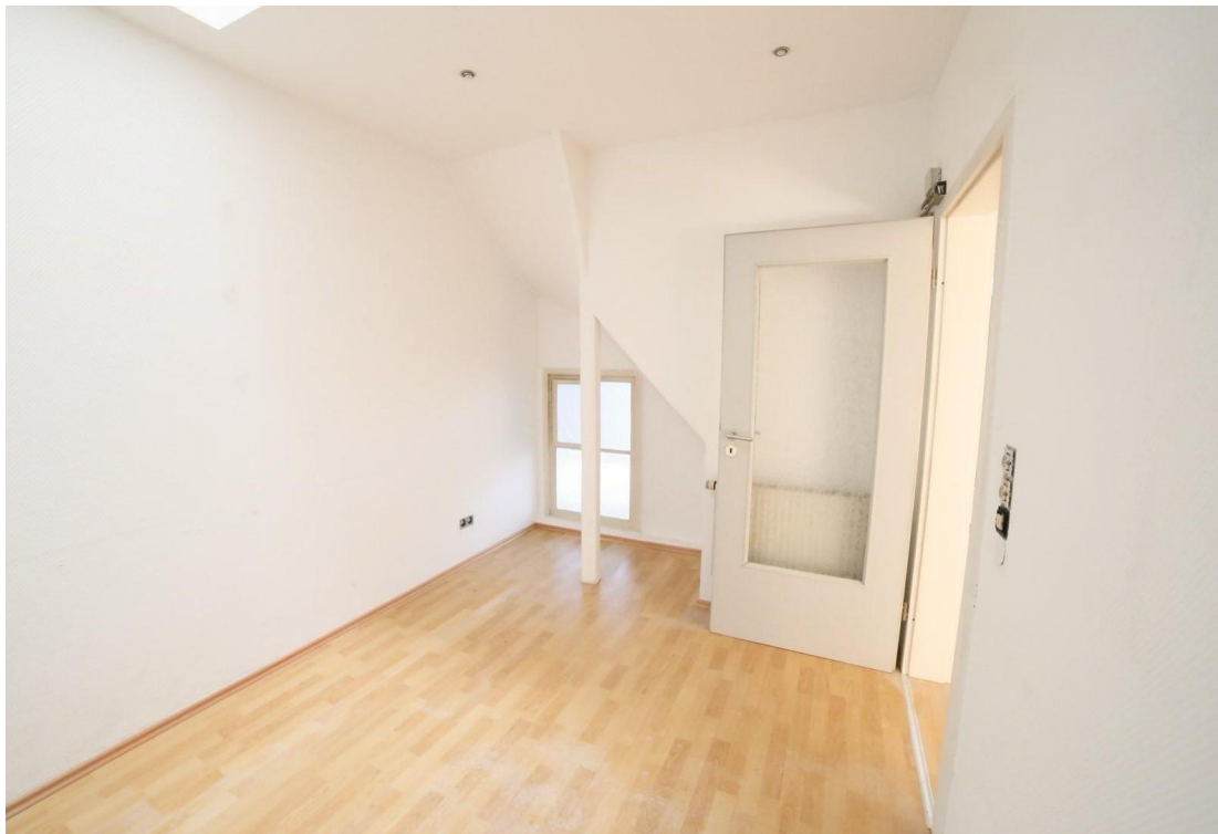
halbes Zimmer mit Lichtschacht