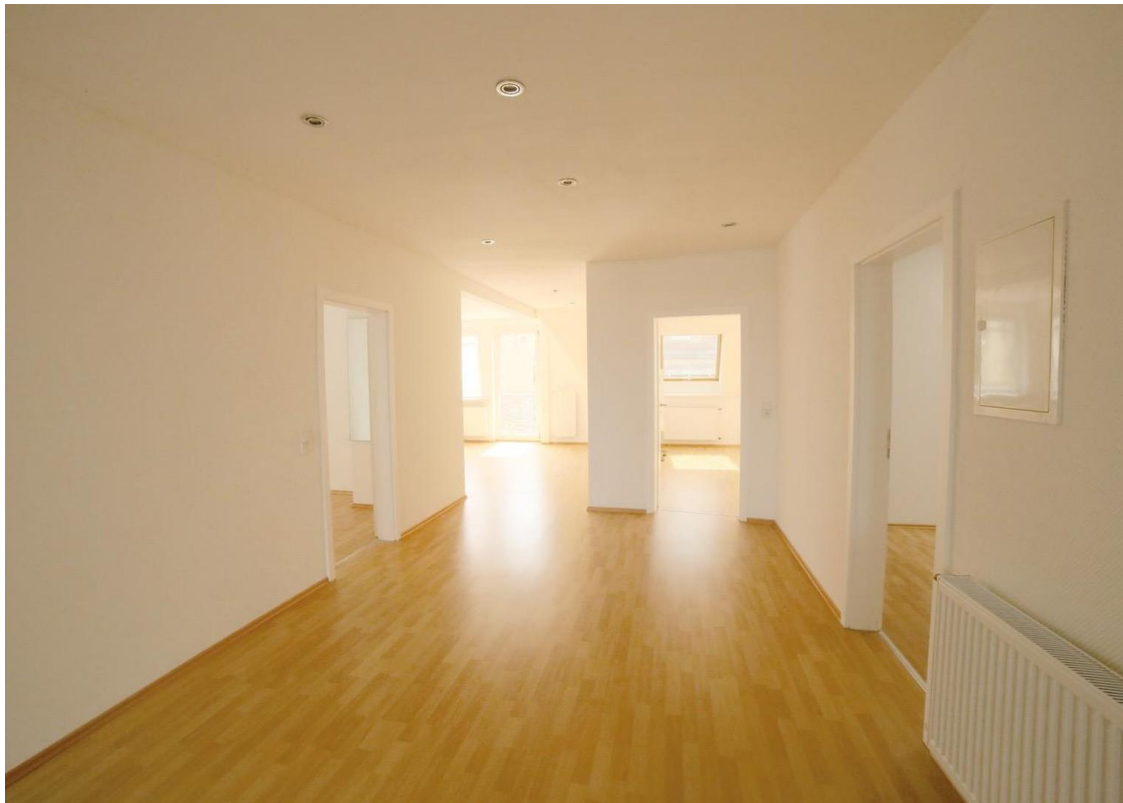
Flur zu den Räumen