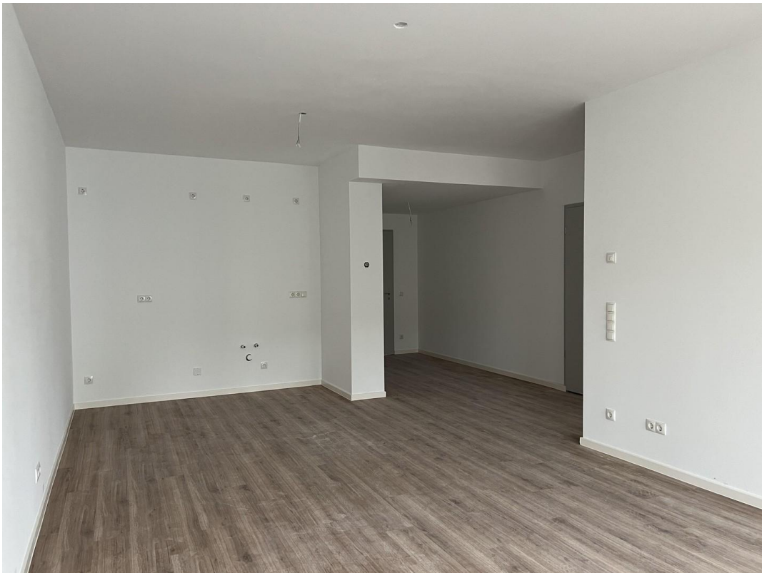
Blick auf offene Küche