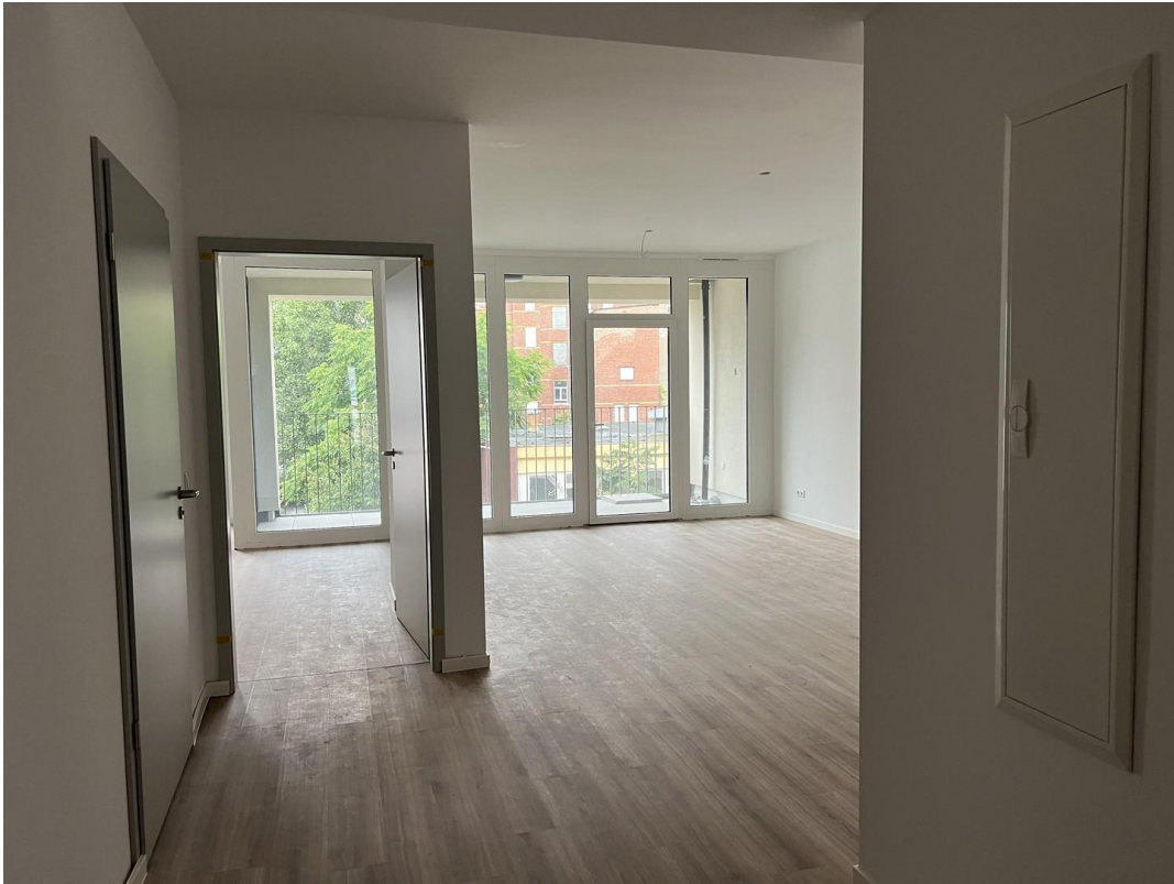
Blick vom Eingangsbereich