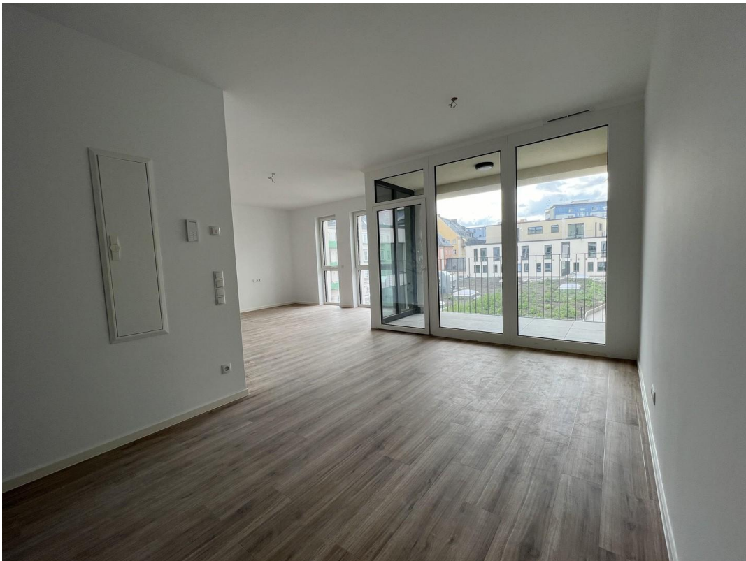
Blick von Eingangsbereich