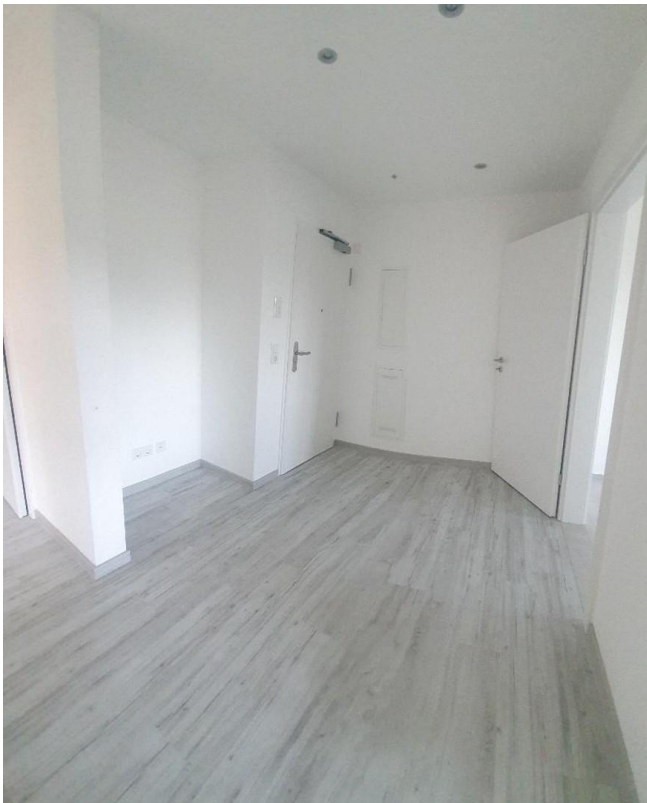
Eingangsbereich / Flur