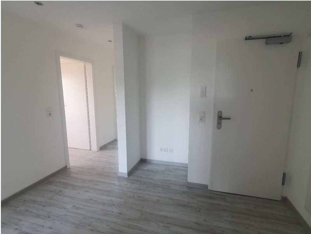
Eingangsbereich / Flur