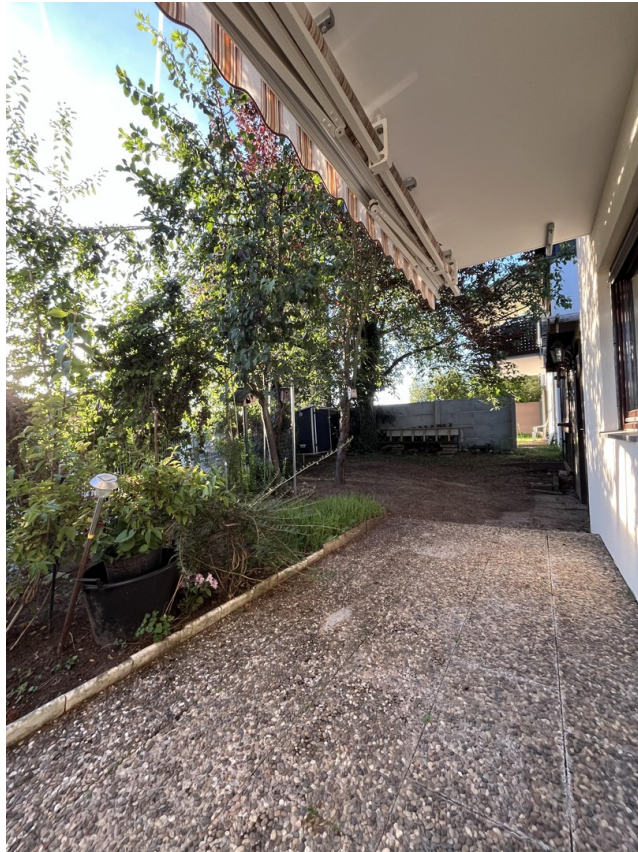
Garten & Terrasse