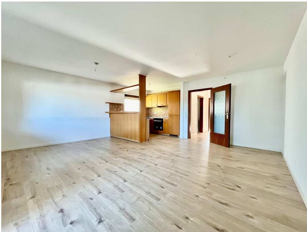
Wohnbereich & Küche