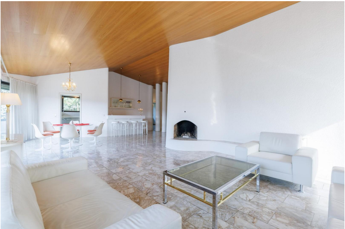
Wohnzimmer Blick auf Kamin