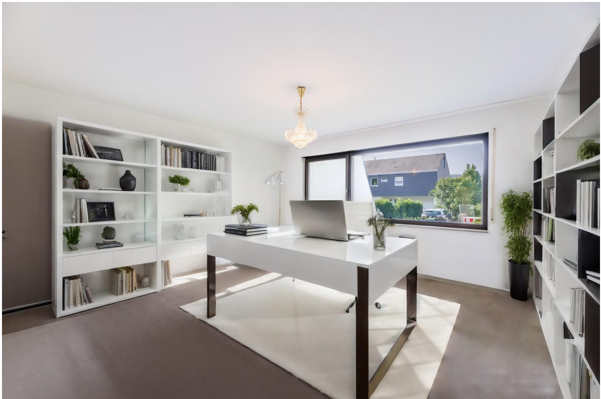
Büro - Virtual Staging