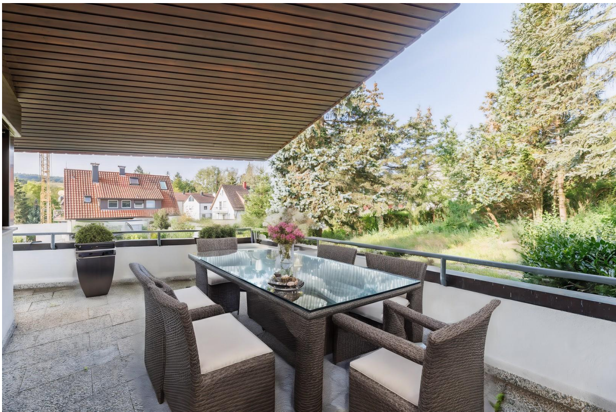
Terrasse: Virtual Staging