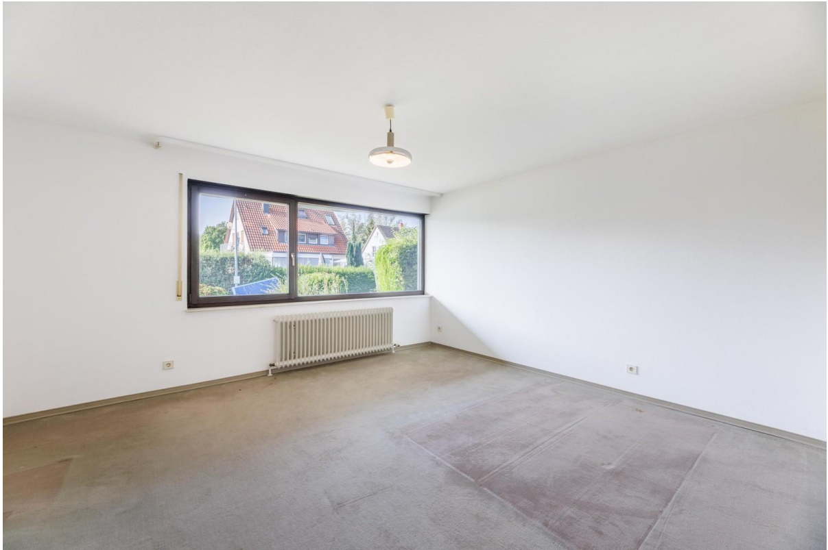
Zimmer 1 UG