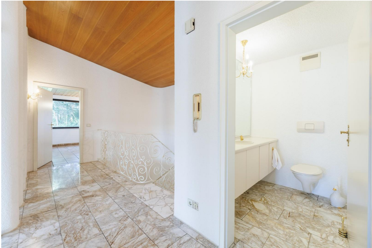
Gäste WC im OG