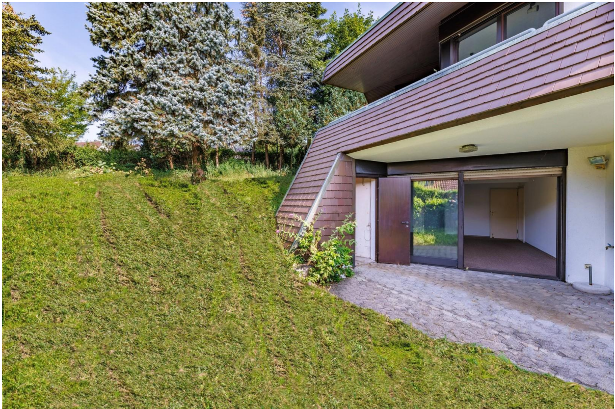
Außenansicht - Unterer Garten