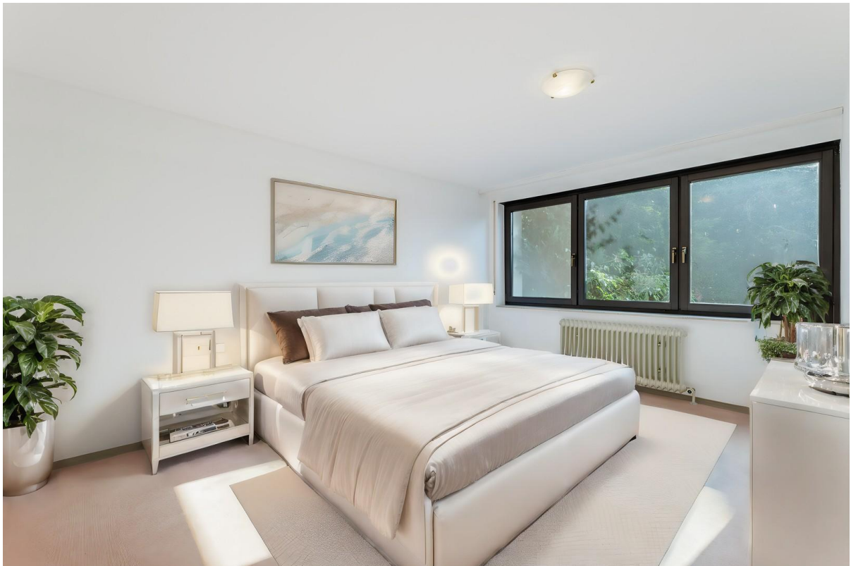
OG Schlafz. Virtual Staging