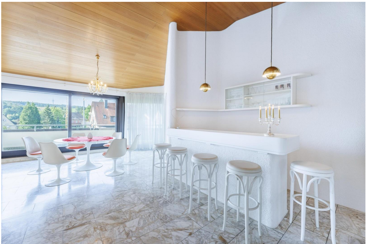
Bar im Wohnzimmer