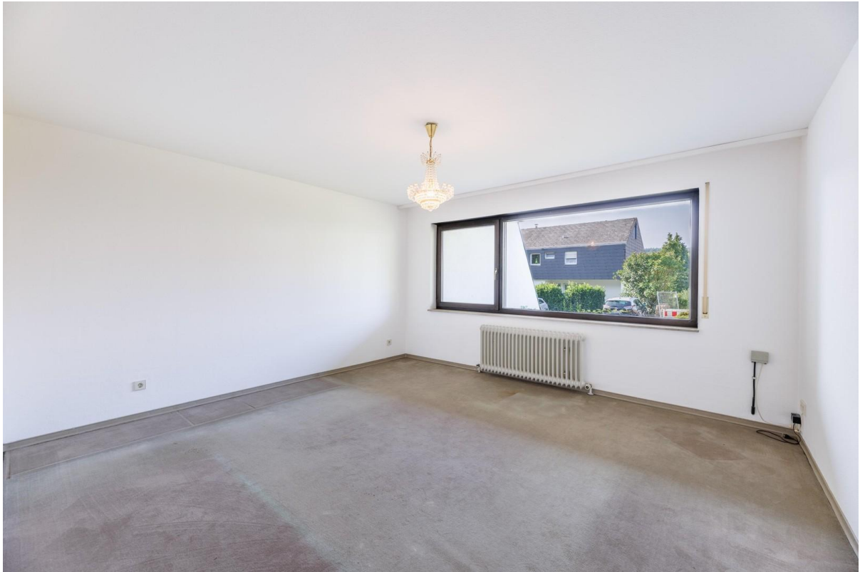
Zimmer 2 UG (Schlafz. / Büro)