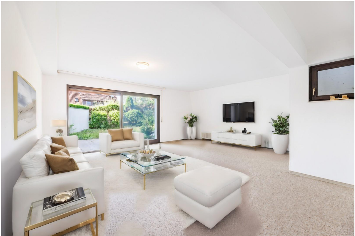
Hobbyraum - Wohnzimmer - VS