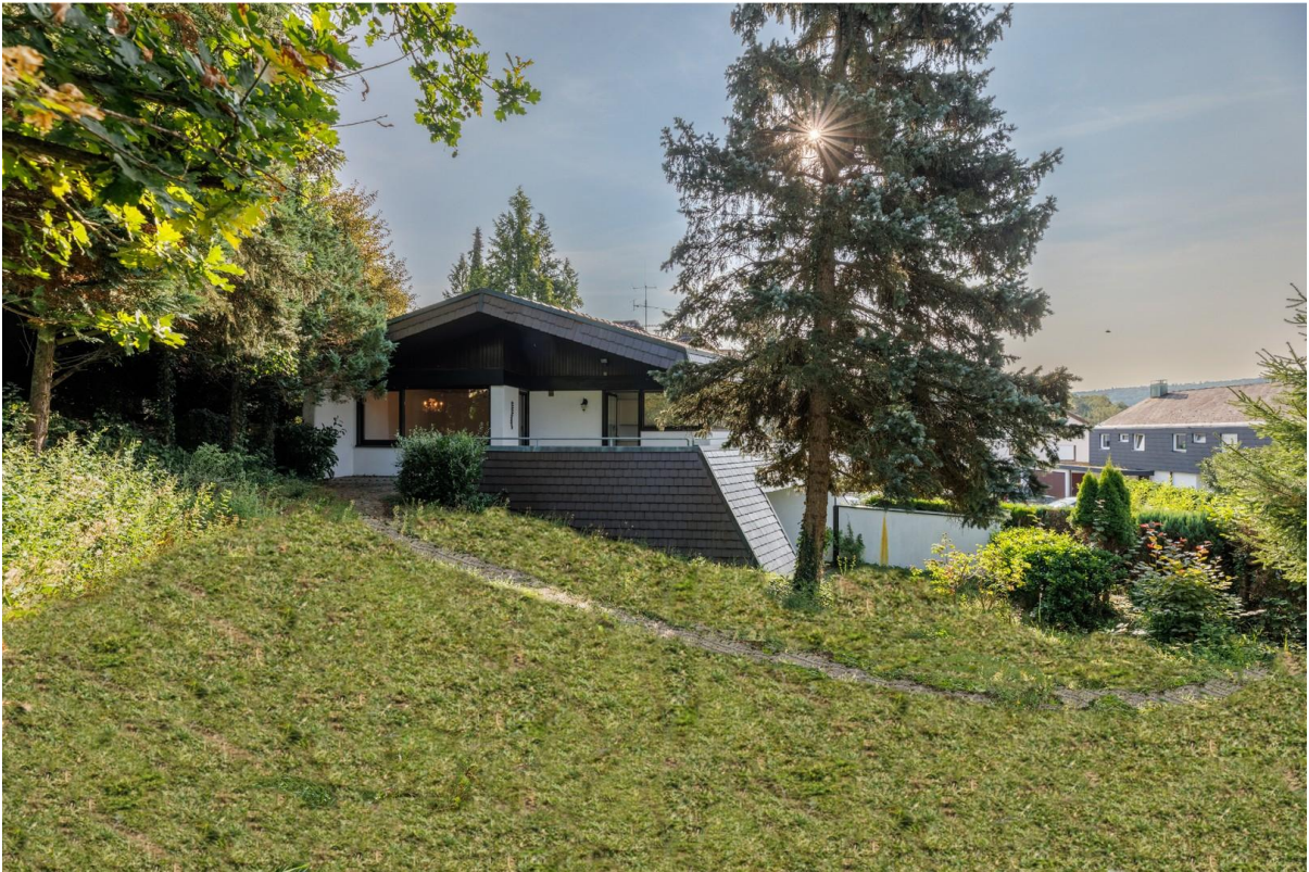
Blick aus dem Garten