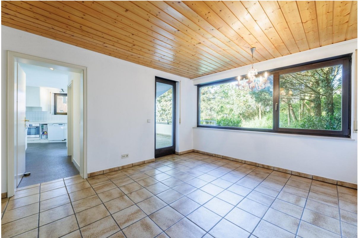
Mehrzweckraum im OG