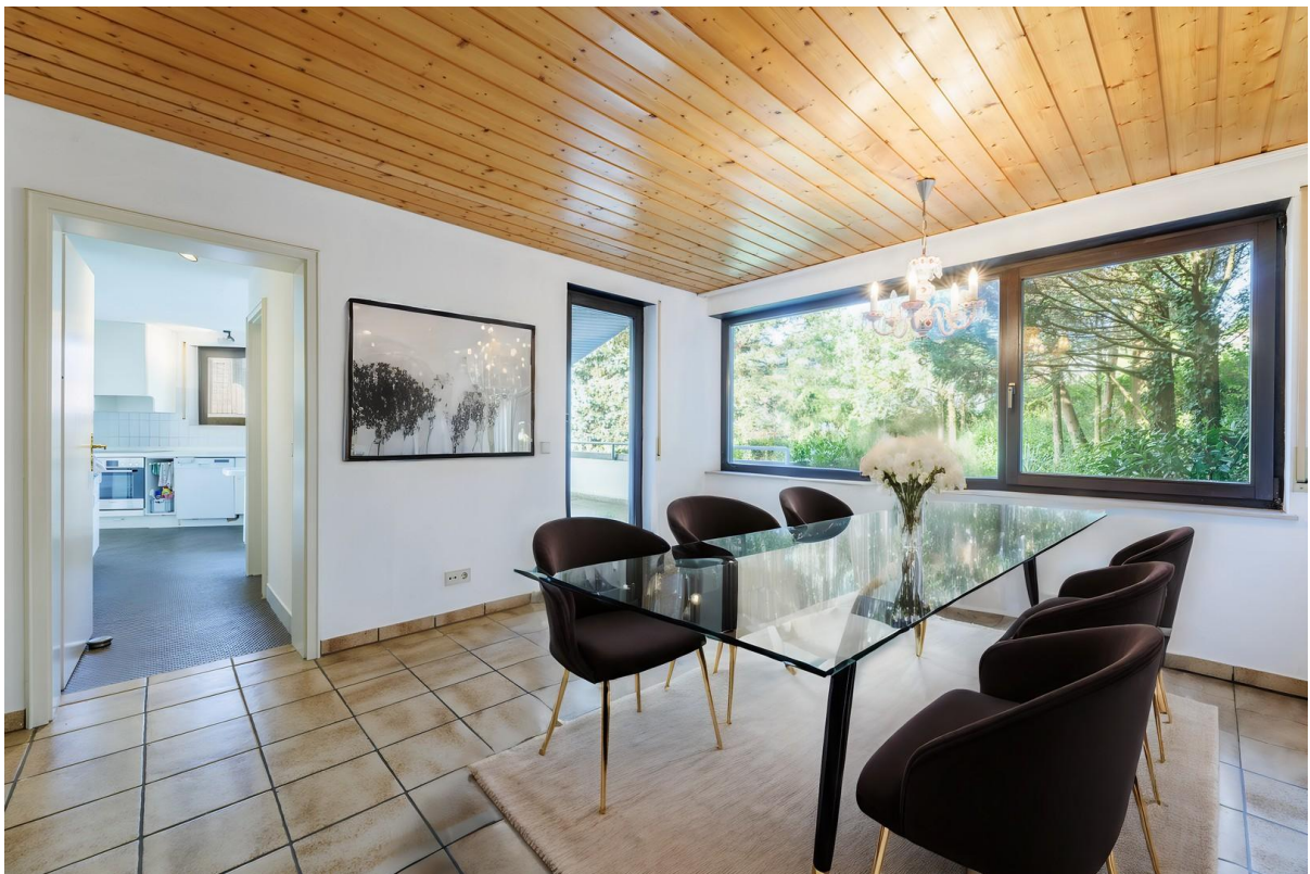
Mehrzweckraum: Virtual Staging