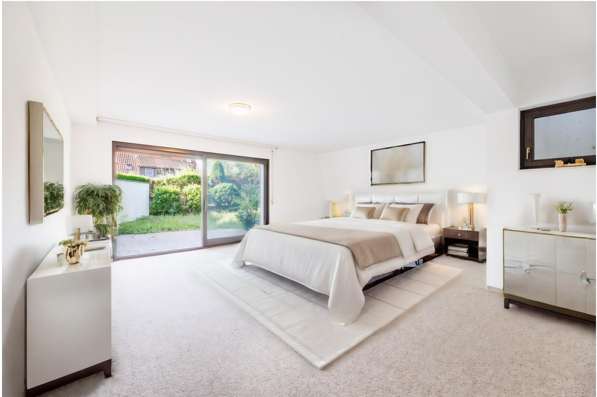
Hobbyraum - Schlafzimmer - VS