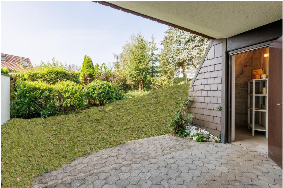
Gerätezimmer im Garten