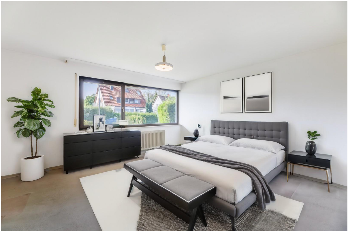
Schlafz. UG: Virtual Staging