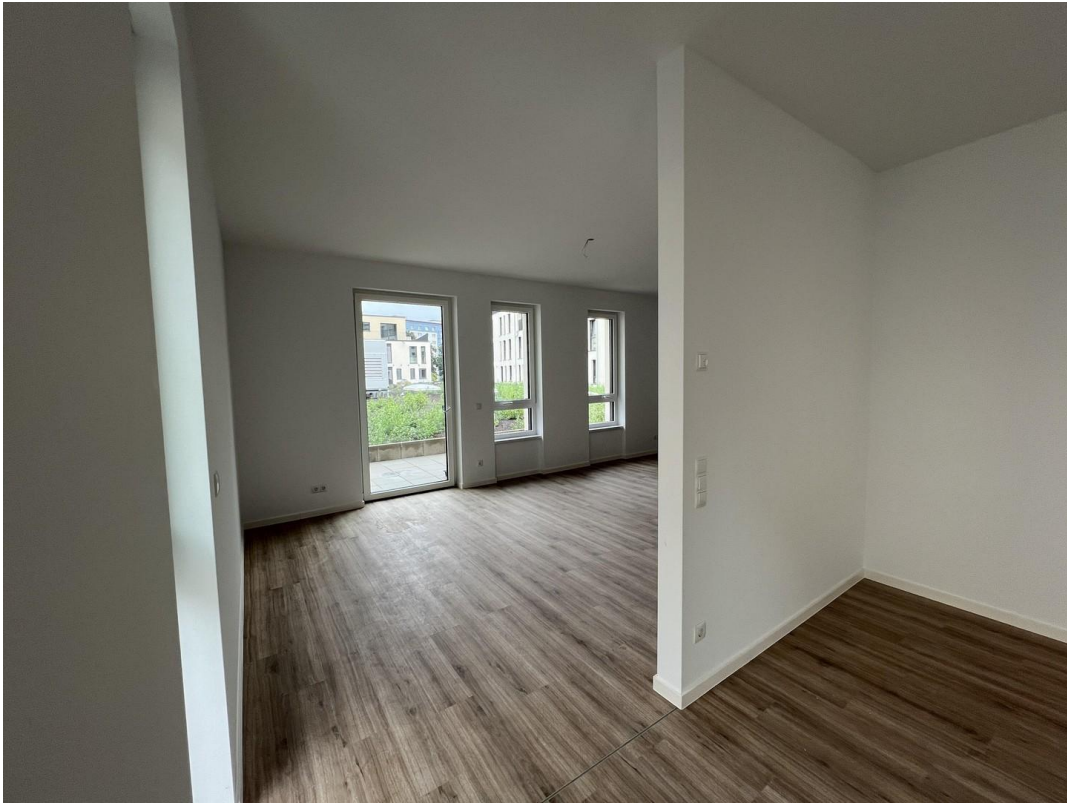
Blick von Schlafbereich