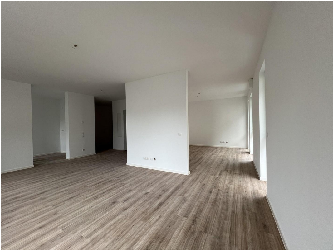
Blick von Terrasse