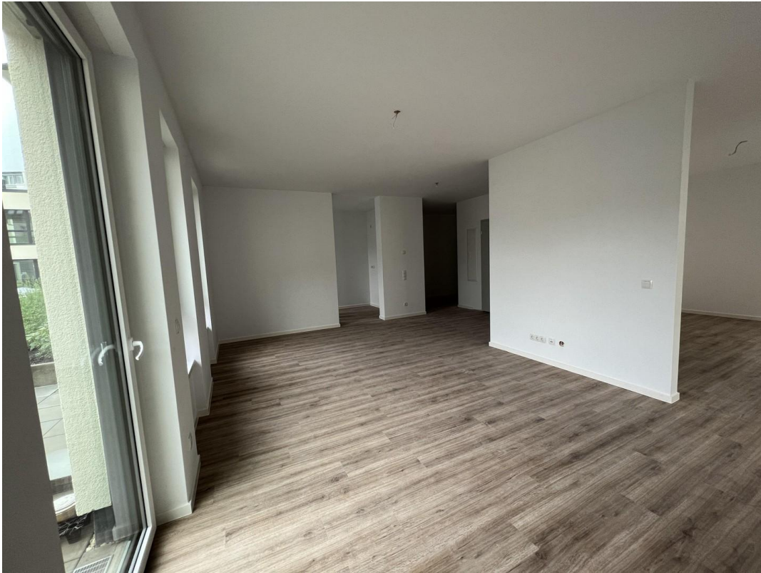
Blick von Terrasse