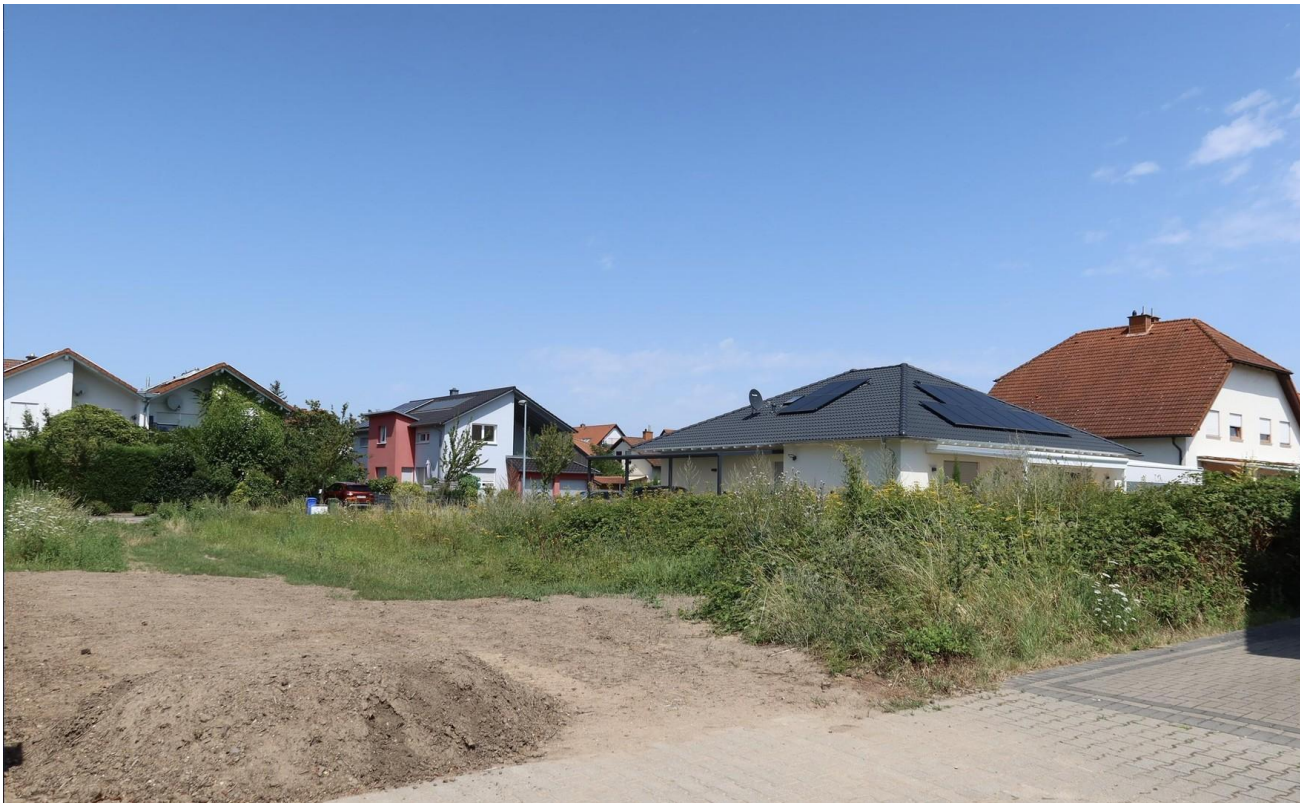
von Süden (Am Parkfriedhof)