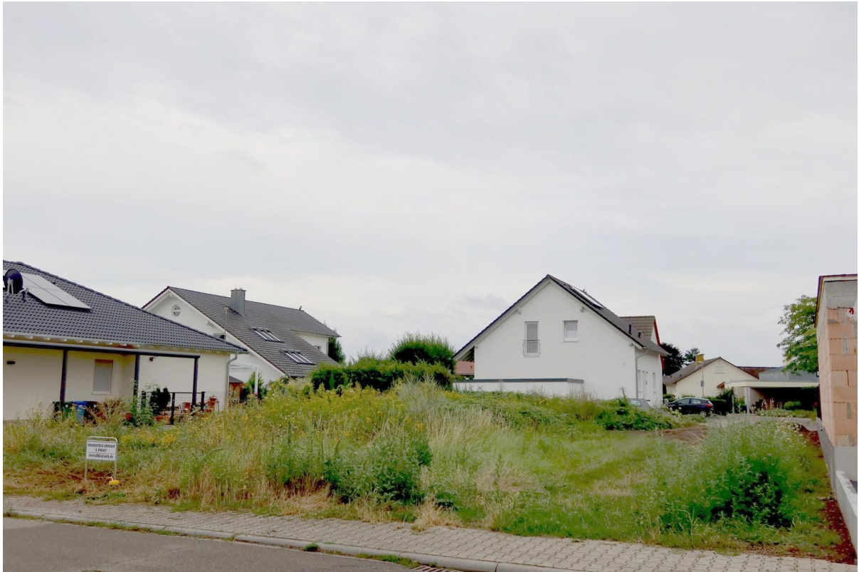
von Norden (Otto-Dill-Str.)