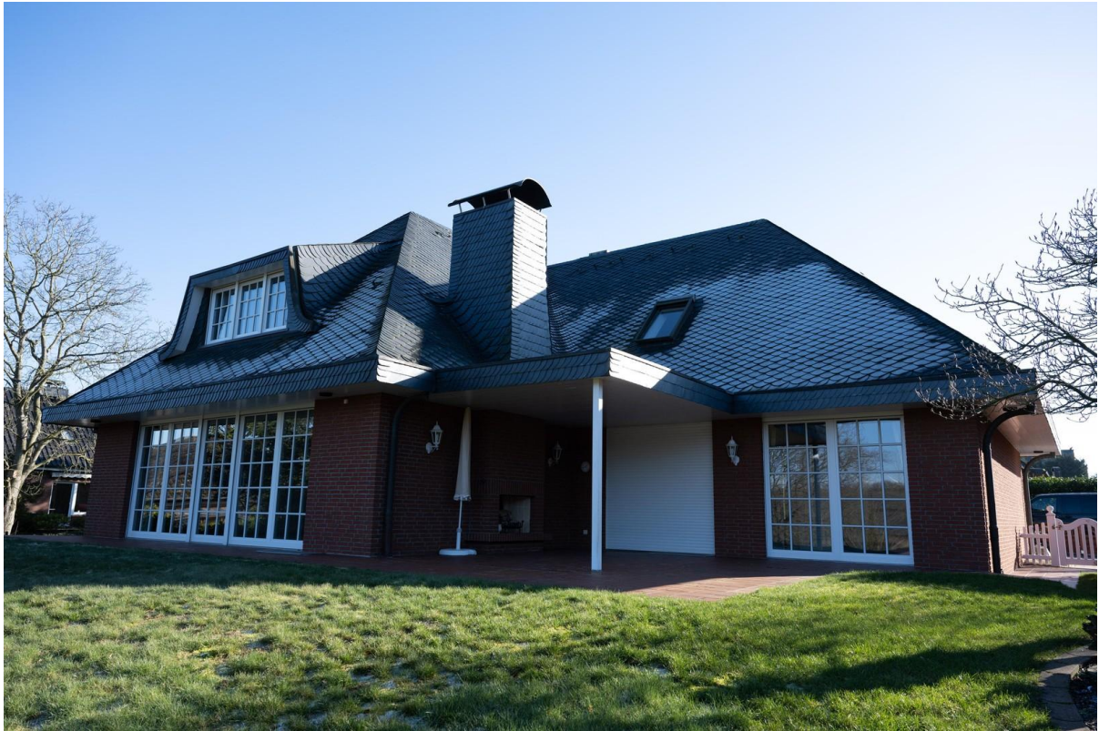
Rückseite mit Terrassen