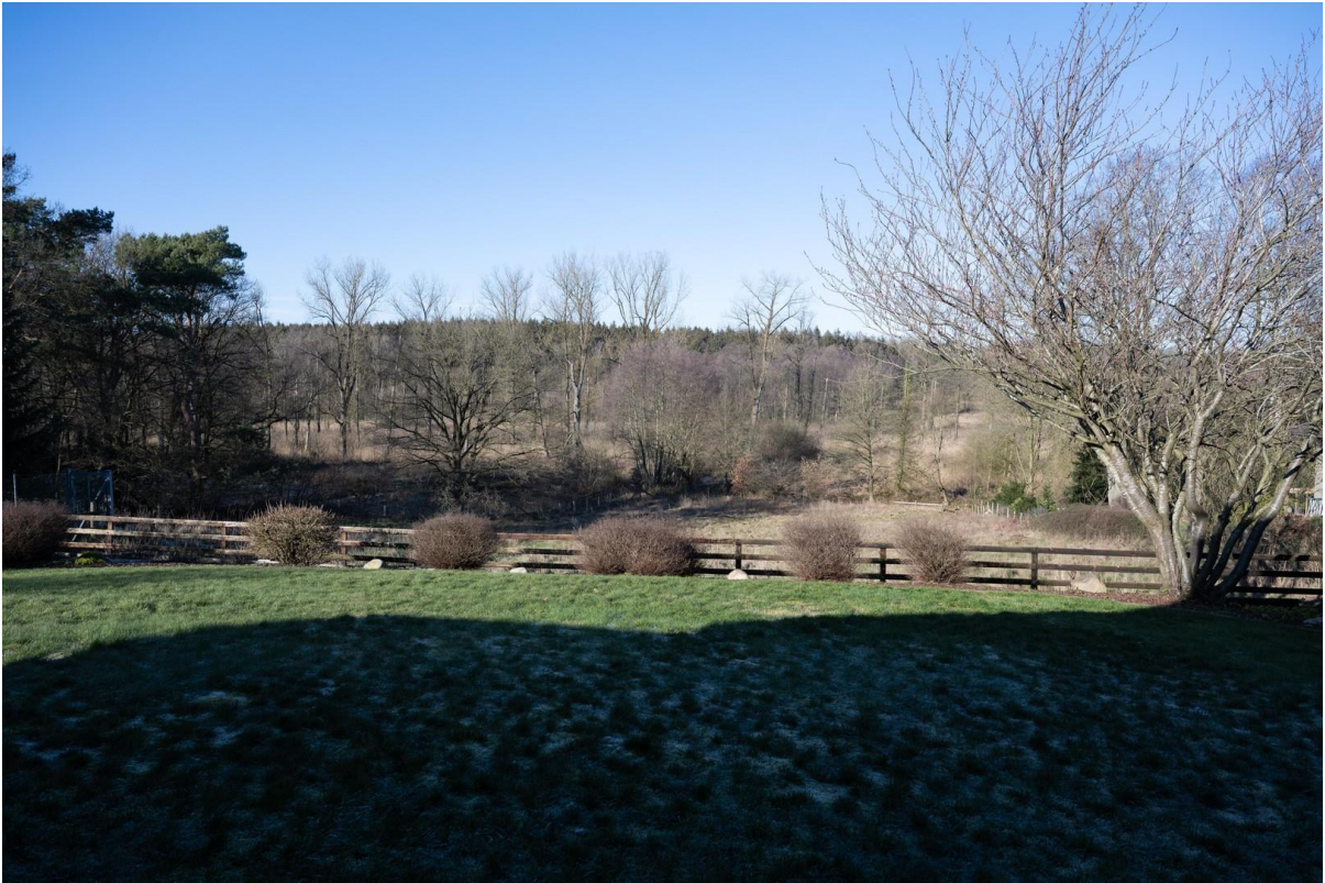
Blick auf die Weide