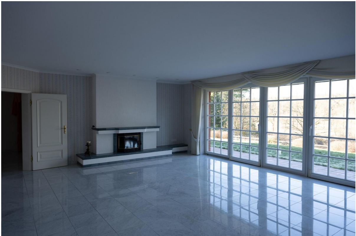
Blick auf den Kamin