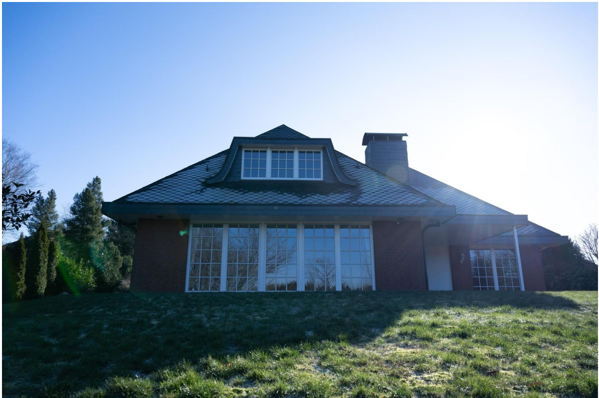
Blick auf das Wohnzimmer