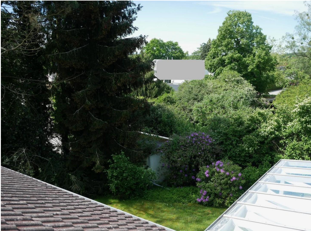
Blick nach SW