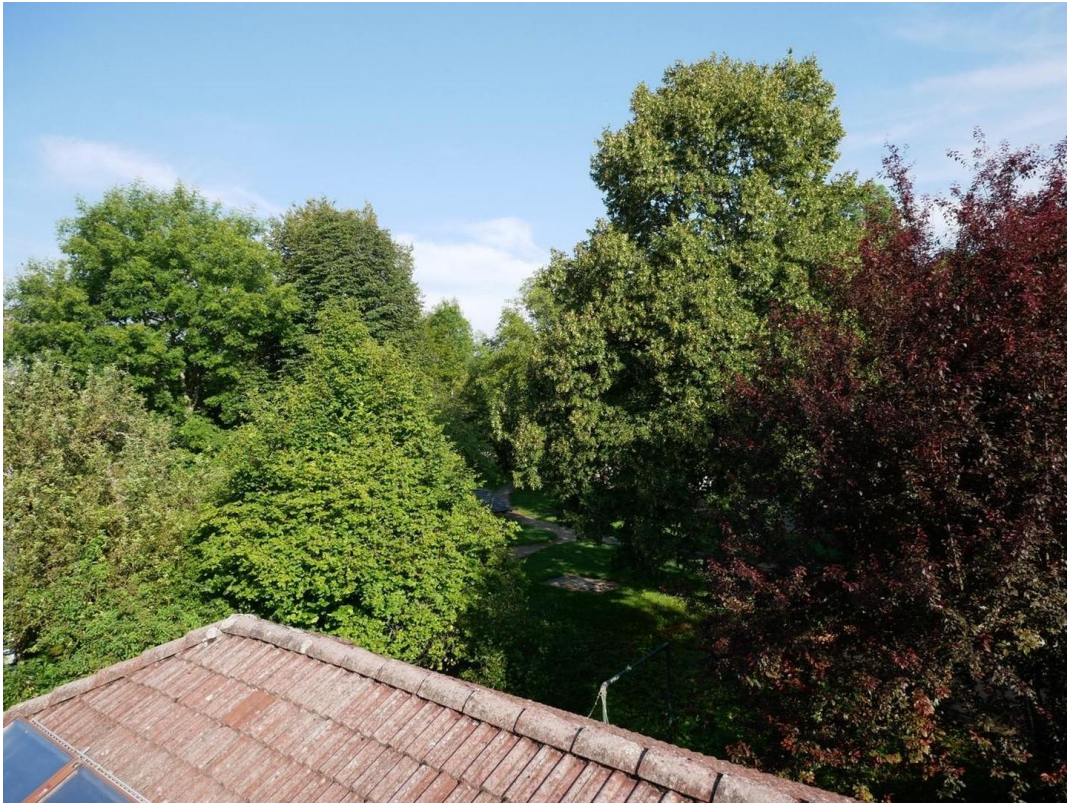
Blick nach N-Westen