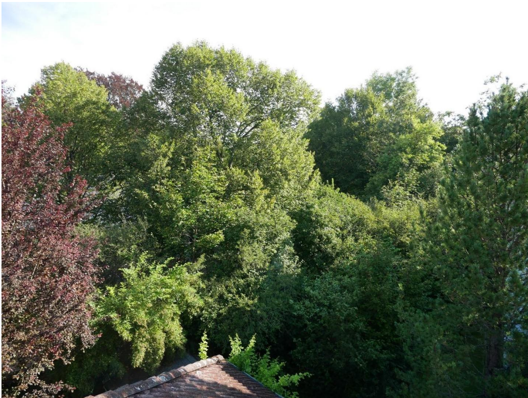
Blick nach Nordost