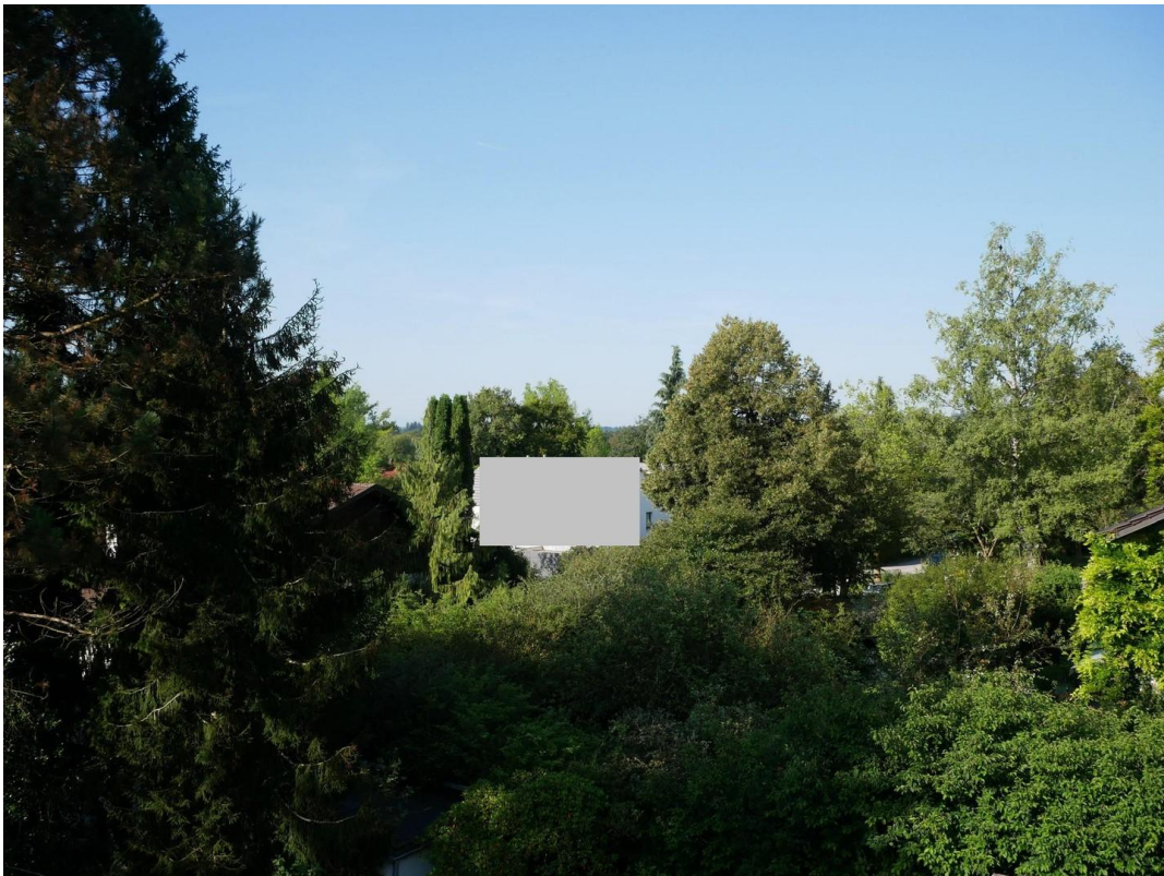
Blick nach SW 2