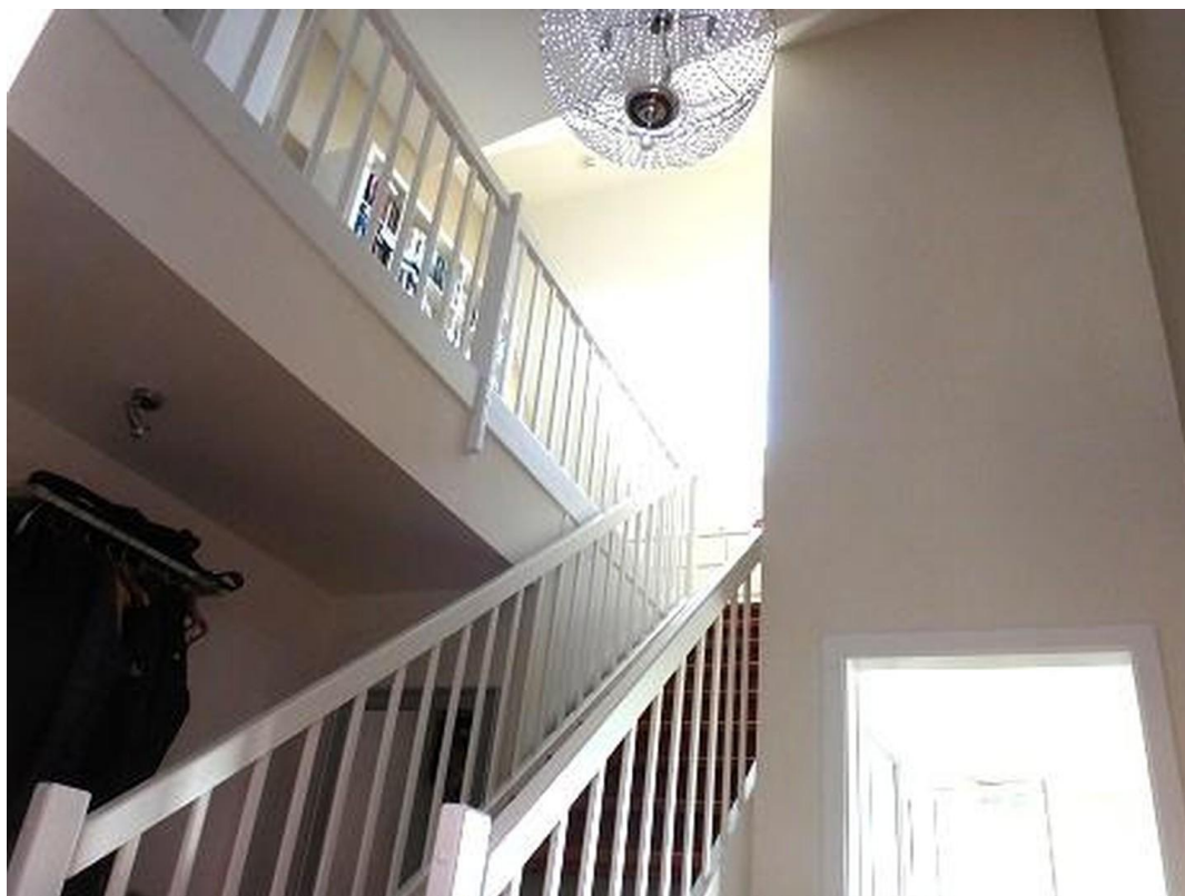
Treppe mit Galerie