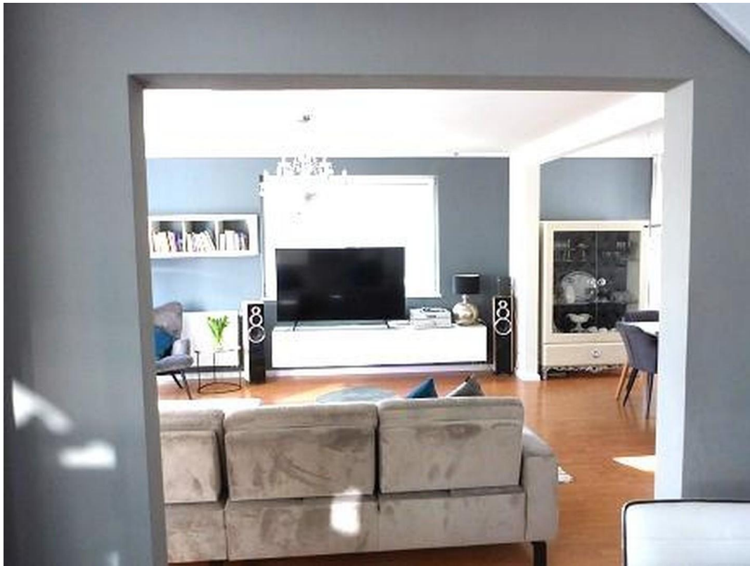
Blick ins offene Wohnzimmer