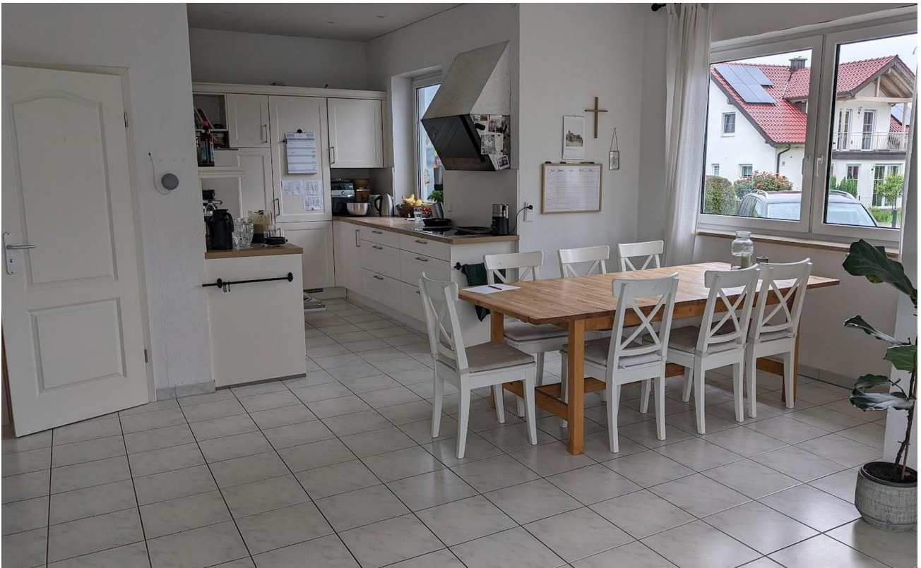
Küche und Esszimmer EG