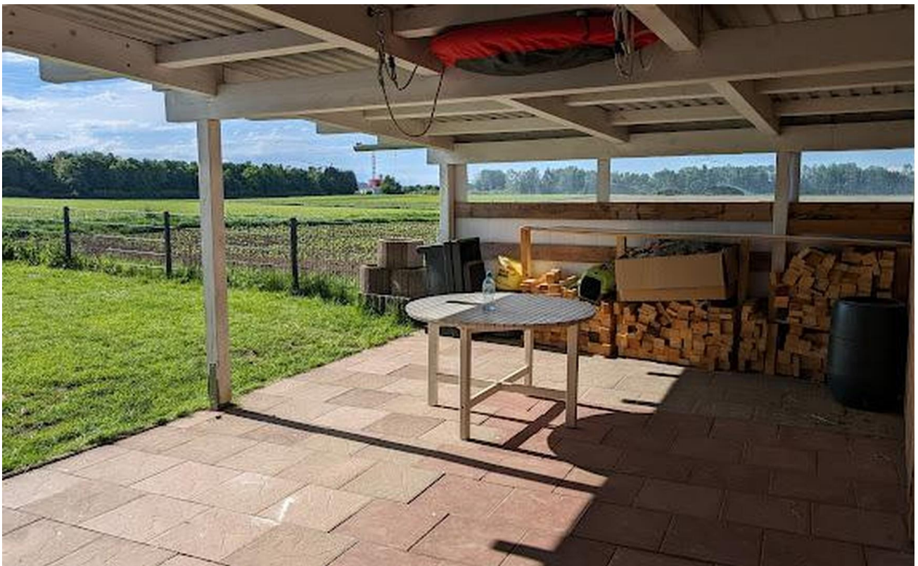
Schuppen mit Ausblick