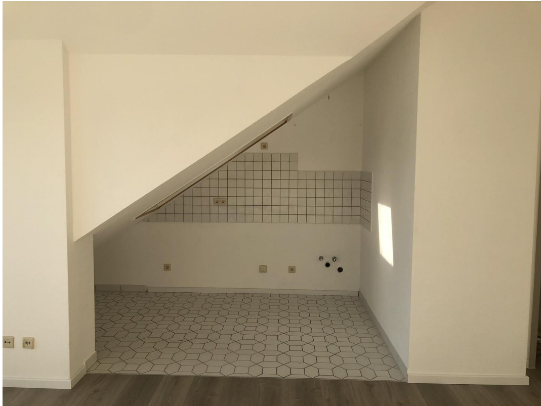
Einbauküche wird noch montiert