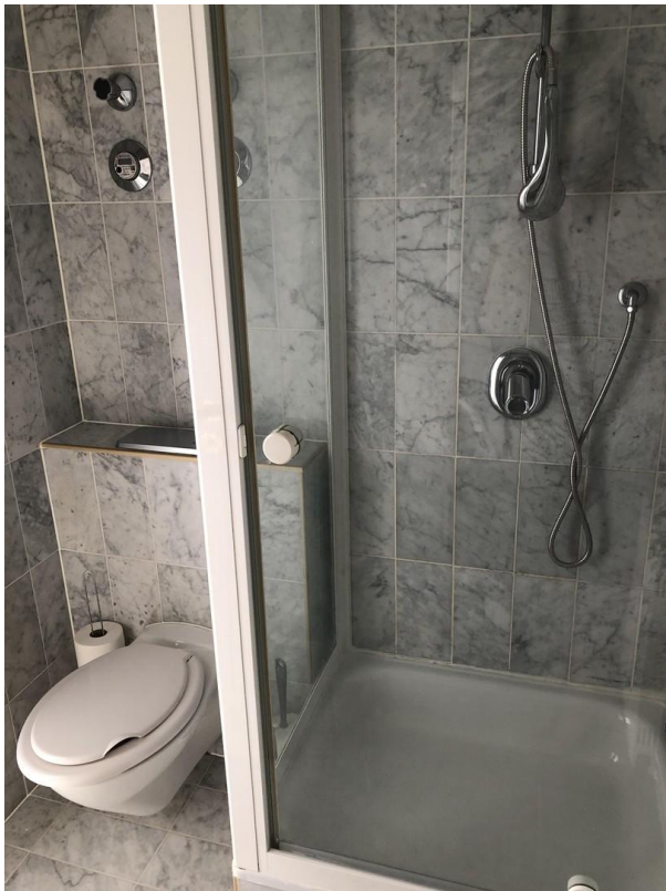
Bad mit WC & Dusche