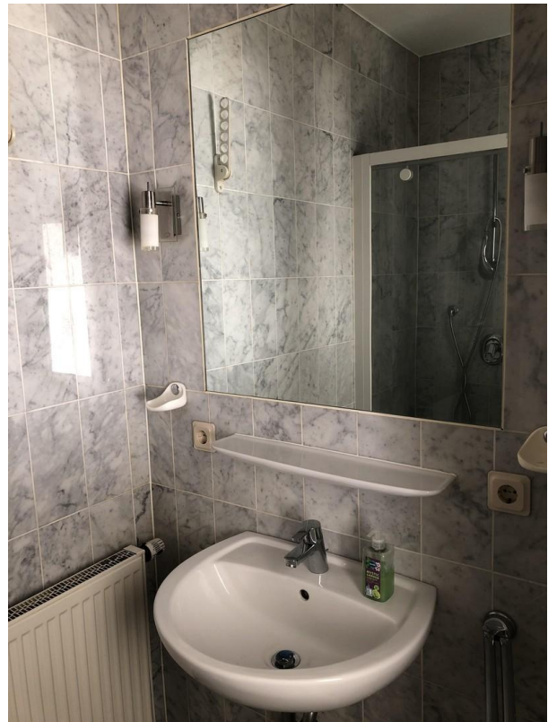
Bad mit großen Einbauspiegel