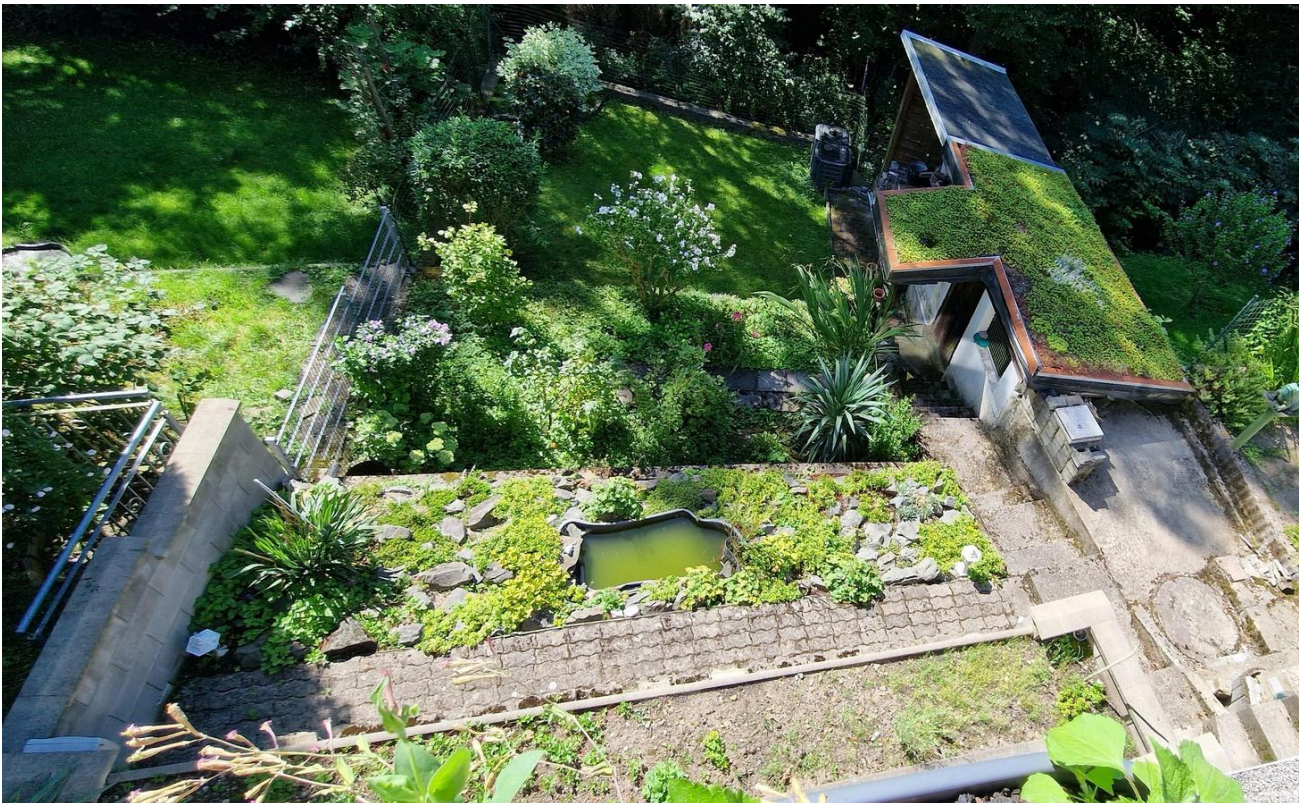
Blick zum Garten