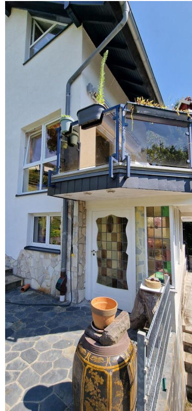
oben Balkon, unten Partyraum