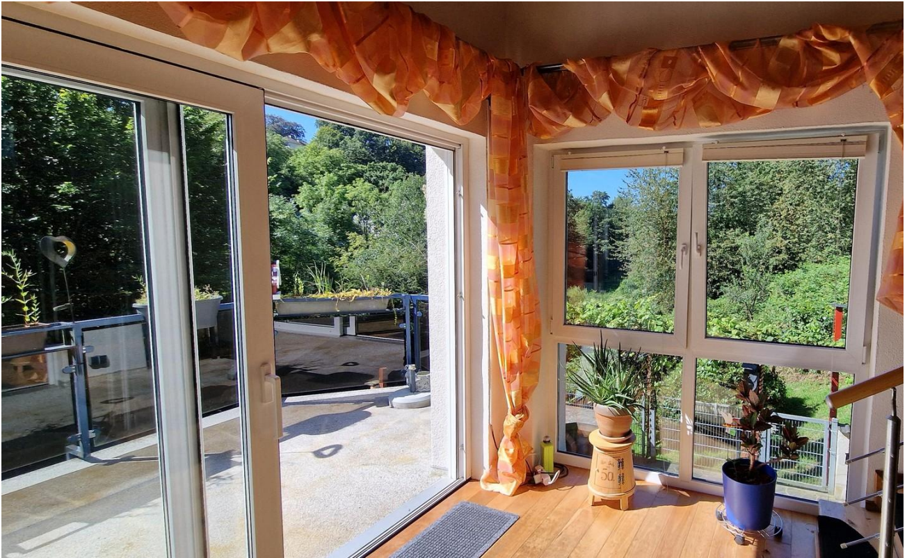
Wohnzimmer zum Balkon