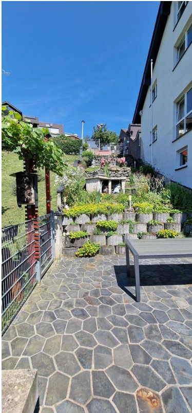
von der Terrasse