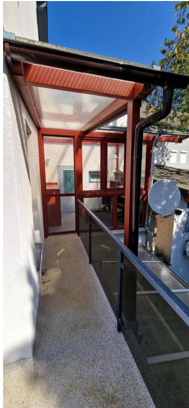
Wintergarten vom Balkon