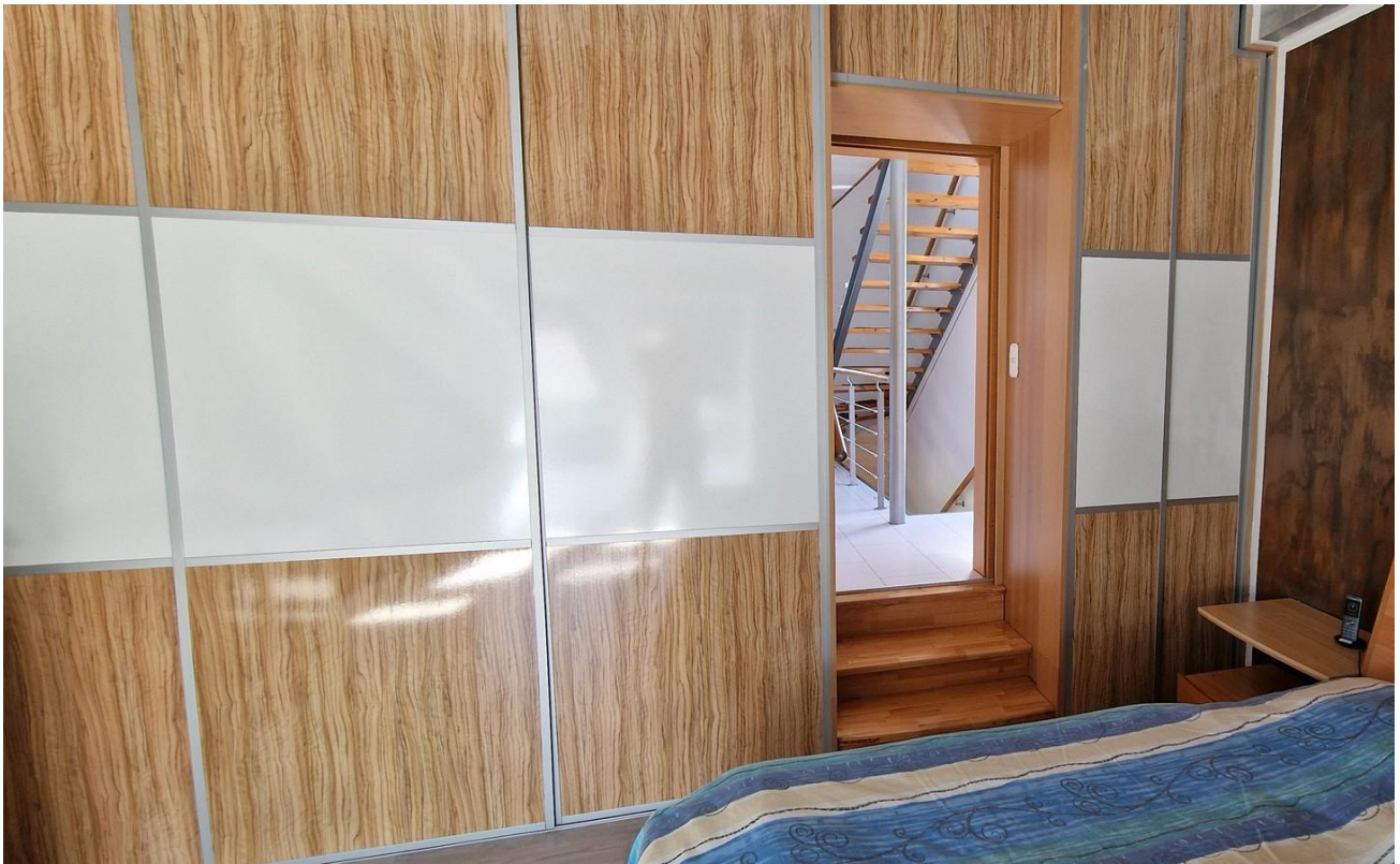
Schlafzimmer mit Einbauschränk