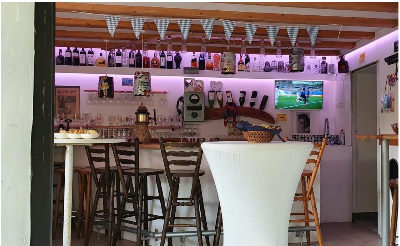
Partyraum mit Toilette