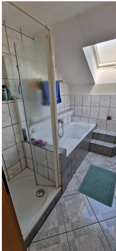
Bad im 1.OG