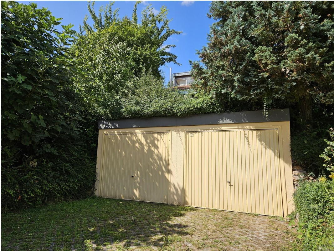
Doppelgarage u. Abstellplätze