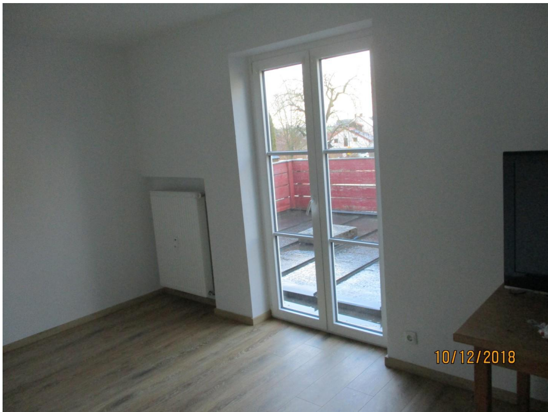
Zimmer zu Terrasse