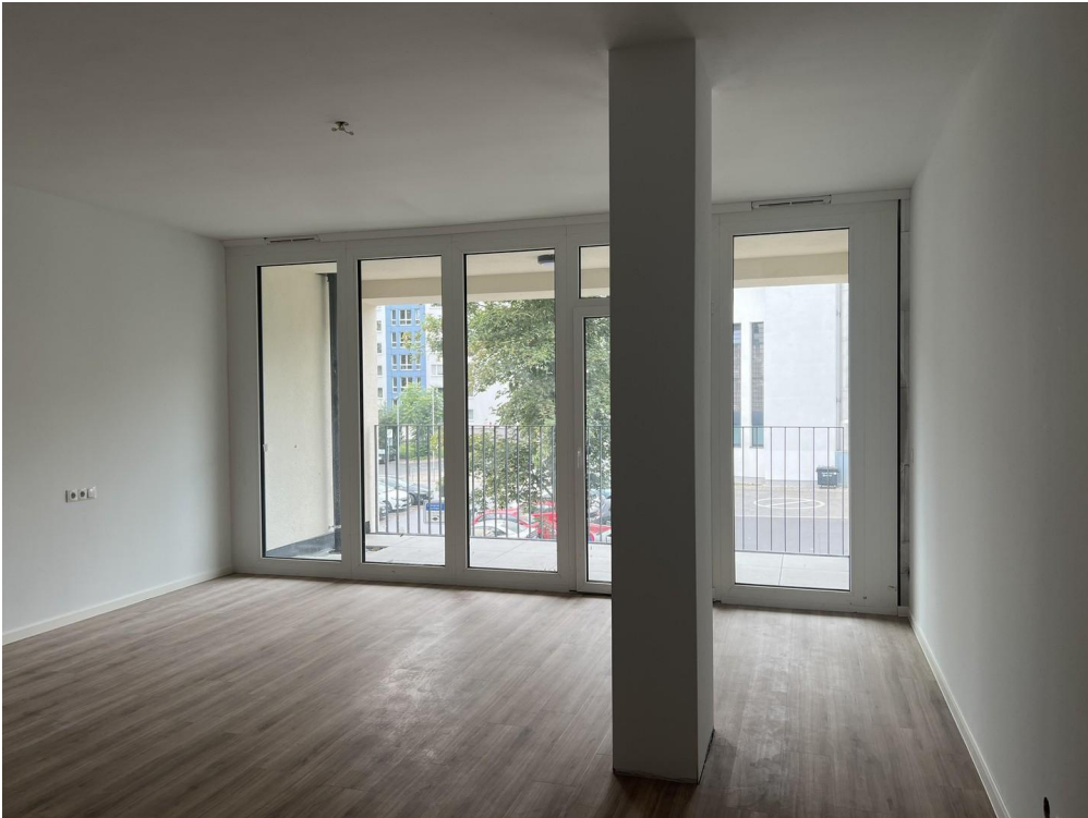
Block zur Loggia