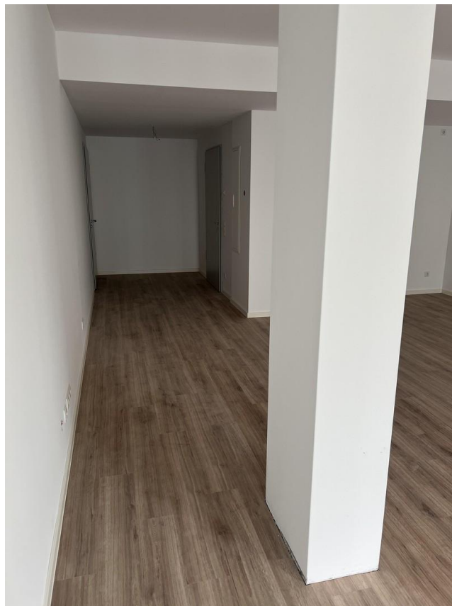
Blick Richtung Eingang