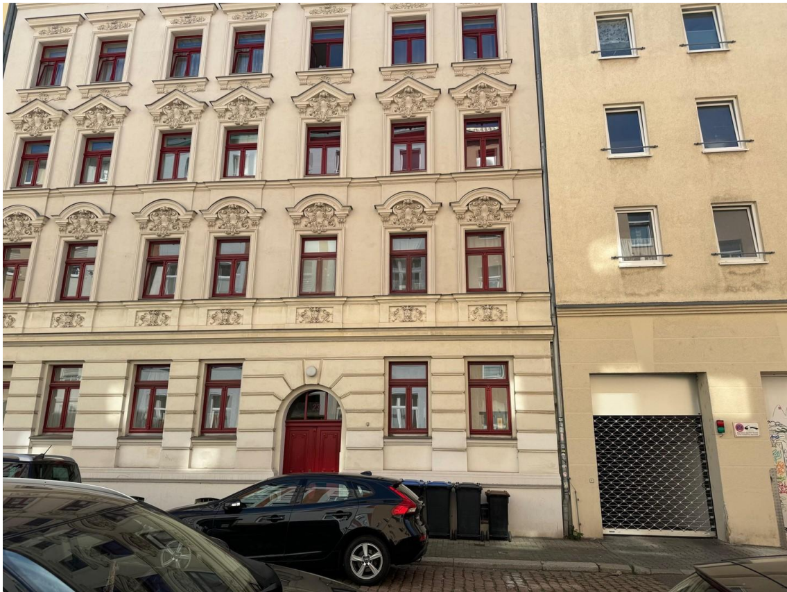
rechts Einfahrt Tiefgarage