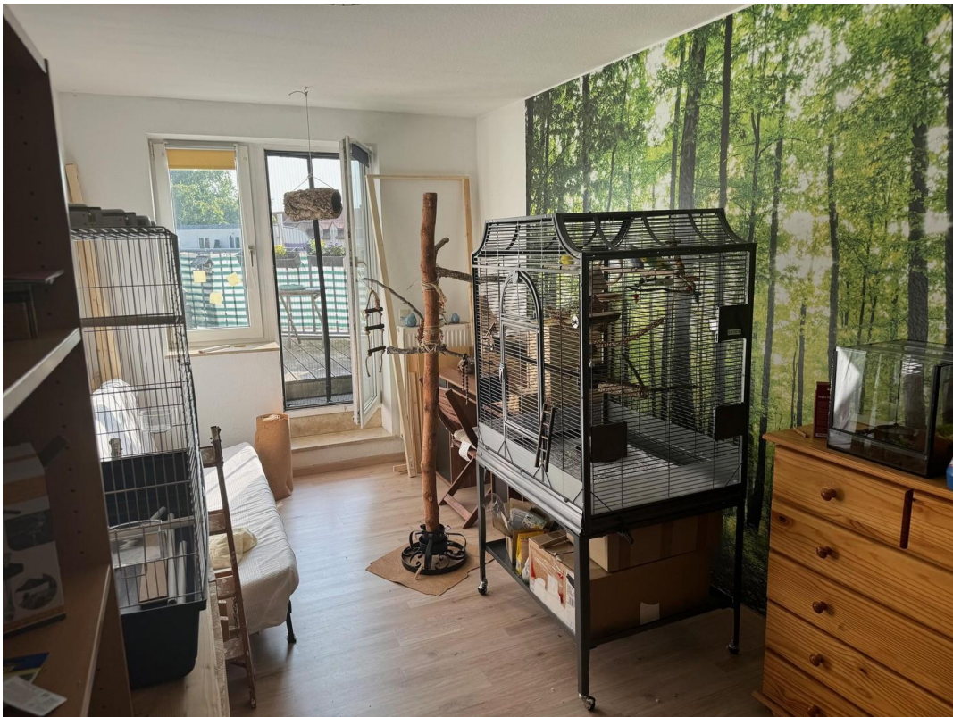
Zimmer mit Terrasse