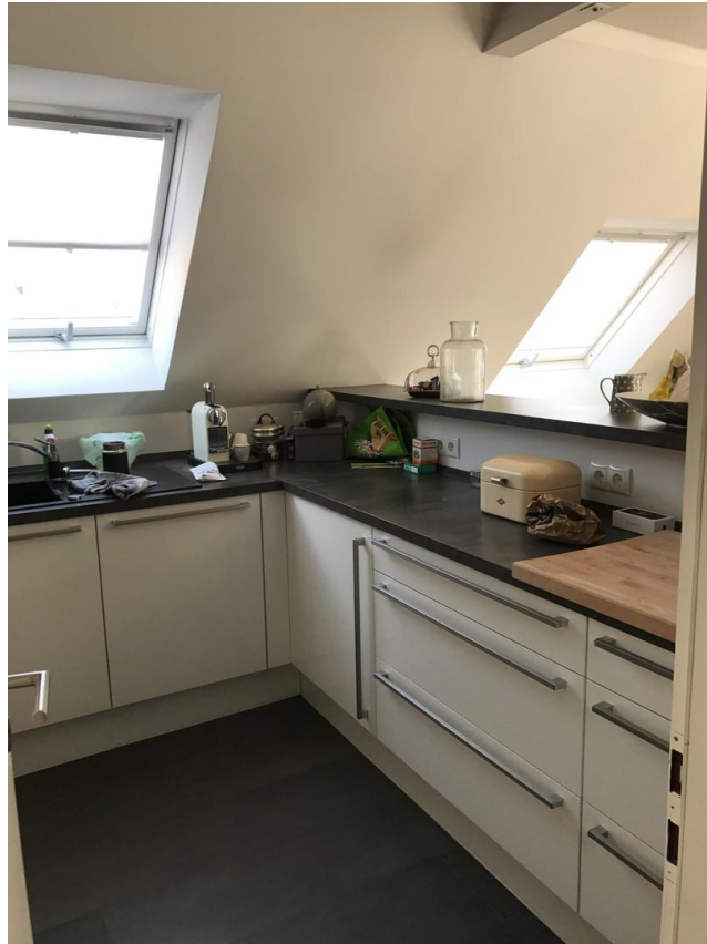
Küche mit Theke