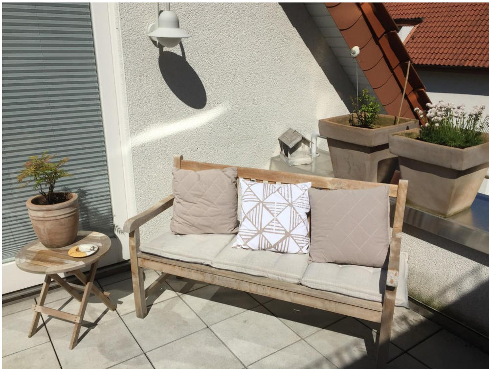
Sonnenplatz der Dachterrasse