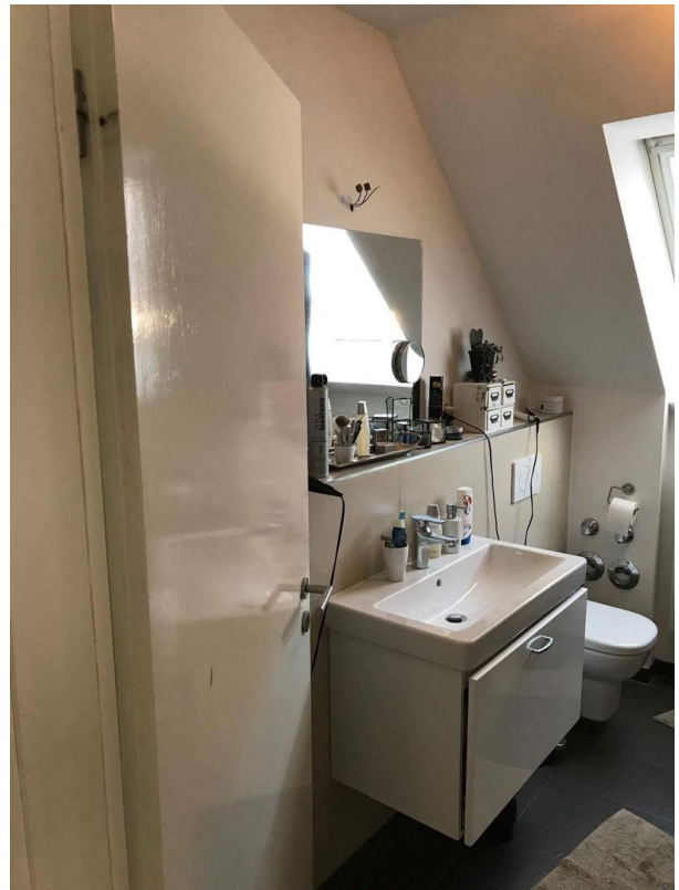
diskreter Blick ins Hauptbad