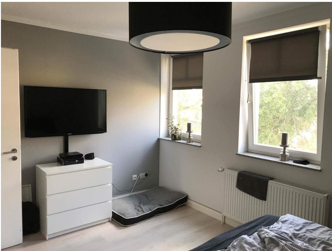
Schlafraum/ optional Büro