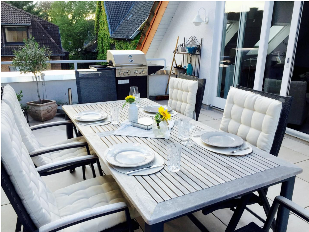
Essplatz der Dachterrasse