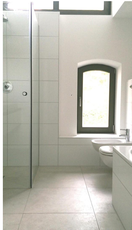
Teil vom Bad 1. OG