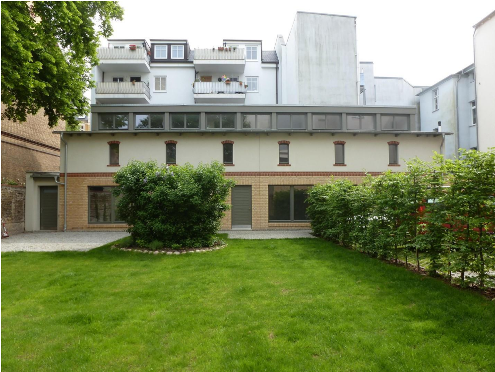
Blick von Grundstücksgrenze