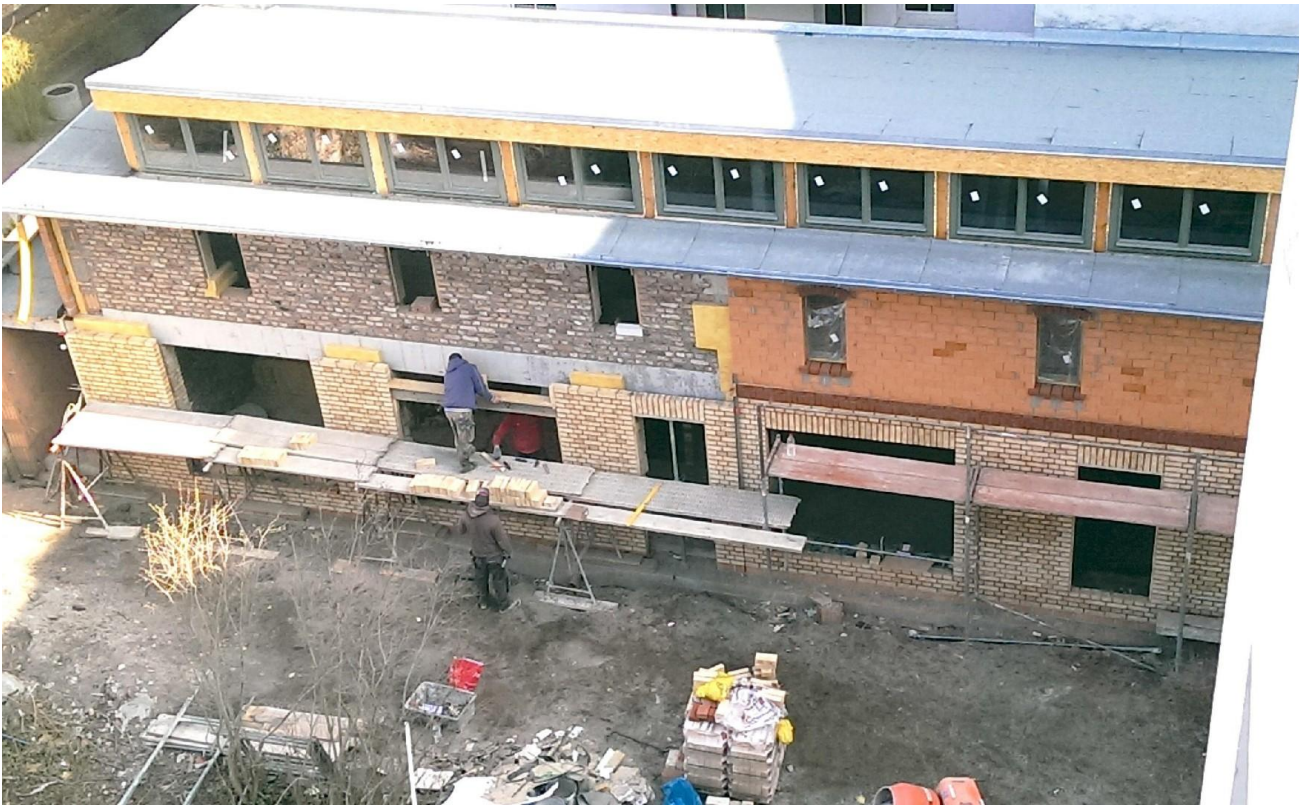
Bauphase (über 10 Jahre her)