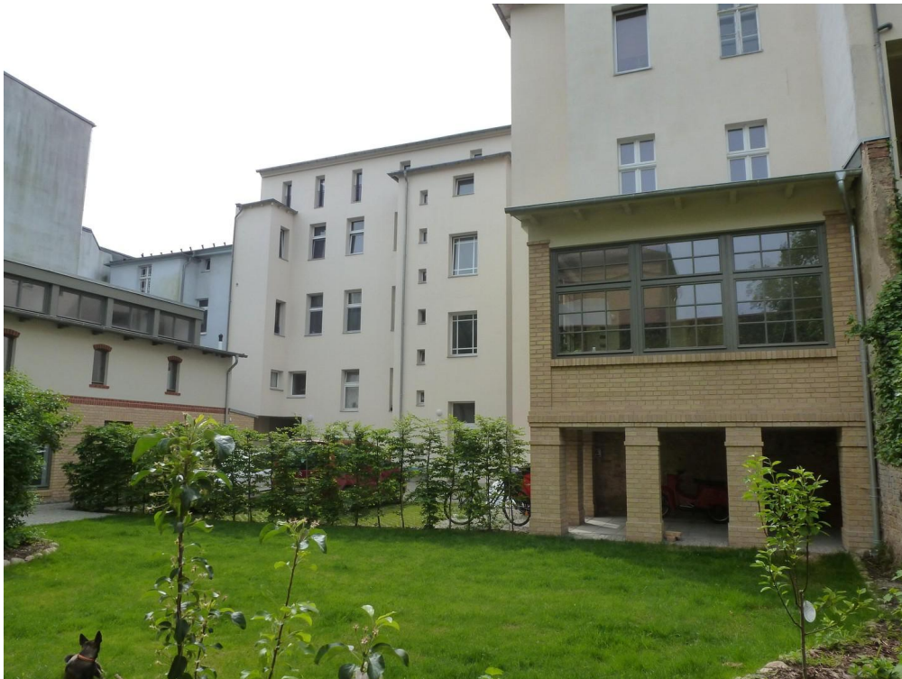
Gartenblick aufs Hauptgebäude