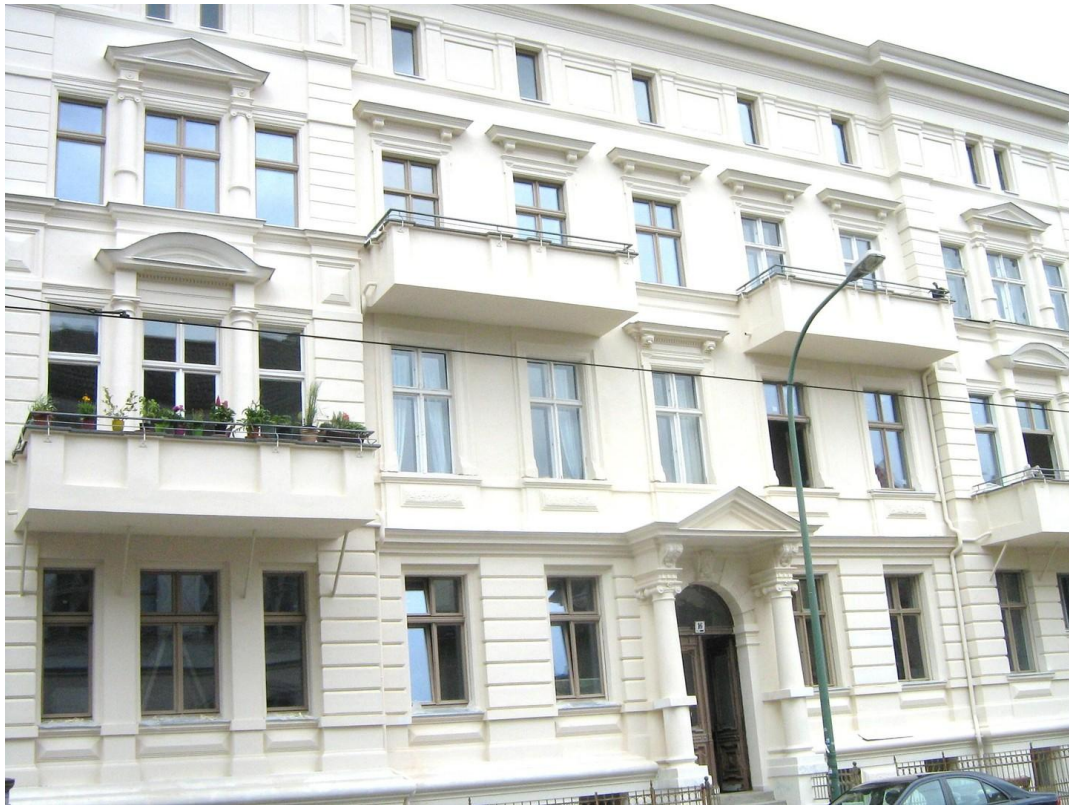
Fassade Haupthaus von Straße