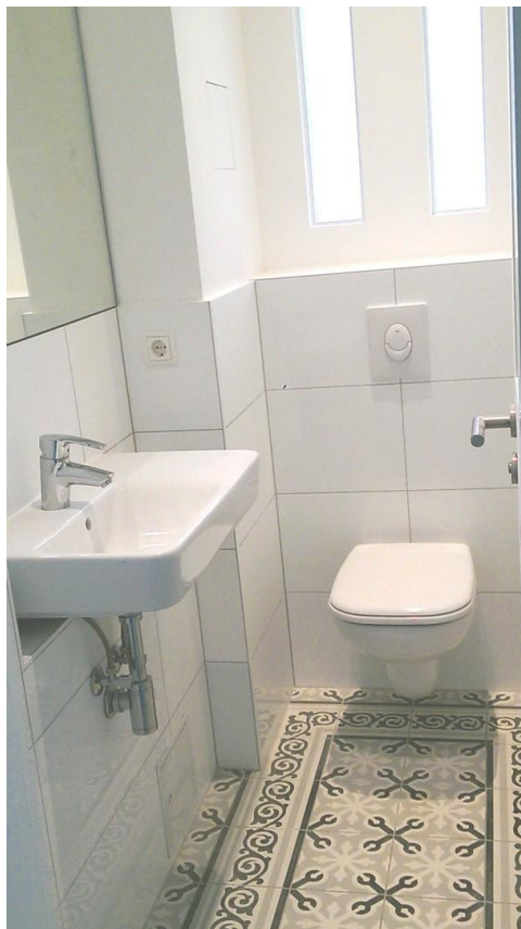
WC im EG