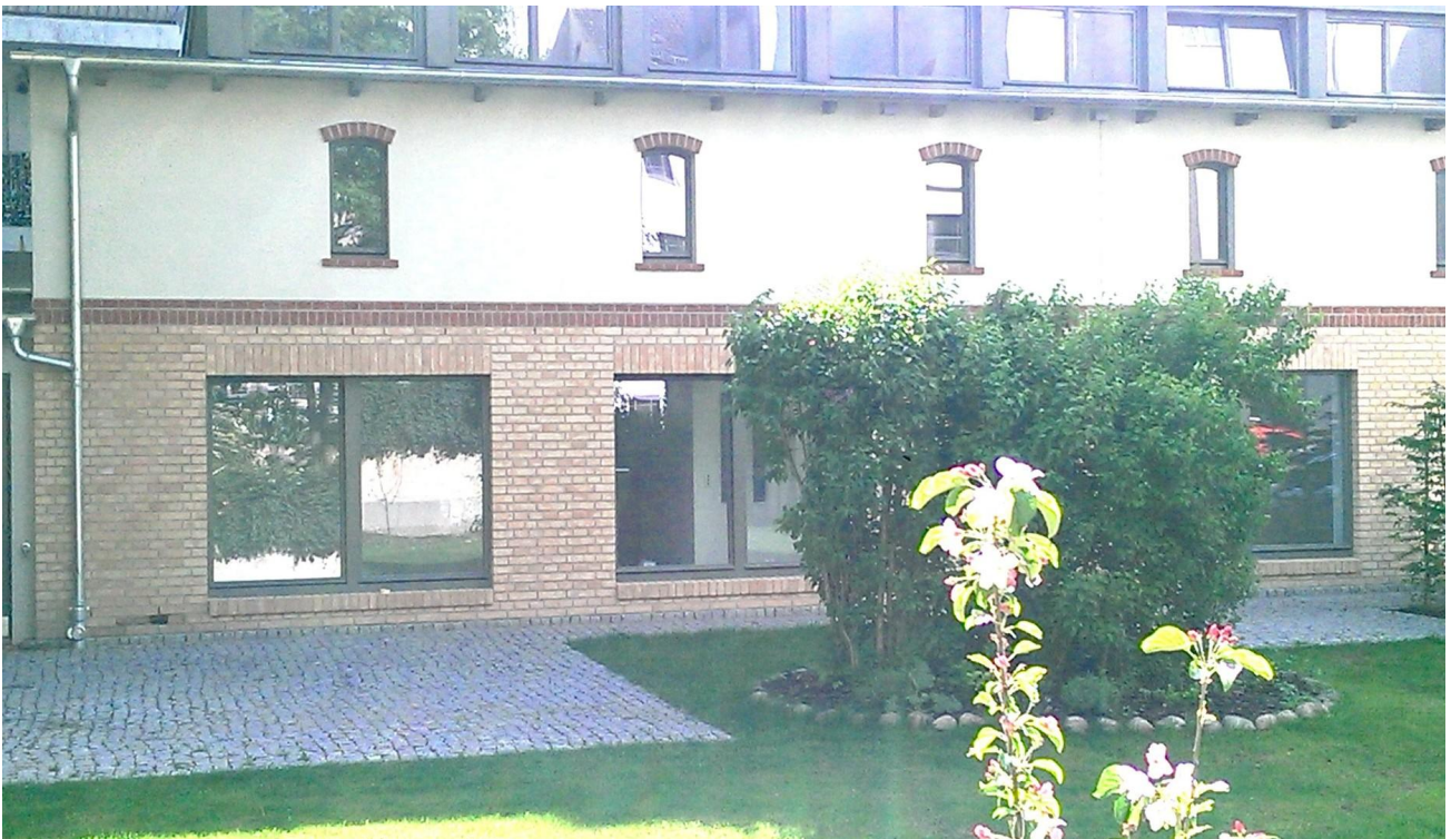
Fassadenteil vom Garten aus