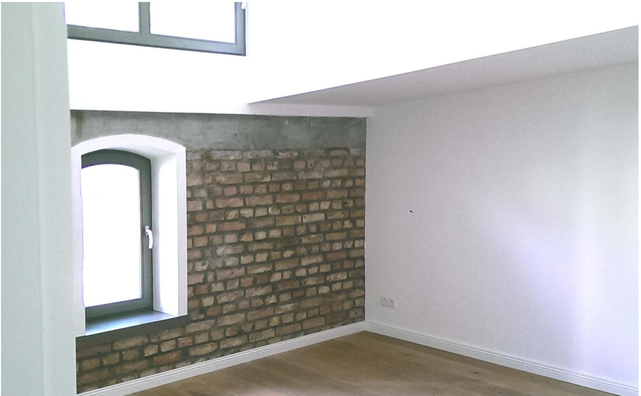
Zimmer im 1. OG