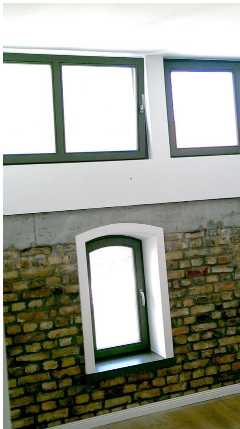
im 1. OG