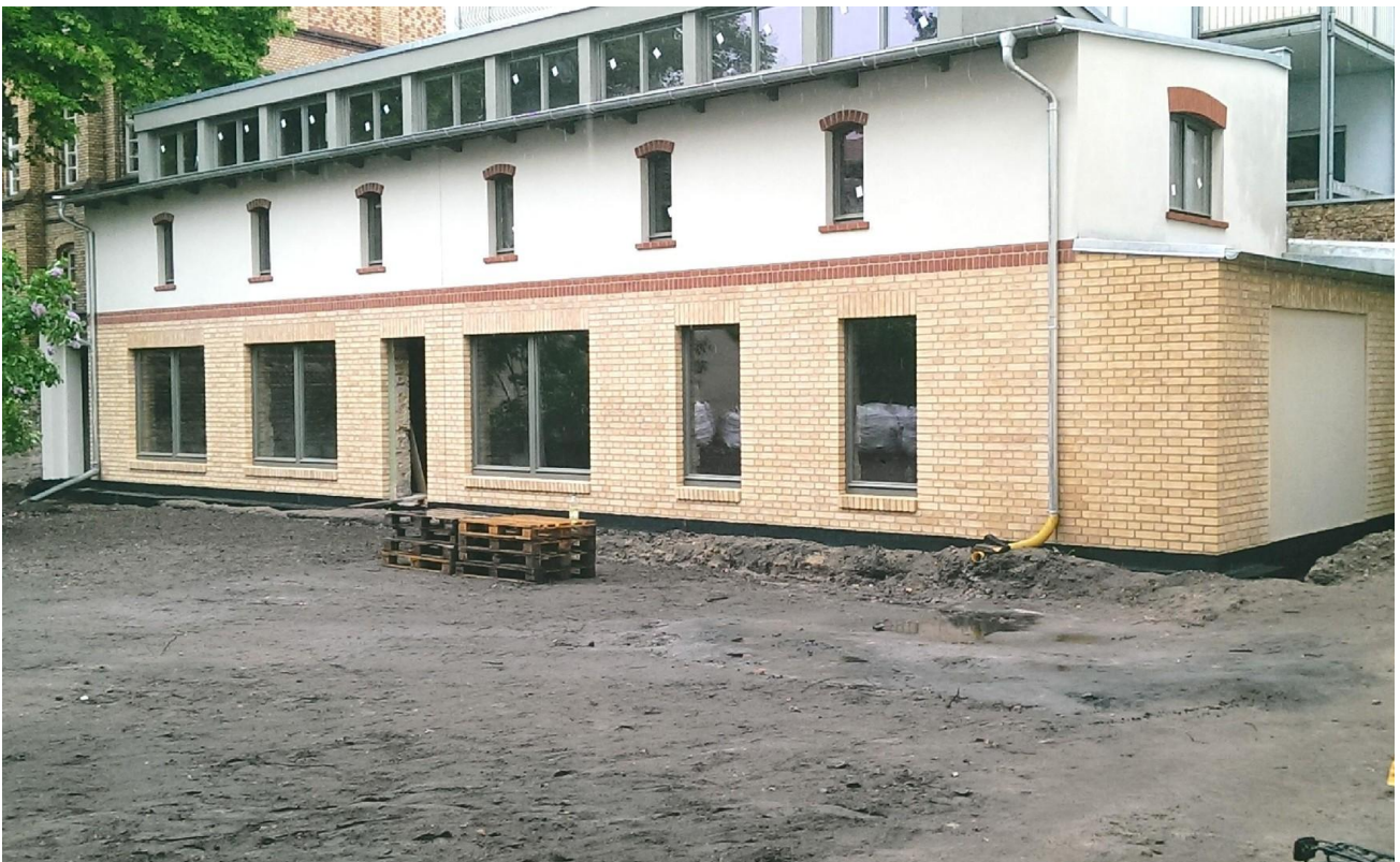
während der Bauphase