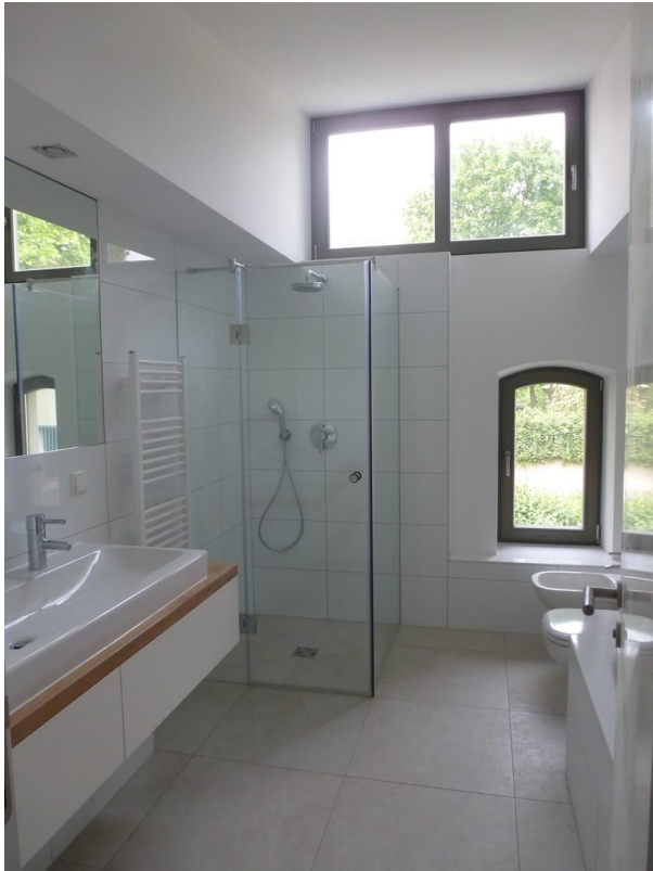
Bad 1. OG