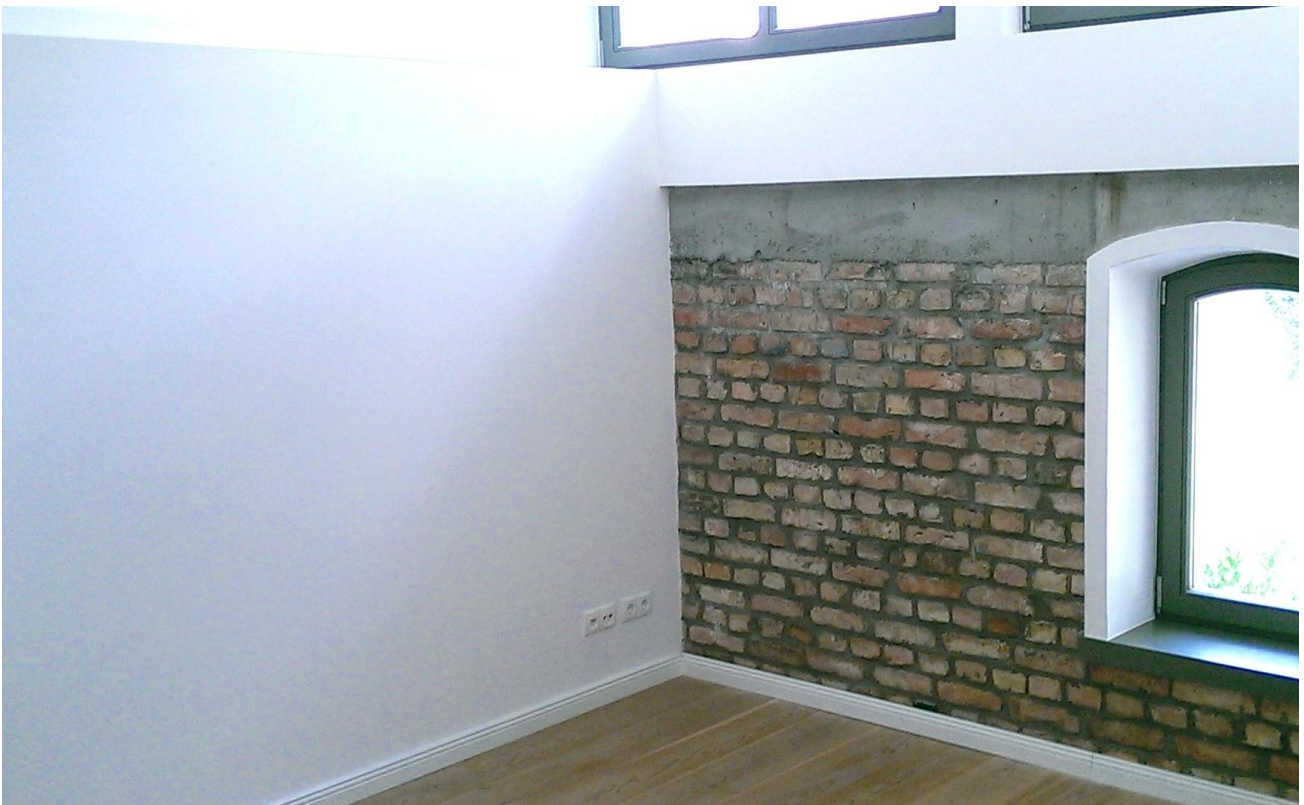
im 1. OG