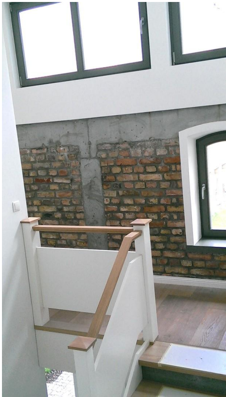
Treppe vom Flur im 1. OG aus