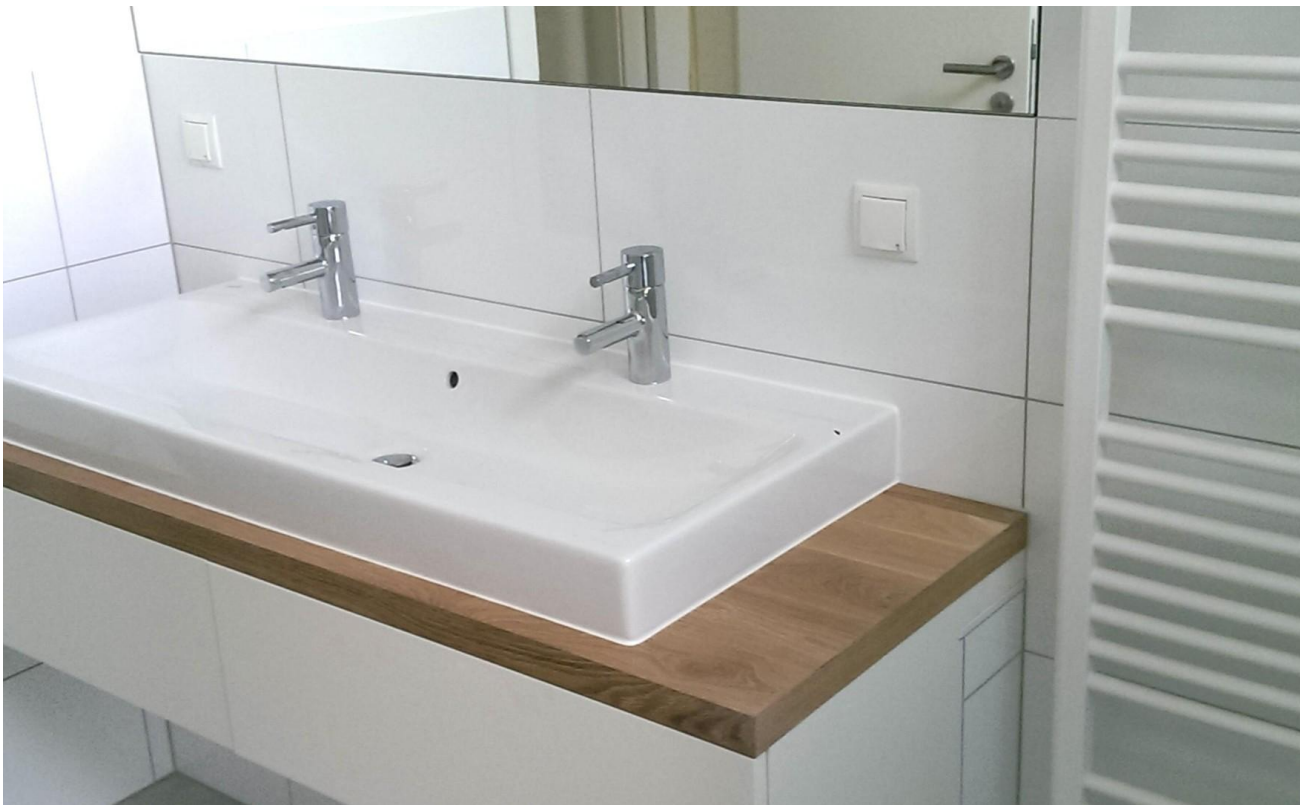
Teil vom Bad 1. OG