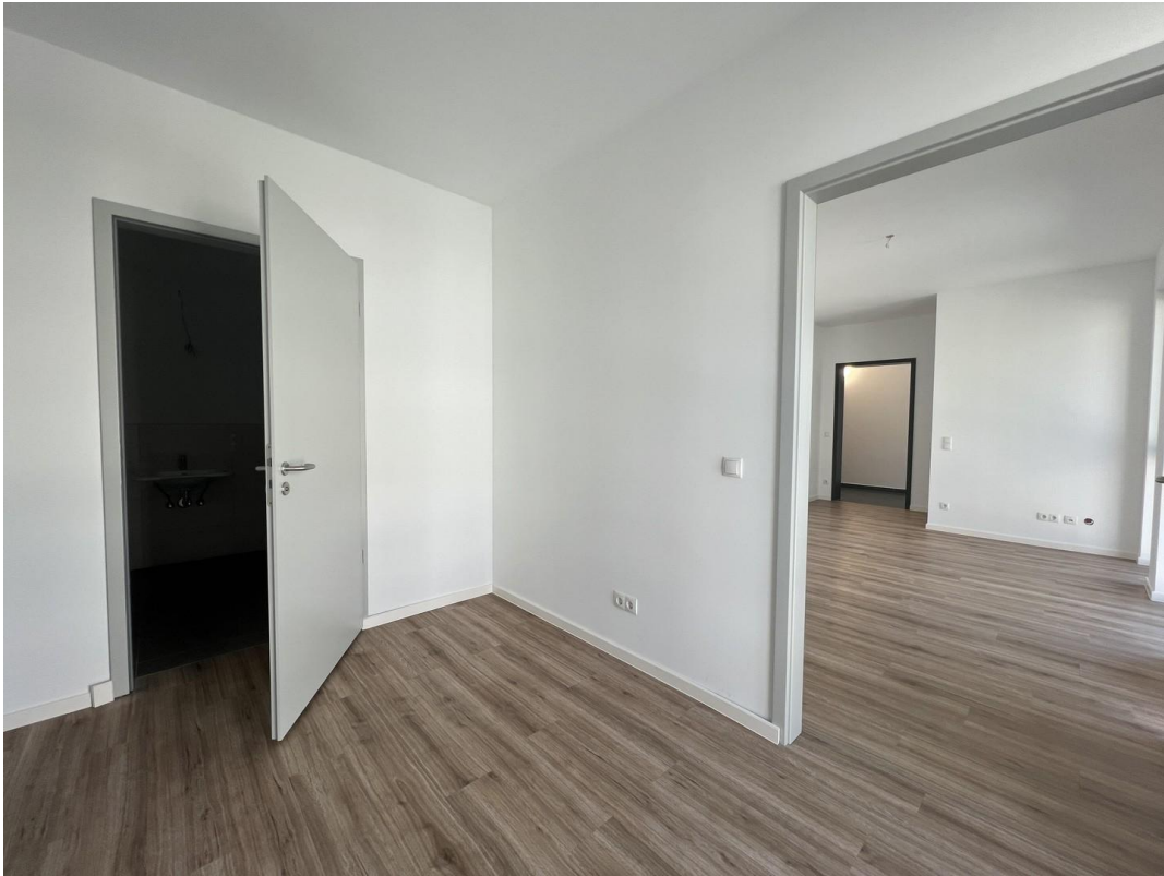
Bad & Schlafzimmer