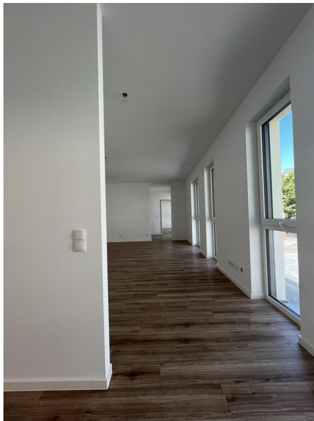
Blick vom Eingangsbereich