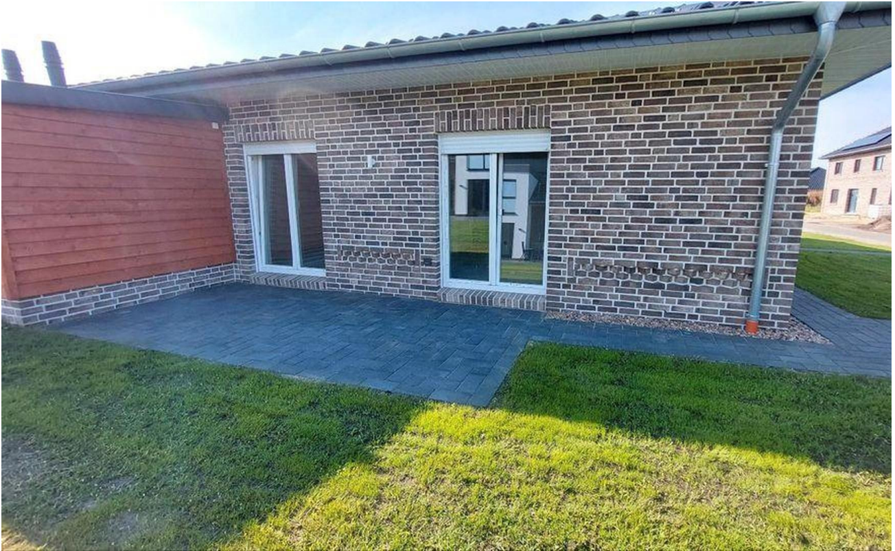
Terrasse aus den Schlafzimmern