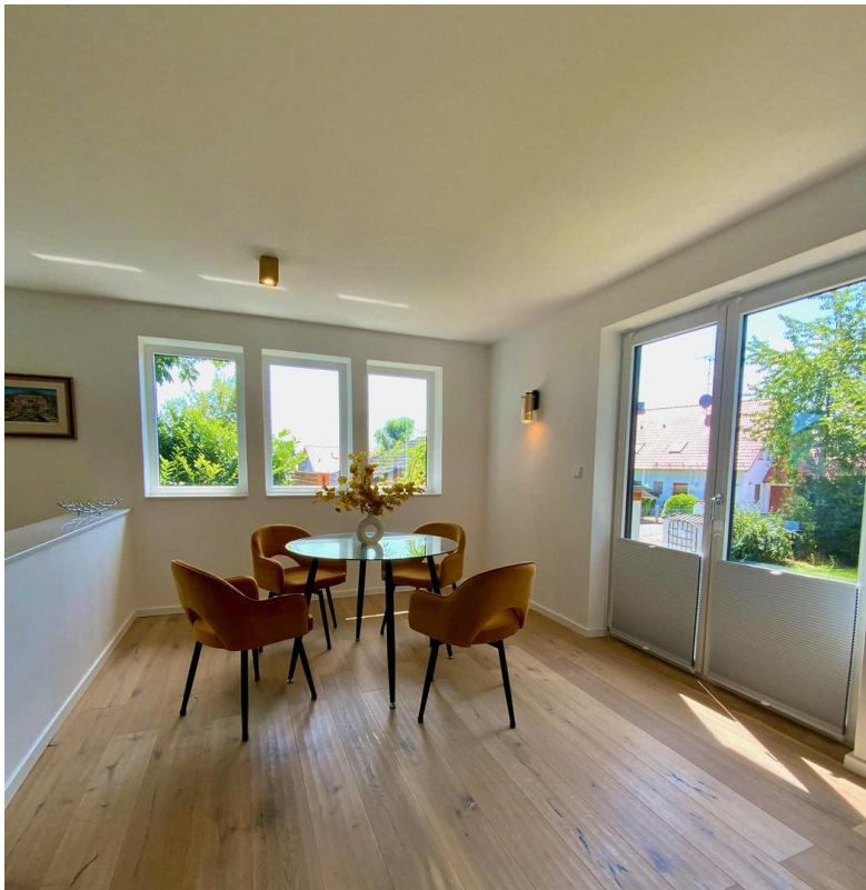
Rundum-Blick vom Essbereich