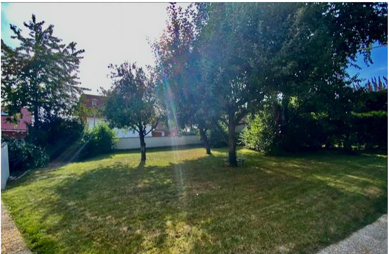
Platz für Entfaltung