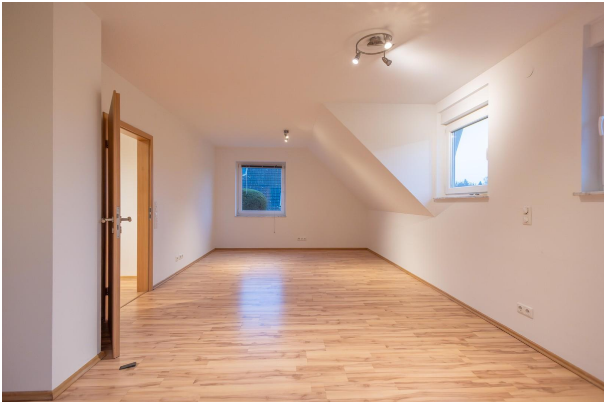
Schlafzimmer 2 OG