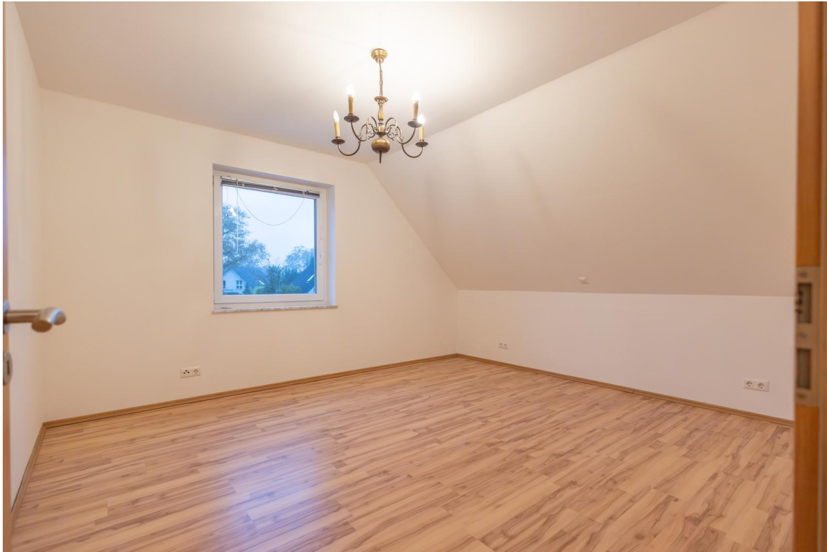
Schlafzimmer 1 OG