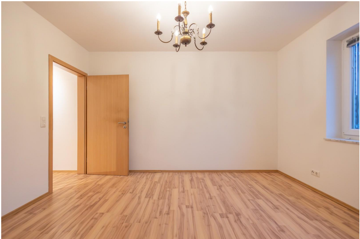
Schlafzimmer 1 OG