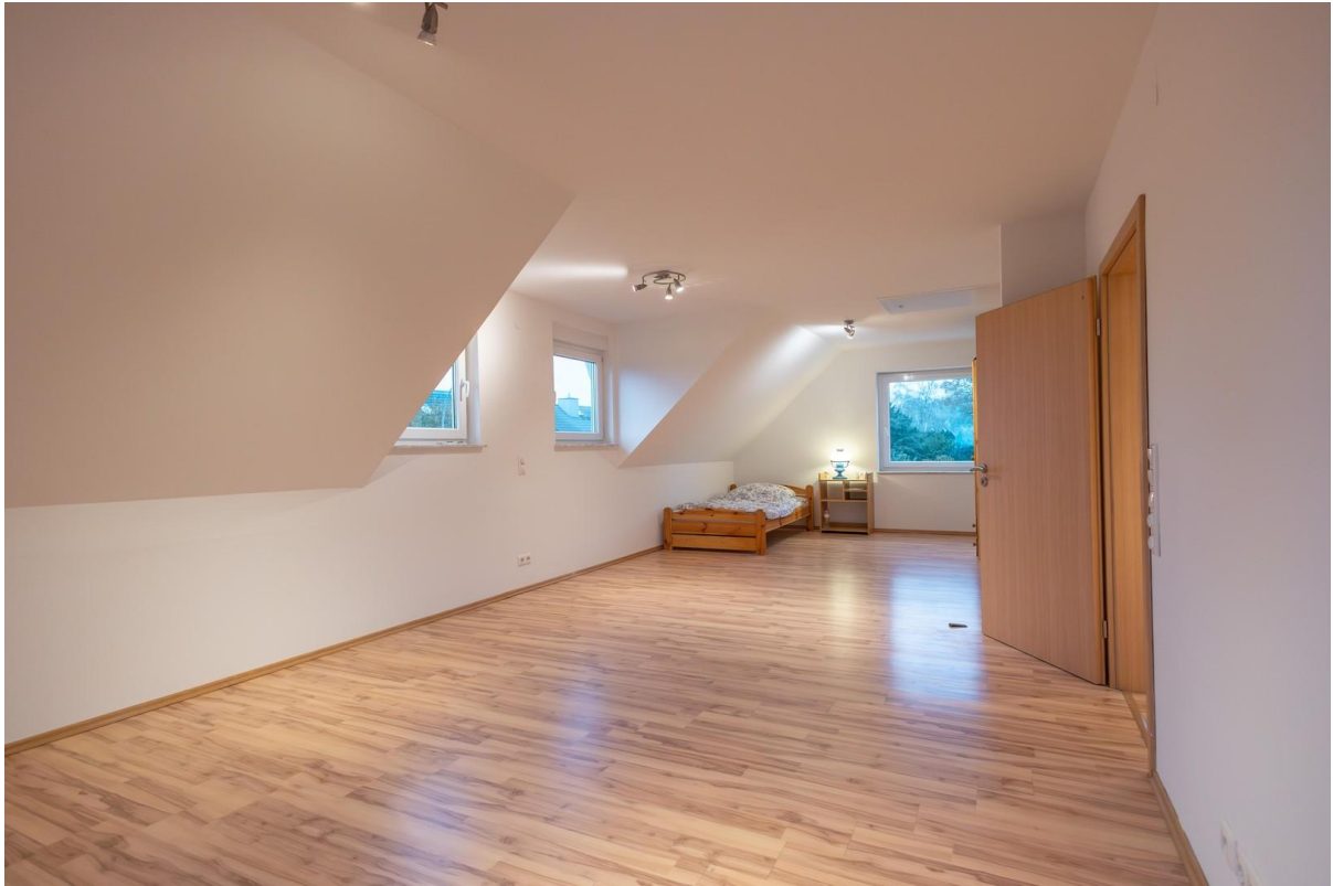
Schlazimmer 2 OG