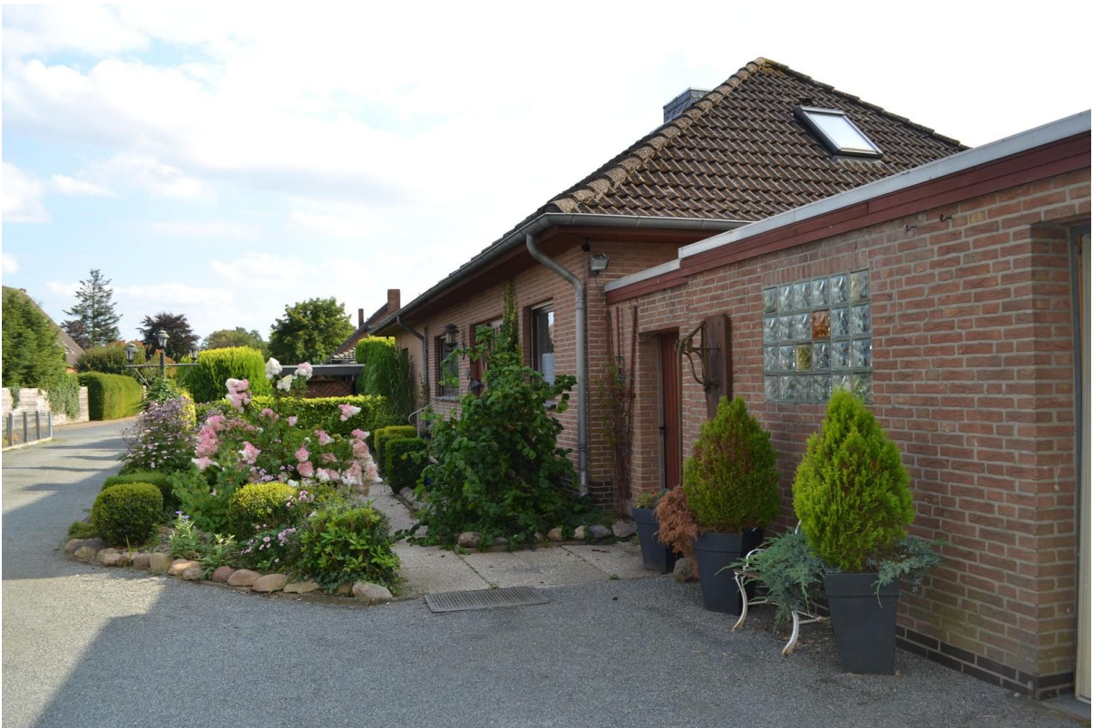
Blick aus Garagenbereich