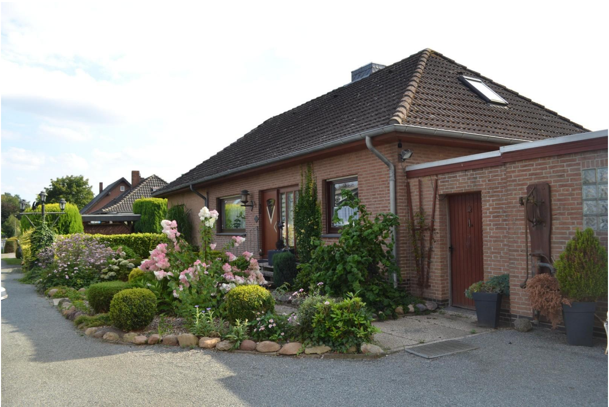
Blick aus Garagenbereich