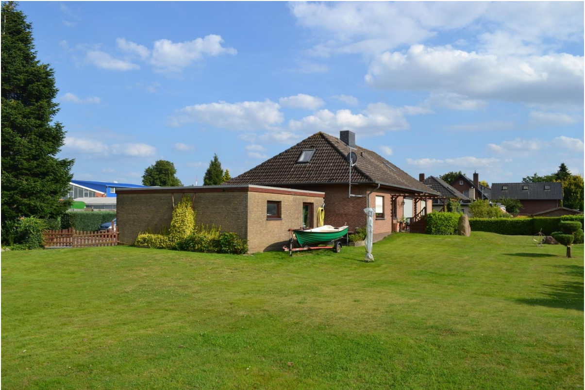
Blickrichtung hinter dem Haus