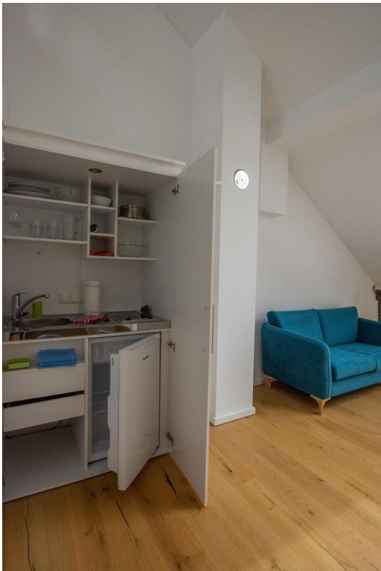
Wohnzimmer mit Küchenzeile