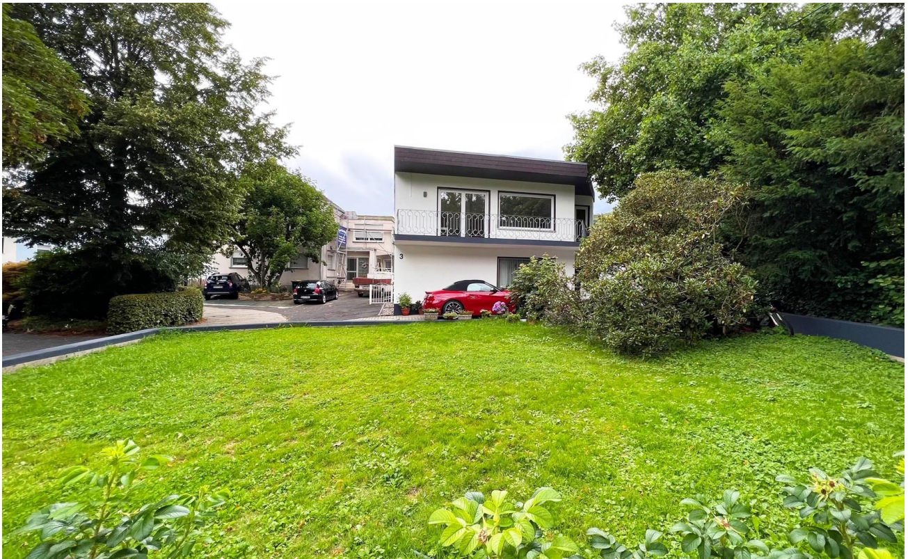
Haus- und Grundstücksansicht