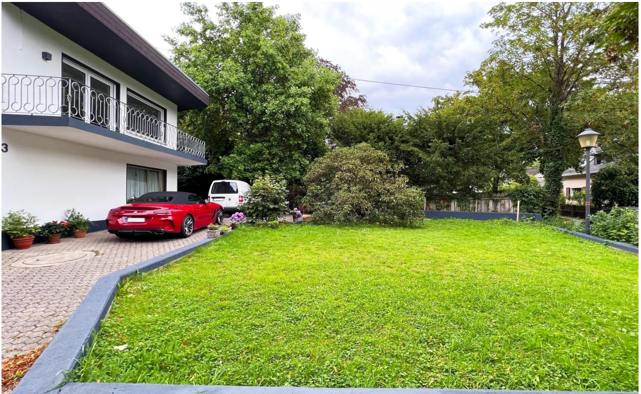
Haus- und Grundstücksansicht