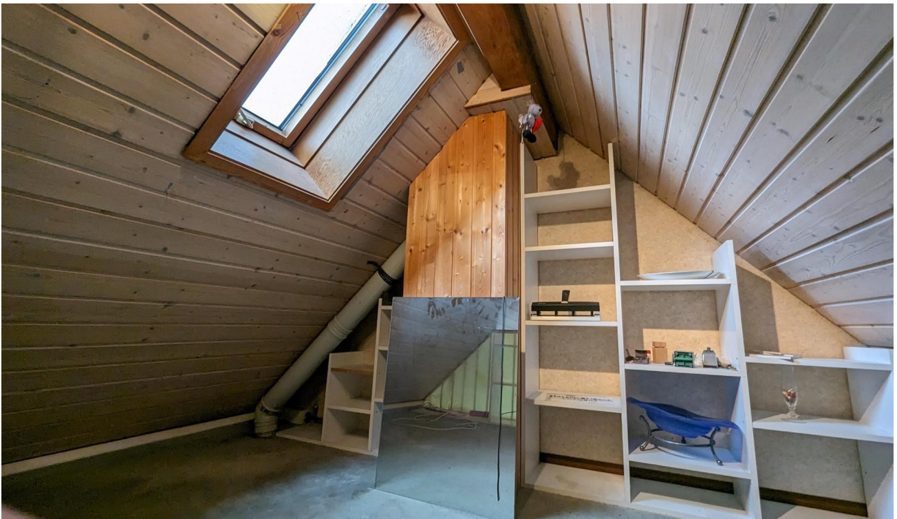
Lagermöglichkeit im Dach