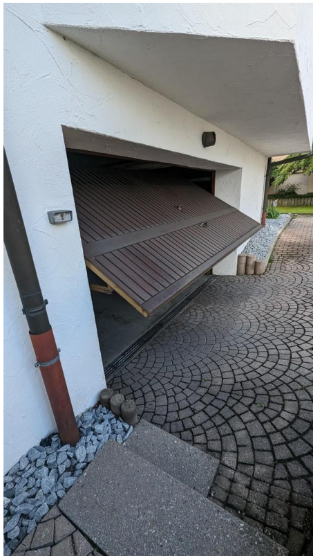
Garage el. Tor