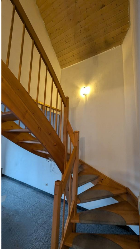
Treppe nach oben