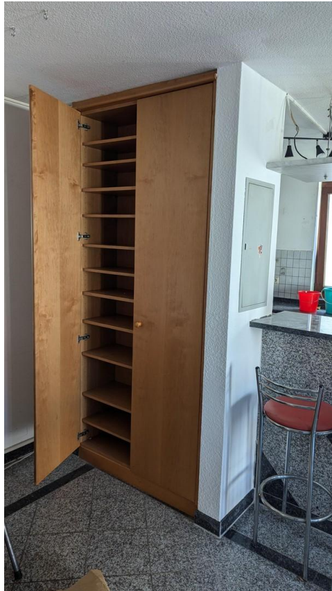
Wandschrank bei Küche