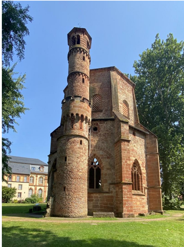
In nächster Umgebung