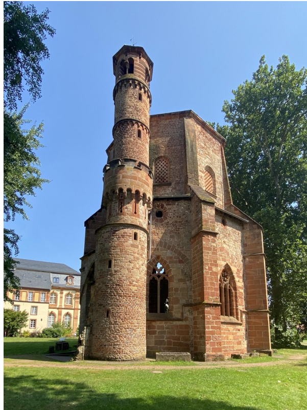
In nächster Umgebung