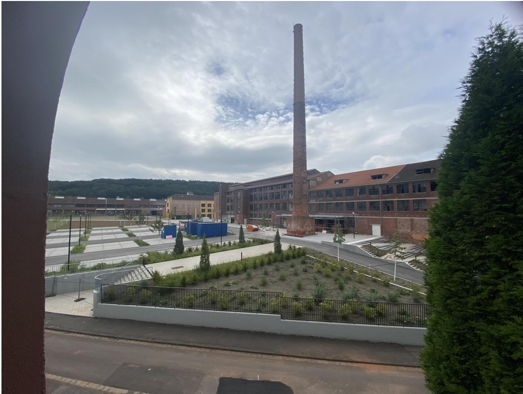
Blick vom Fenster Vorderseite