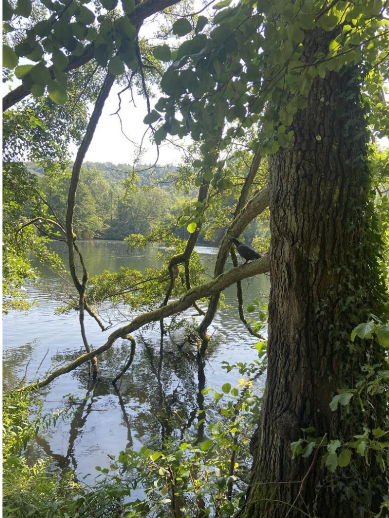
Erholung in der Nähe