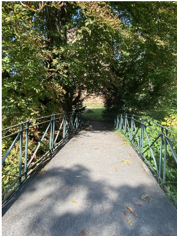
Parkanlage 3 Minuten entfernt