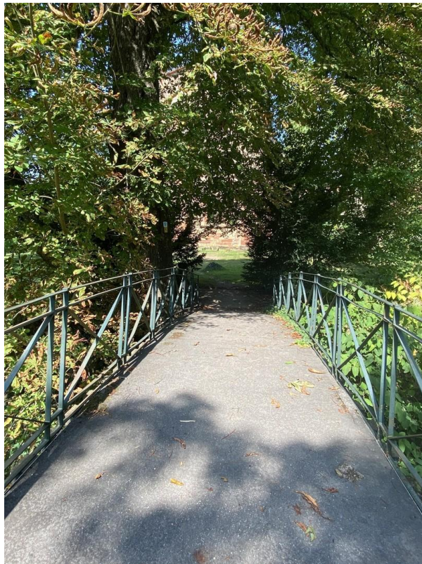
Parkanlage 3 Minuten entfernt