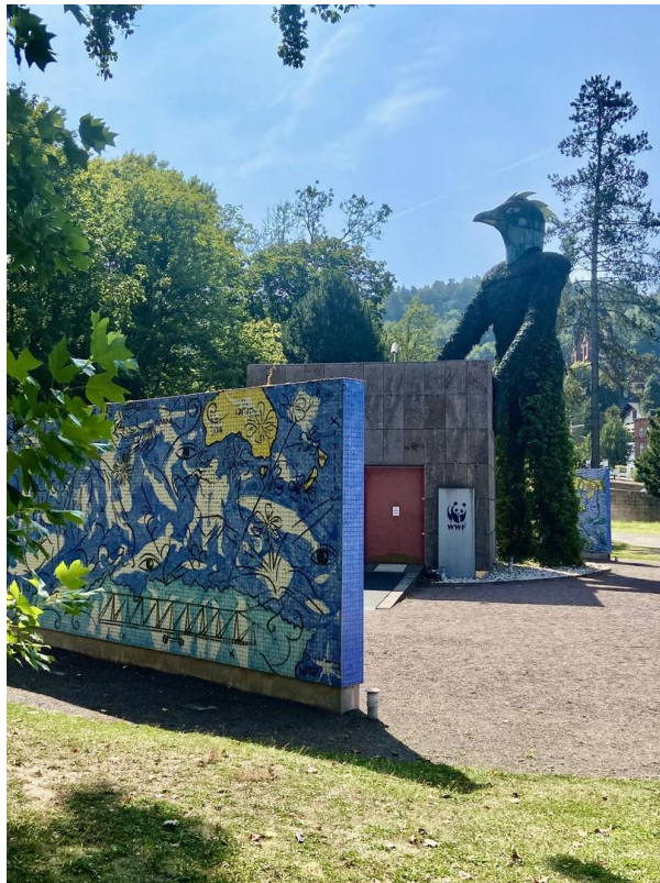
Erdgeist im Park um die Ecke