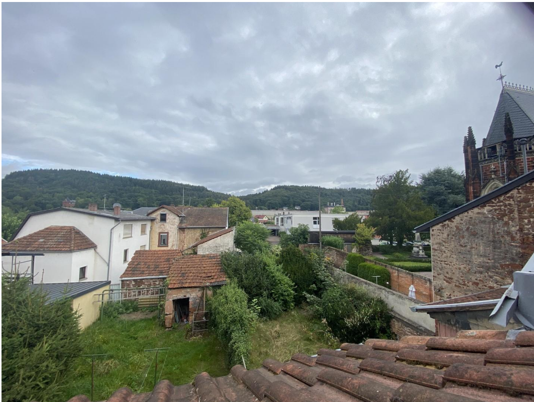
Blick vom Fenster Hinterseite