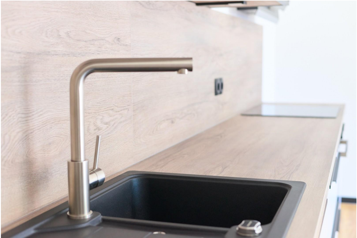
Moderne und hochwertige Armatur