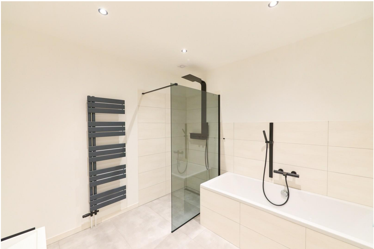
Badezimmer mit Walk-In Dusche