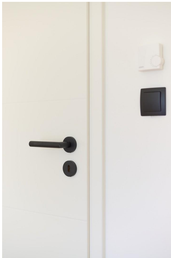
Mattschwarze Griffe und Schalt