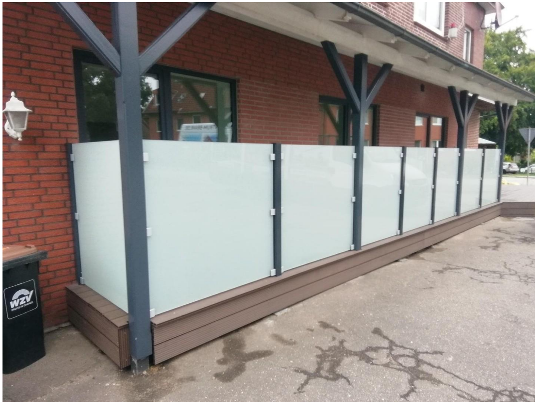
Außenbereich mit Terrasse