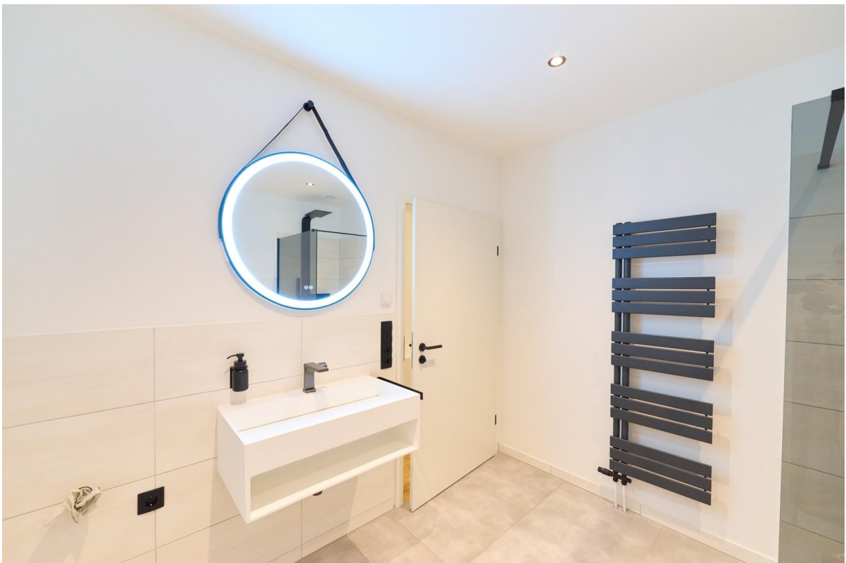
Voll ausgestattetes Bad