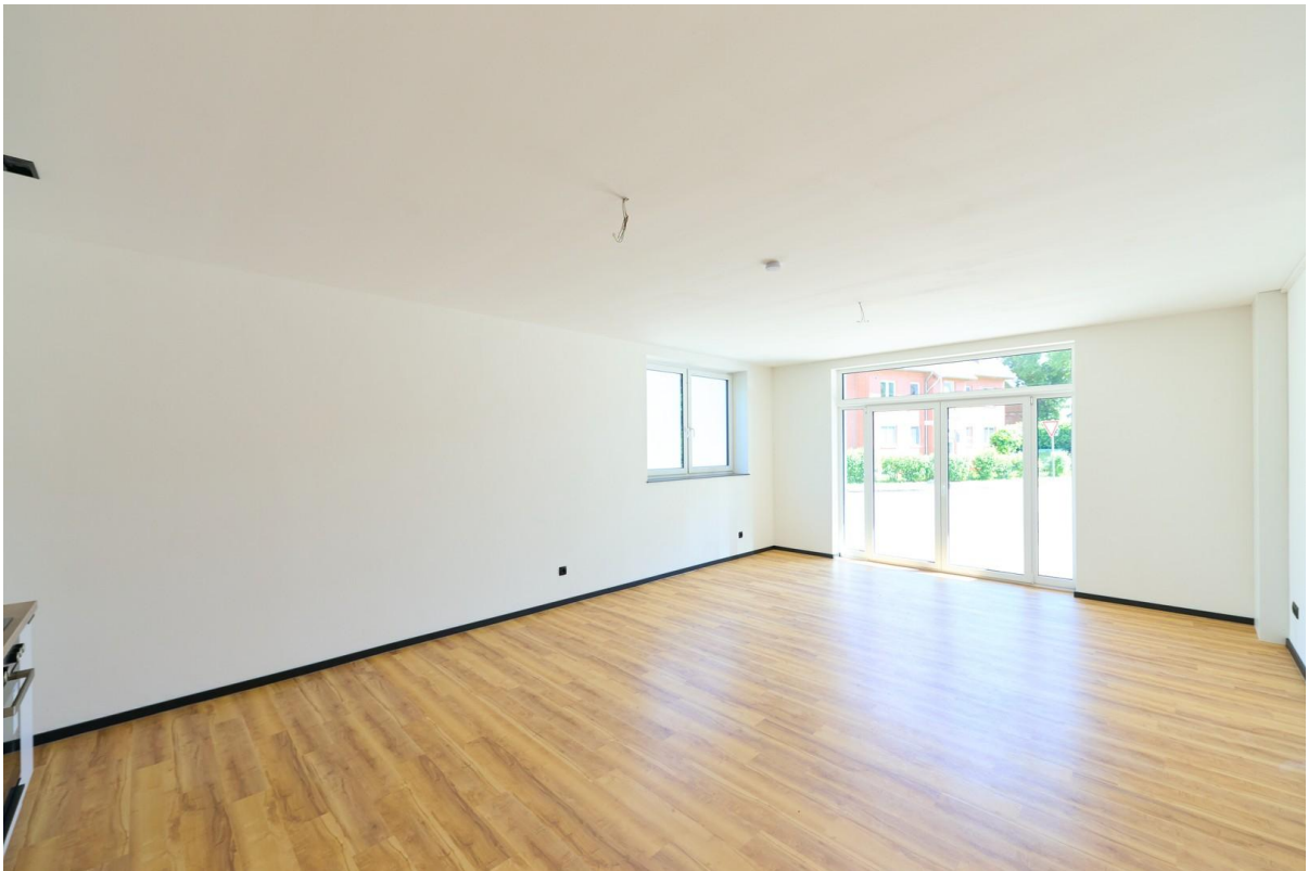
Wohnzimmer mit Terrassentür