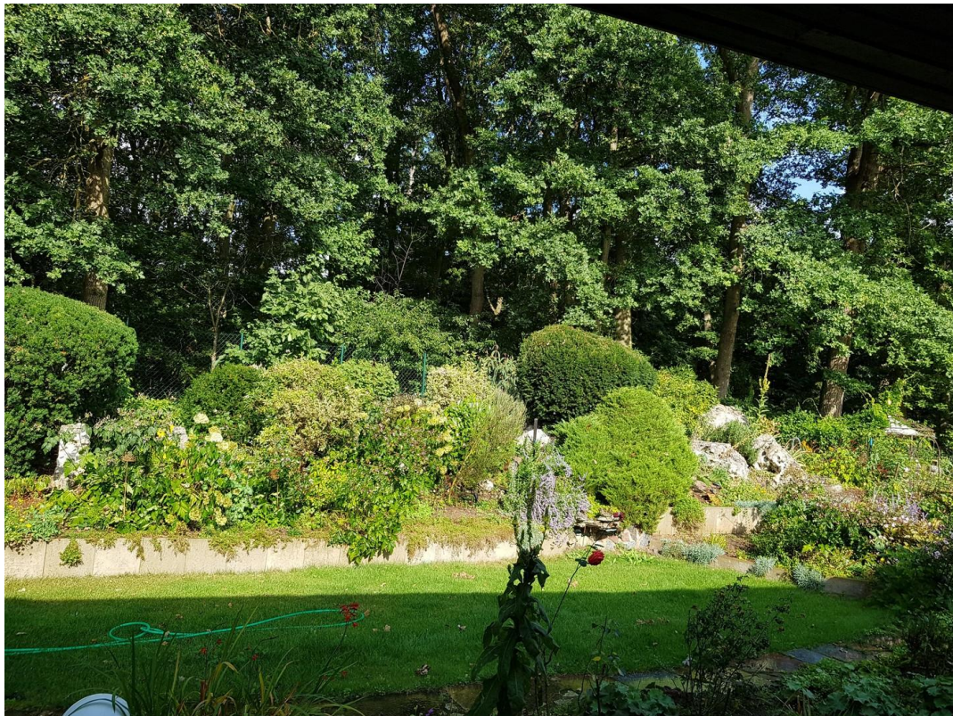
Garten zum Waldrand