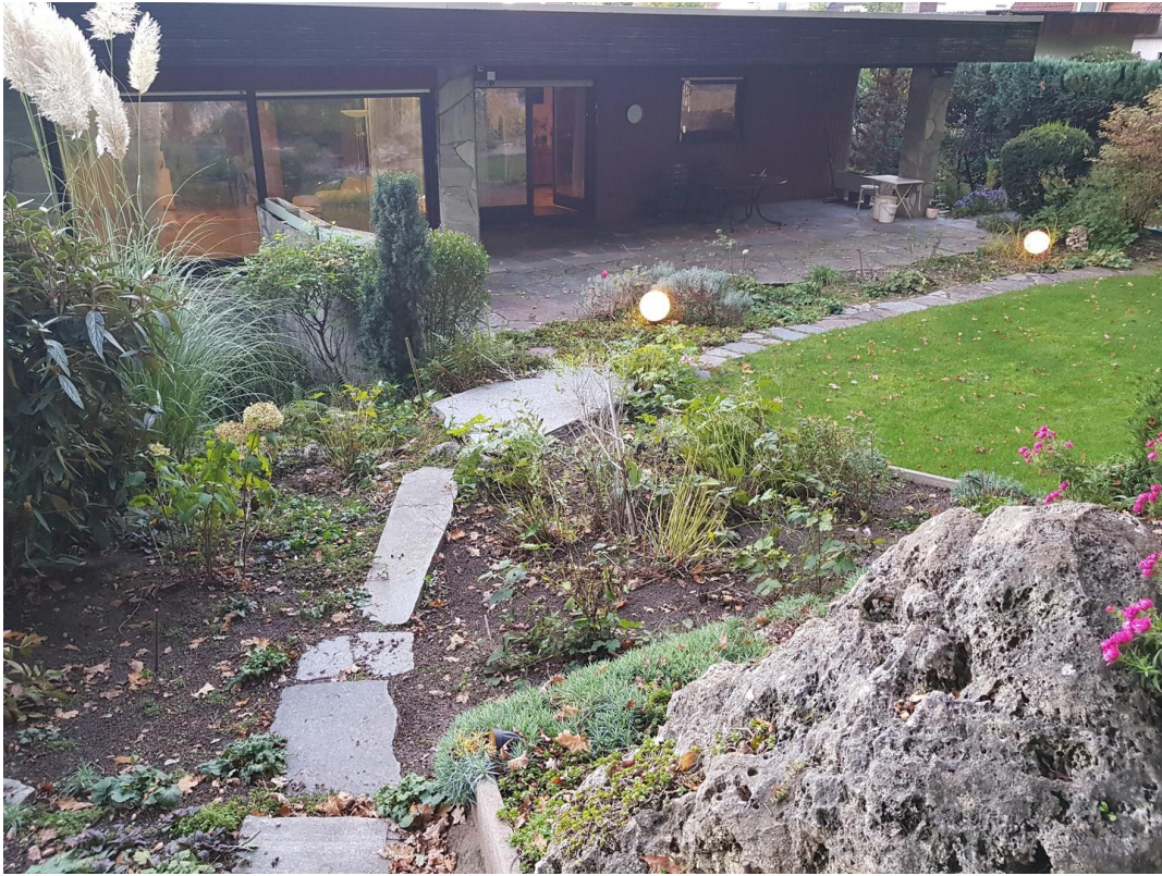
Garten / Terrasse