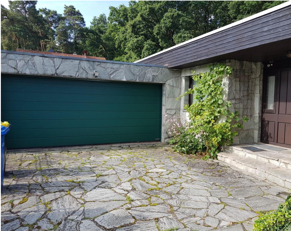
grosse Doppelgarage am Haus