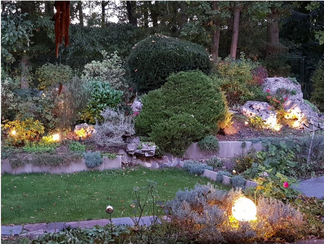
Gartenanlage mit Beleuchtung