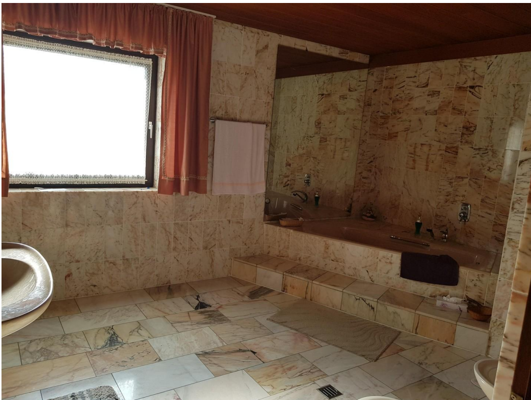
Hauptbad in Marmor