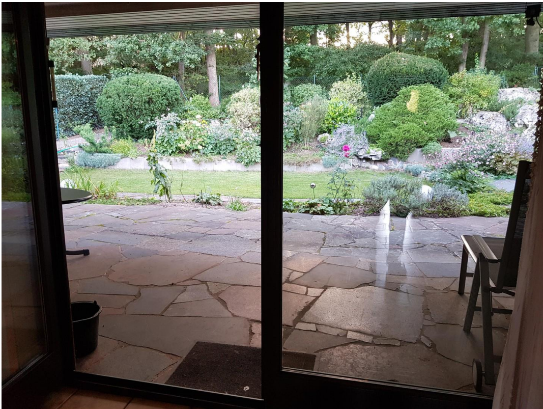
Gartenblick / Terrasse