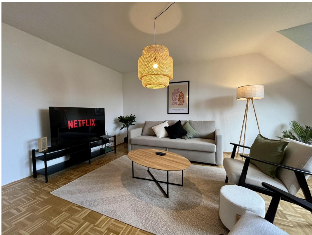
Wohnzimmer mit Smart-TV