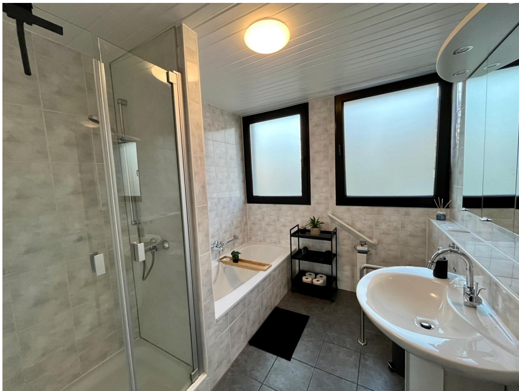
Modernes Bad mit Wanne+Dusche