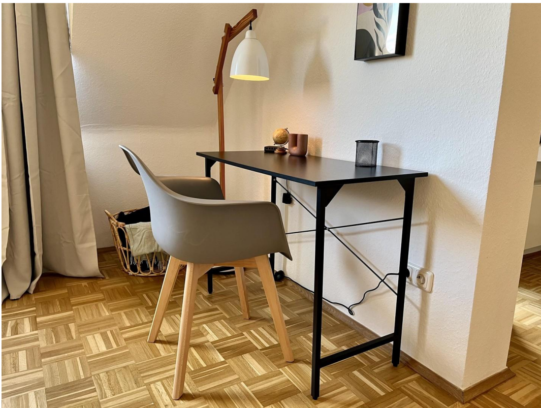
2 Arbeitsplätze vorhanden