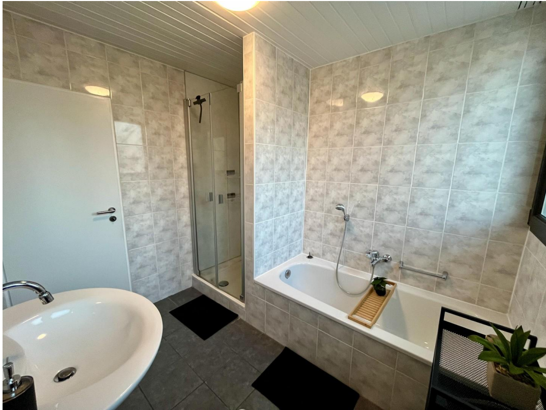
Modernes Bad mit Wanne+Dusche