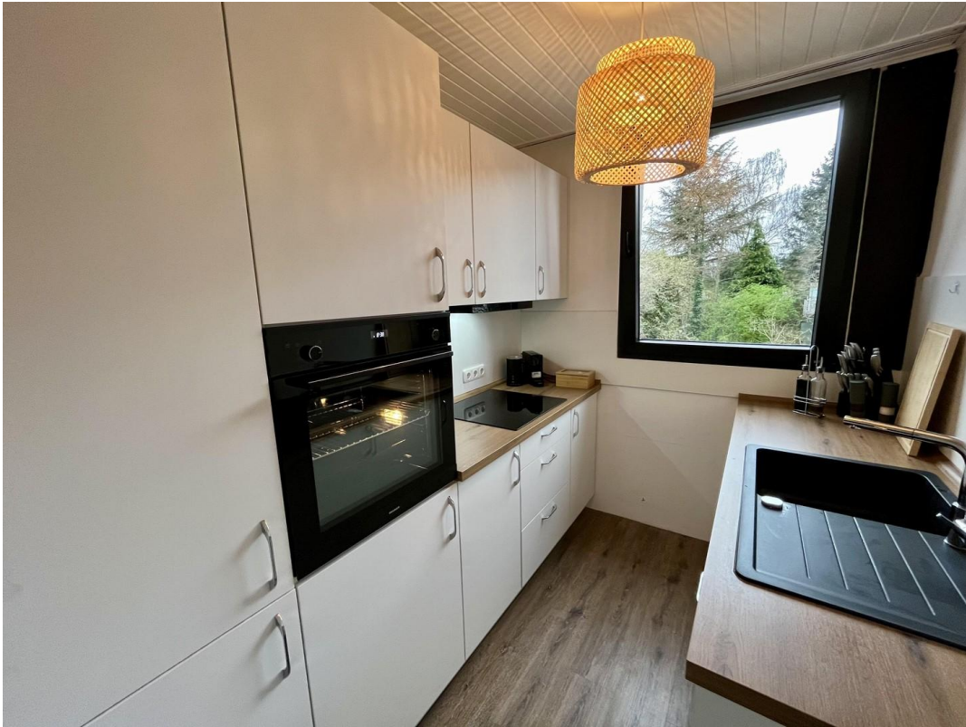
Küche, modern&voll ausgestattet