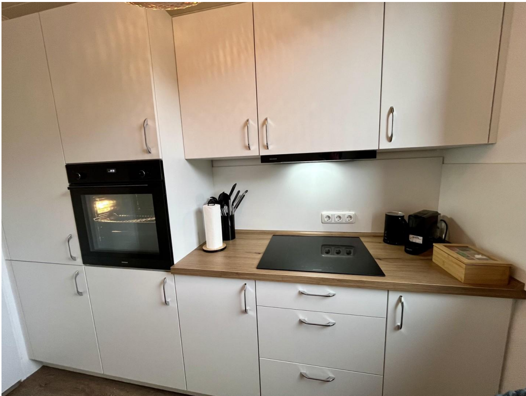
Küche, modern&voll ausgestattet