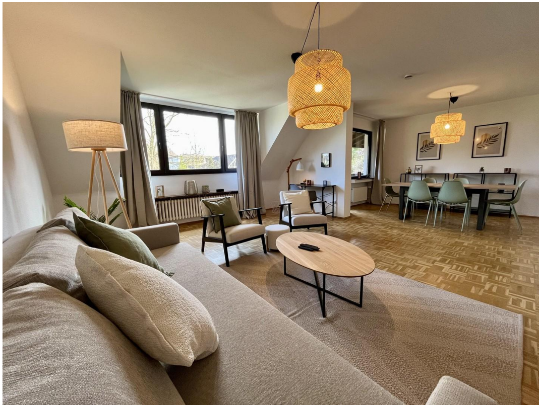
Wohnzimmer mit Zugang Balkon