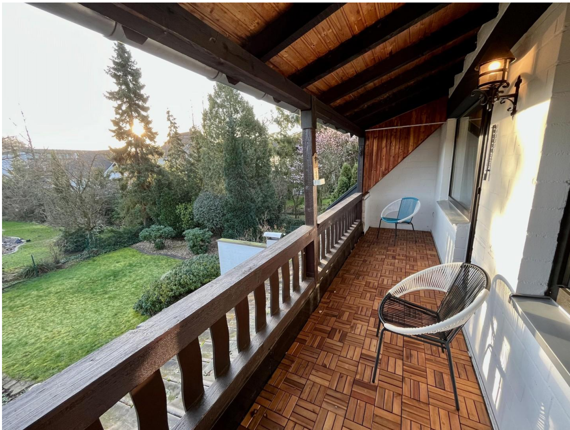
Balkon mit Gartenblick