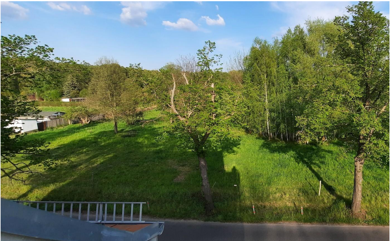
Blick Richtung Osten