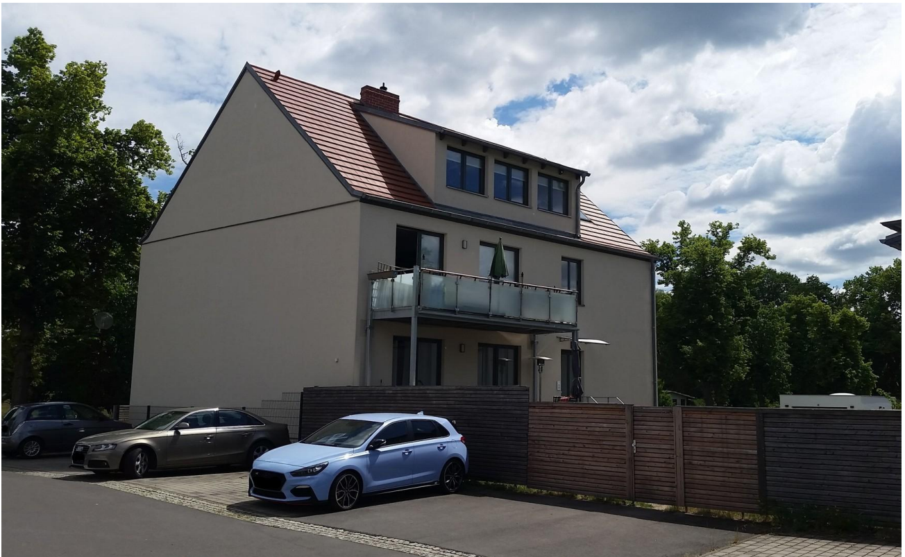
Nord-West Ansicht, Balkon WE4