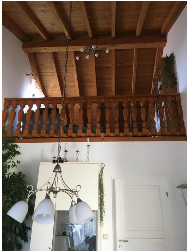
Blick Galerie vom Esszimmer