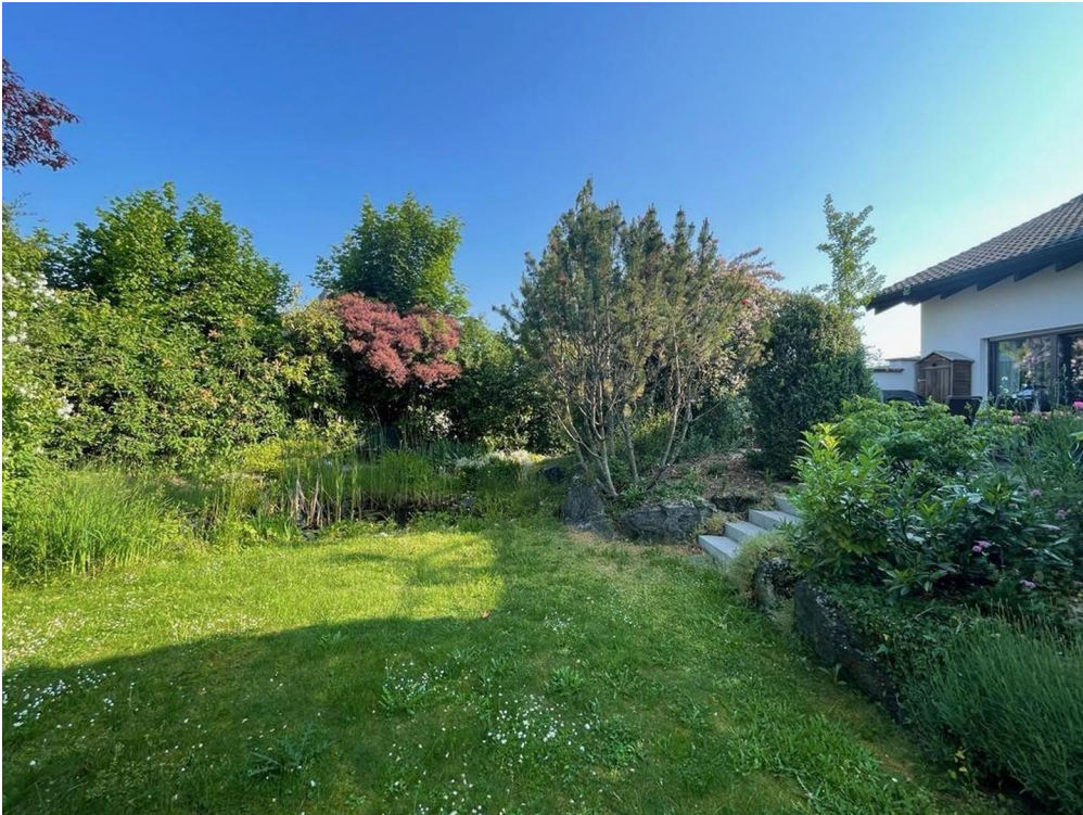
Garten mit Seerosenteich