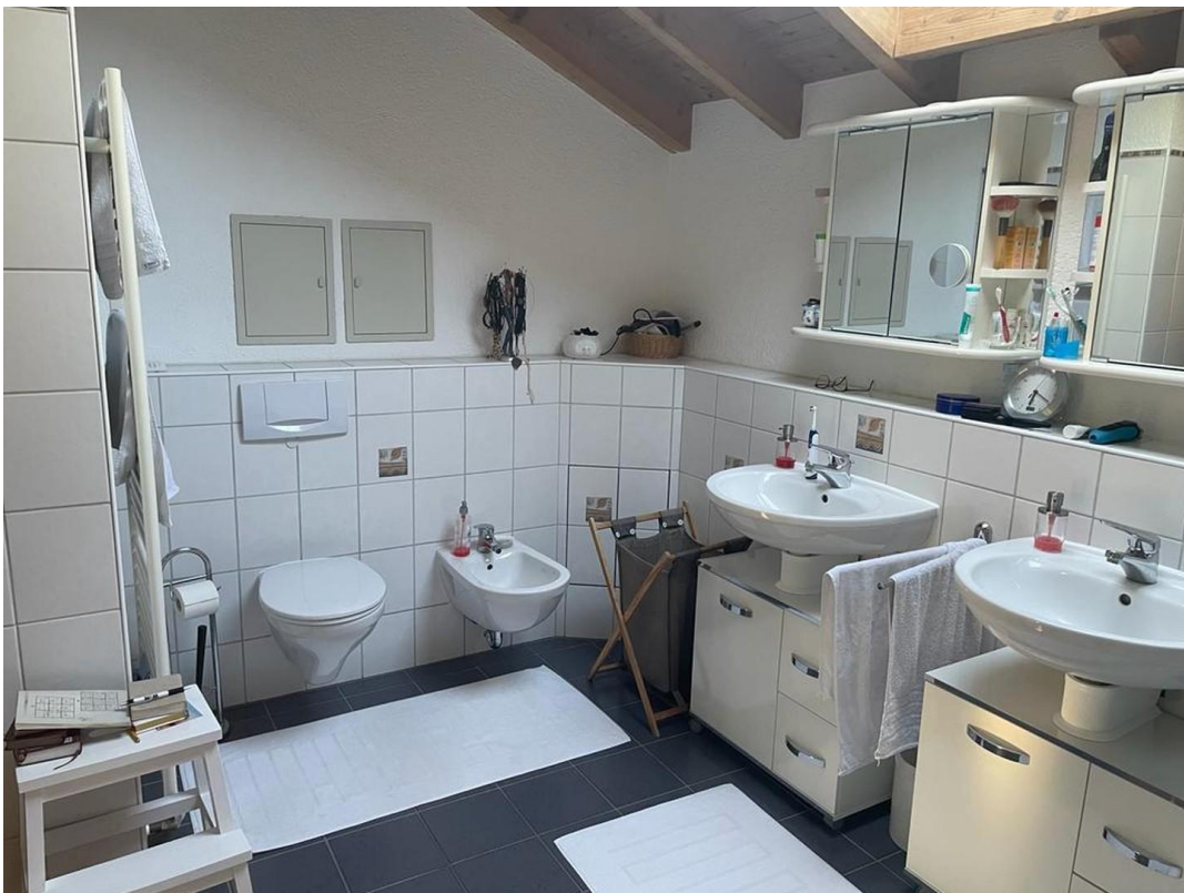
Tageslichtbad mit Bidet