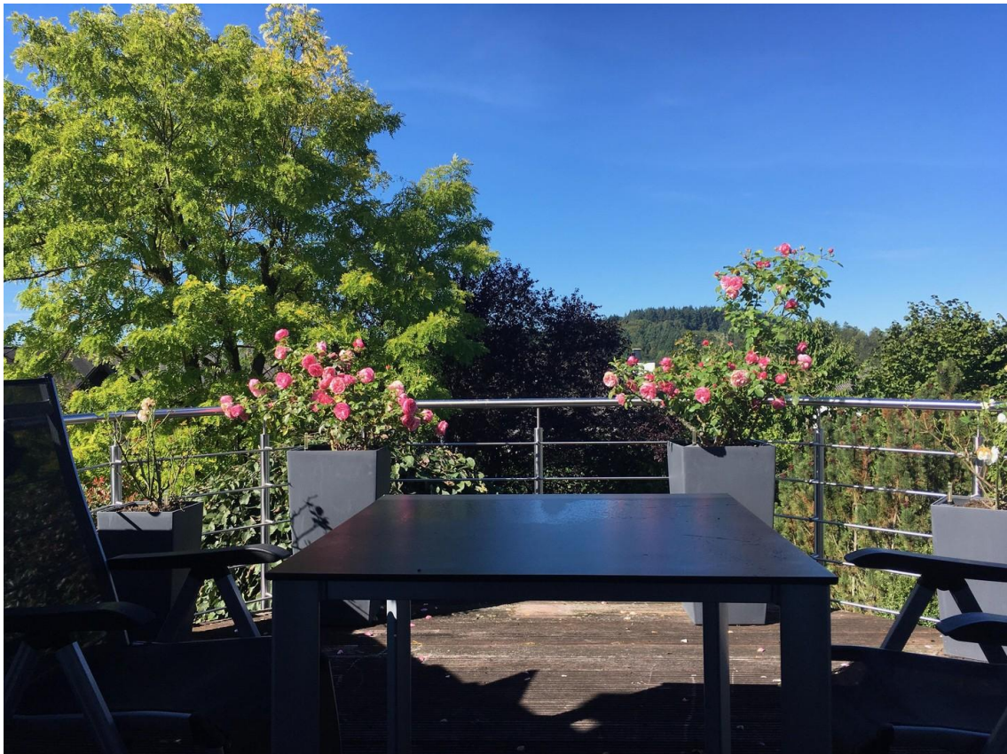
Dachterrasse nach Westen