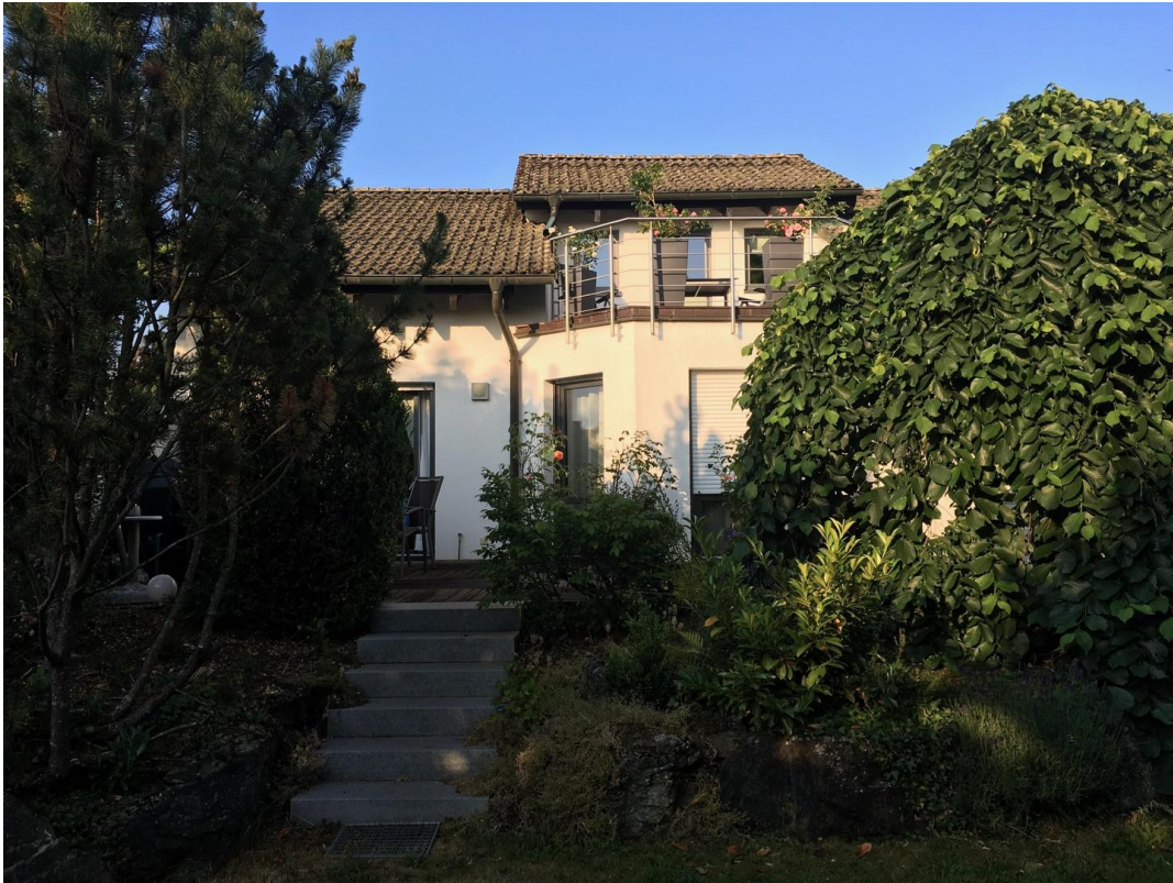
Westansicht aus dem Garten