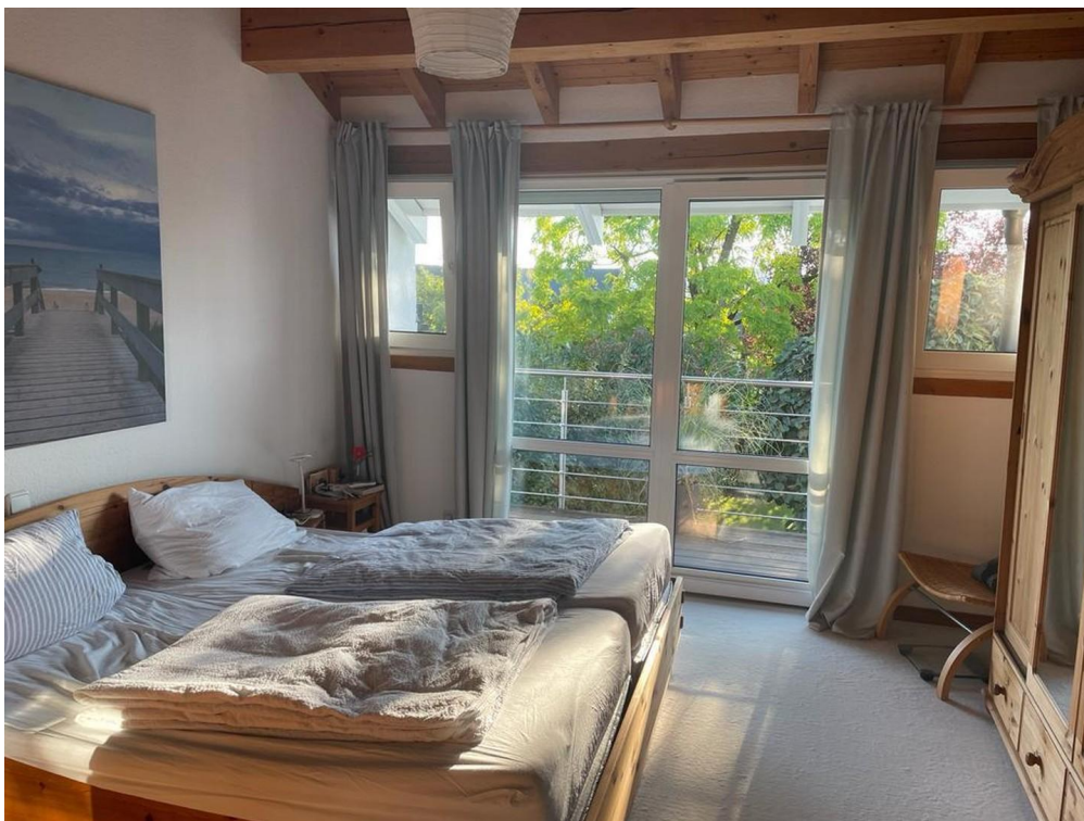
Schlafzimmer mit Gartenblick