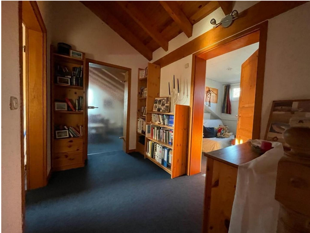
Flur oben zur Galerie & AZ