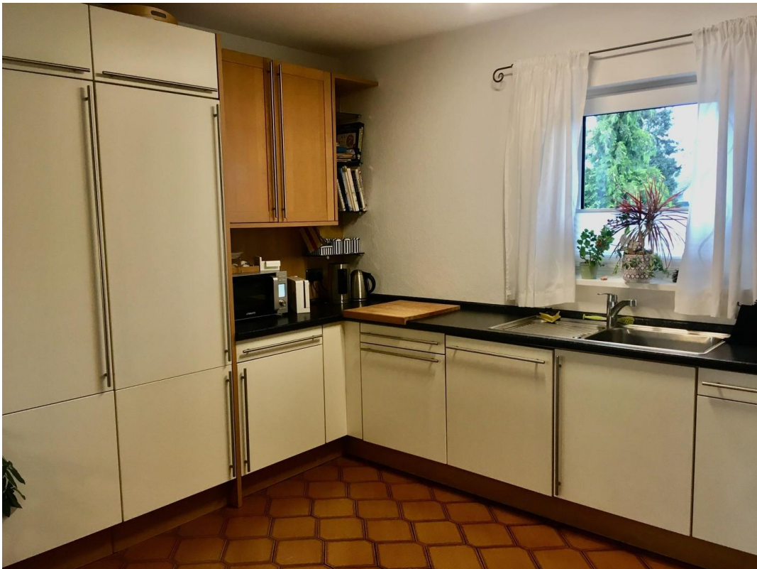
Einbauküche mit Ausblick