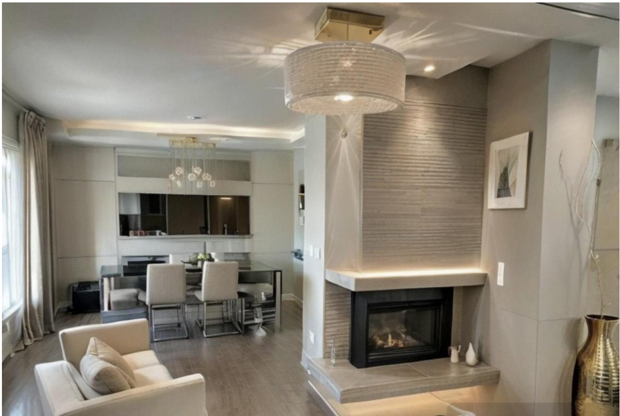
Wohn- / Essbereich