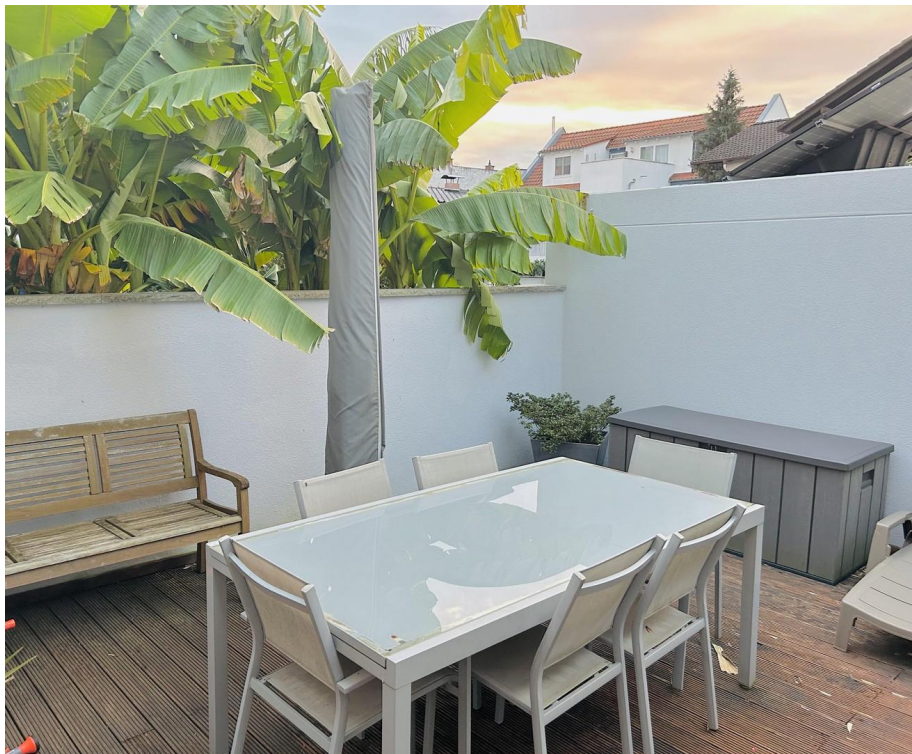
Terrasse / Garten