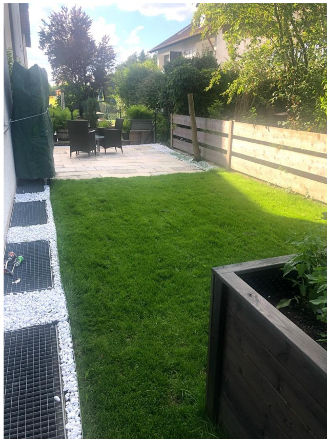
Eigener Garten mit Terrasse