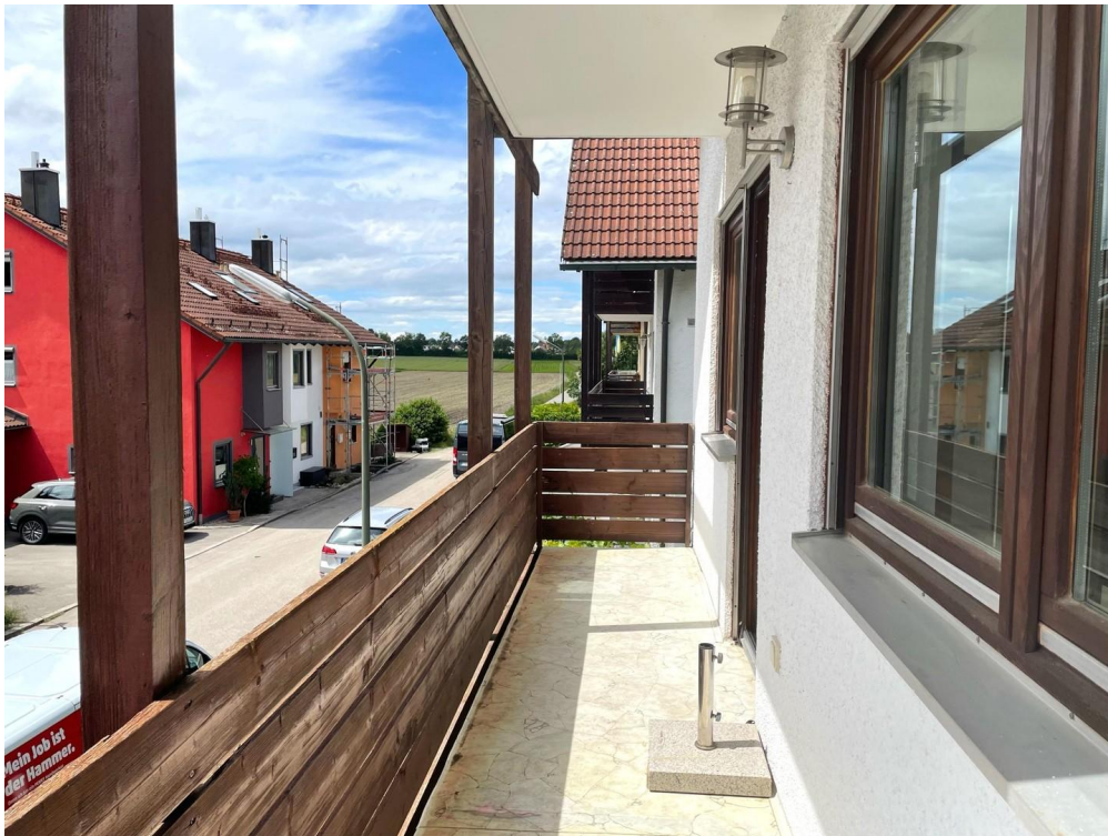
Balkon am Wohnzimmer