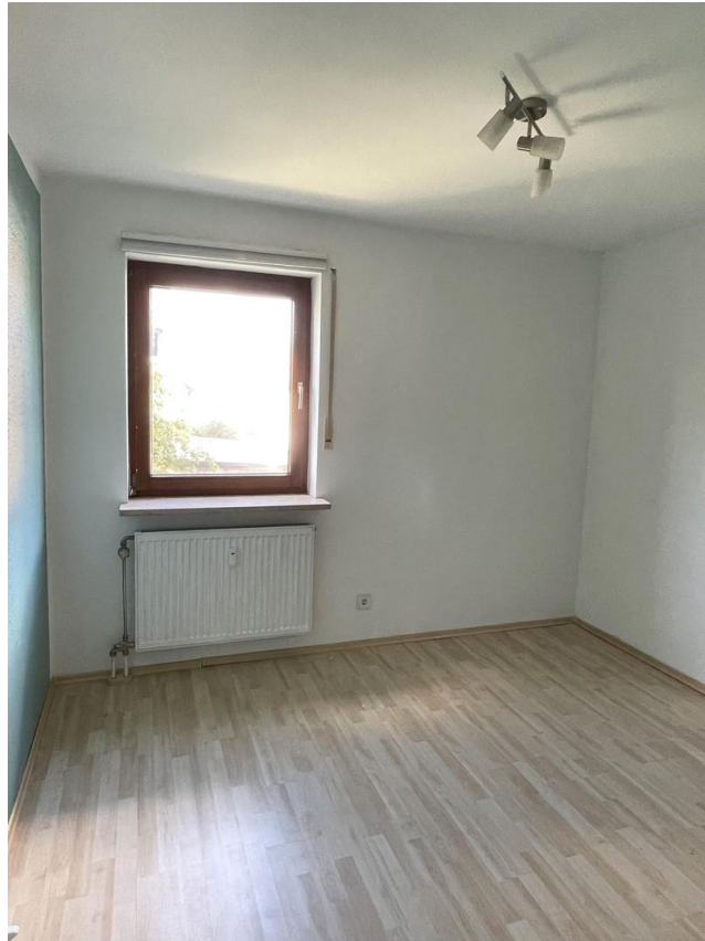
Büro / Kinderzimmer