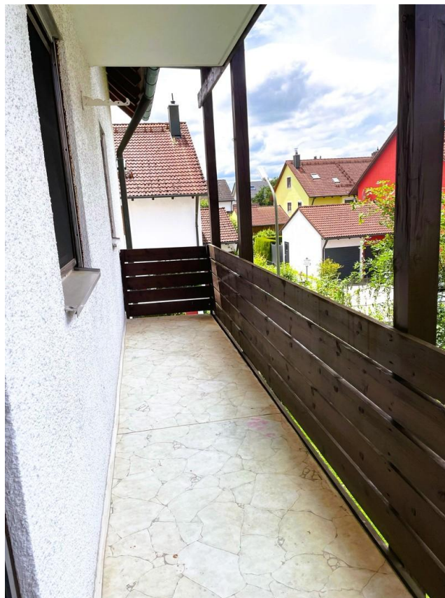
Balkon am Schlafzimmer