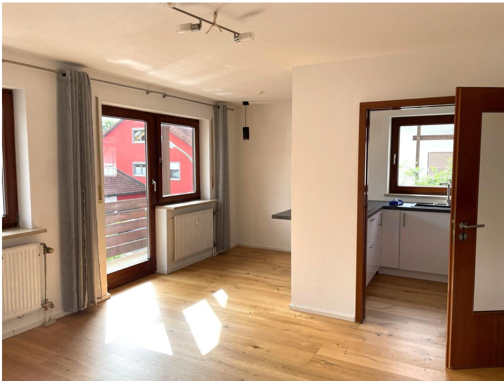
Wohnzimmer und Essbereich