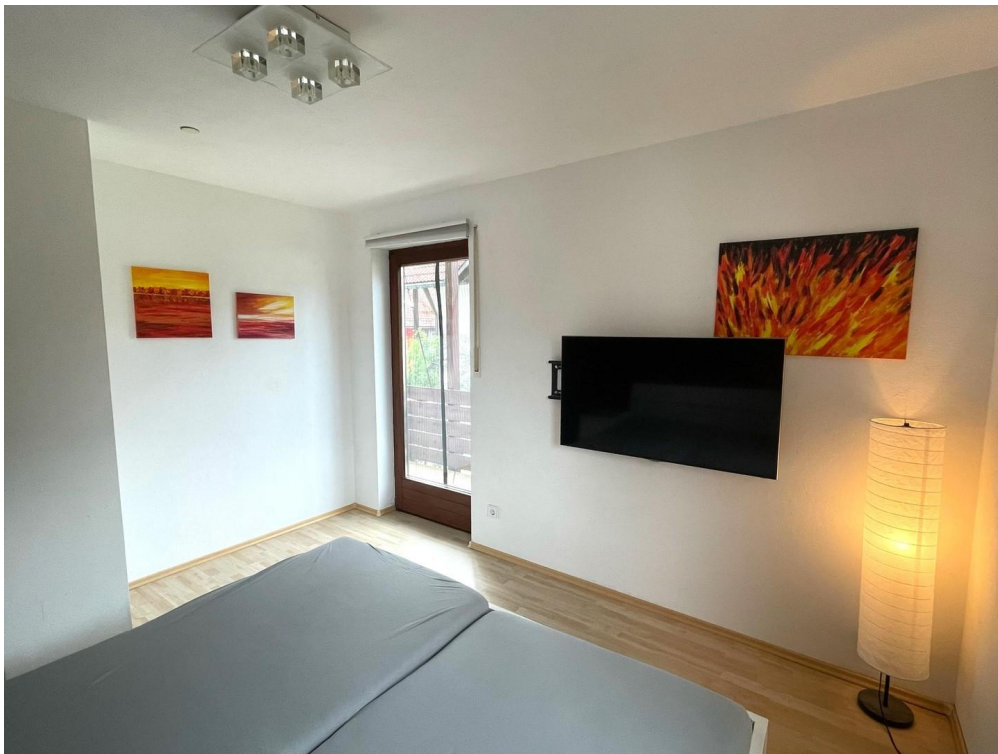
Schlafzimmer mit Balkon