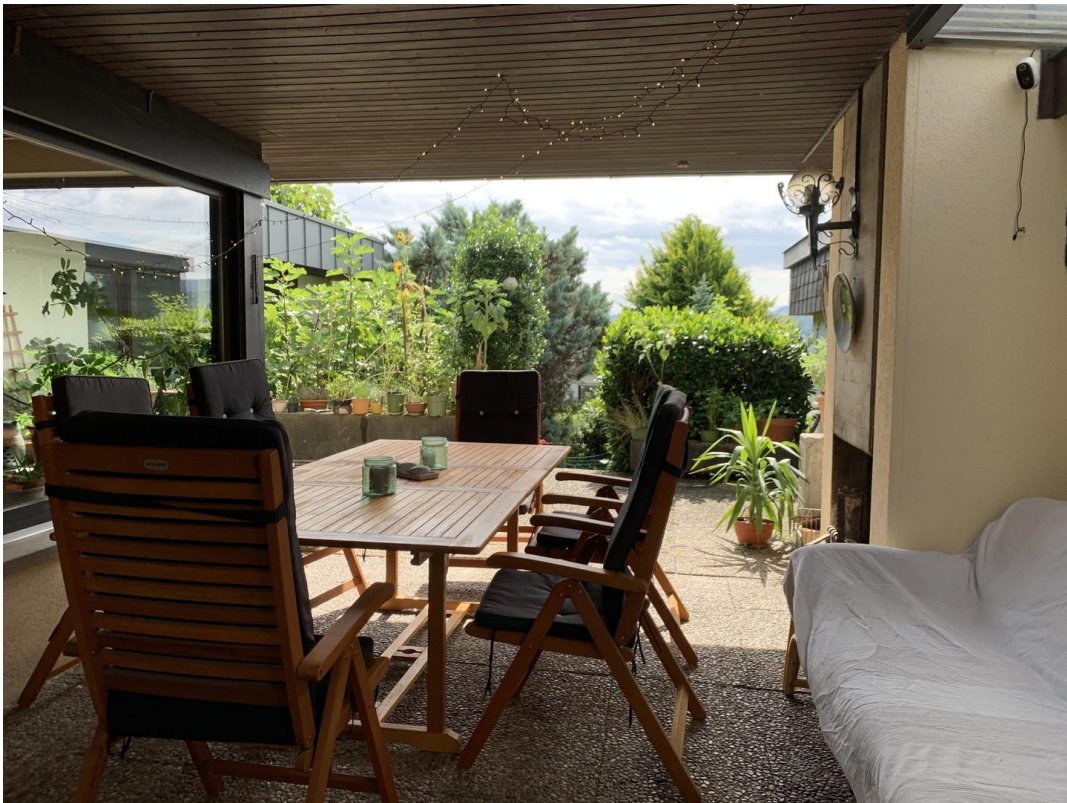
Überdachte Terrasse mit Kamin