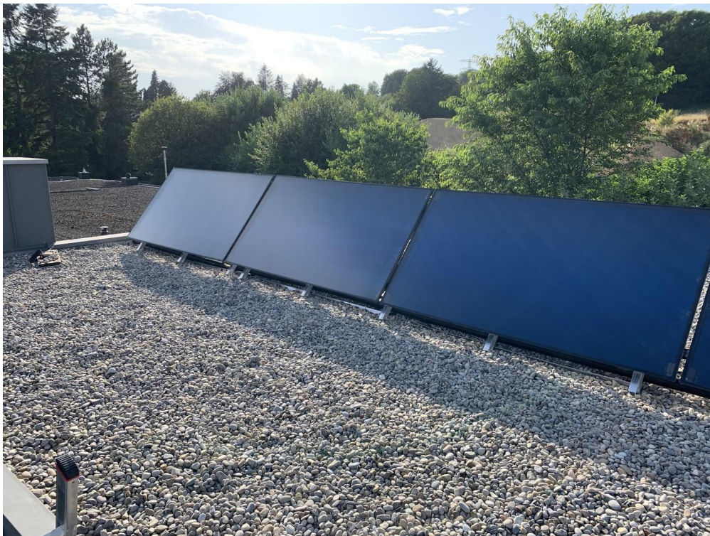
Solarthermie (neu 07.2023)