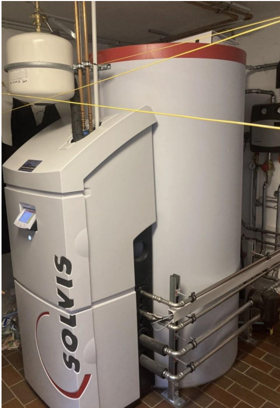
Heizung (neu 07.2023)