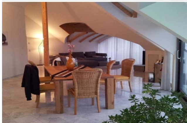
Wohn- u. Essbereich