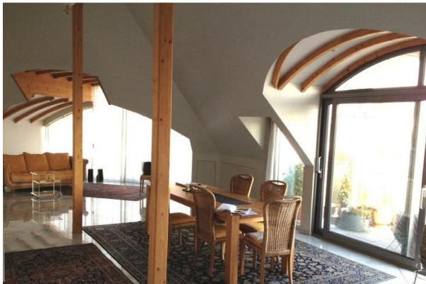
Wohn- u. Essbereich_2