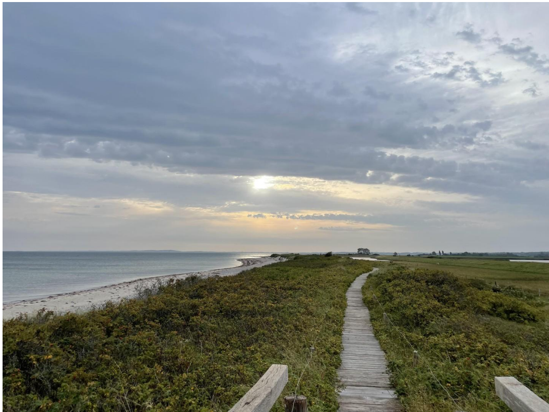
Strand bei Behrendorf