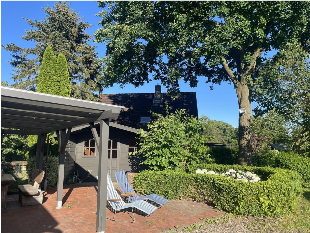
Draussen Grillen geht immer