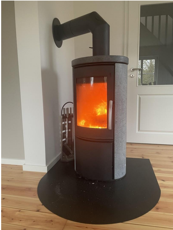
ruck zuck warm und gemütlich