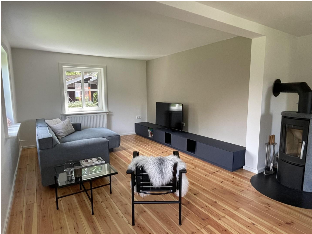
Wohnen mit Kamin