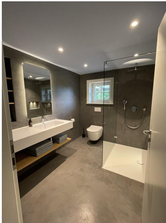
Bad EG mit Fussbodenheizung