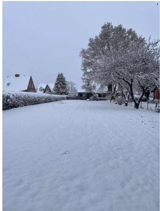
auch im Winter schön