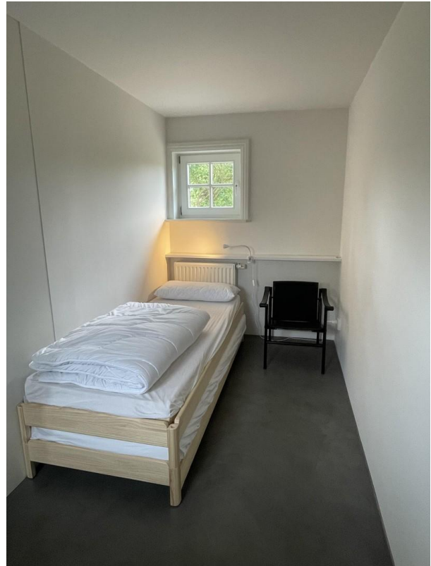
Schlafen unten (Gäste)