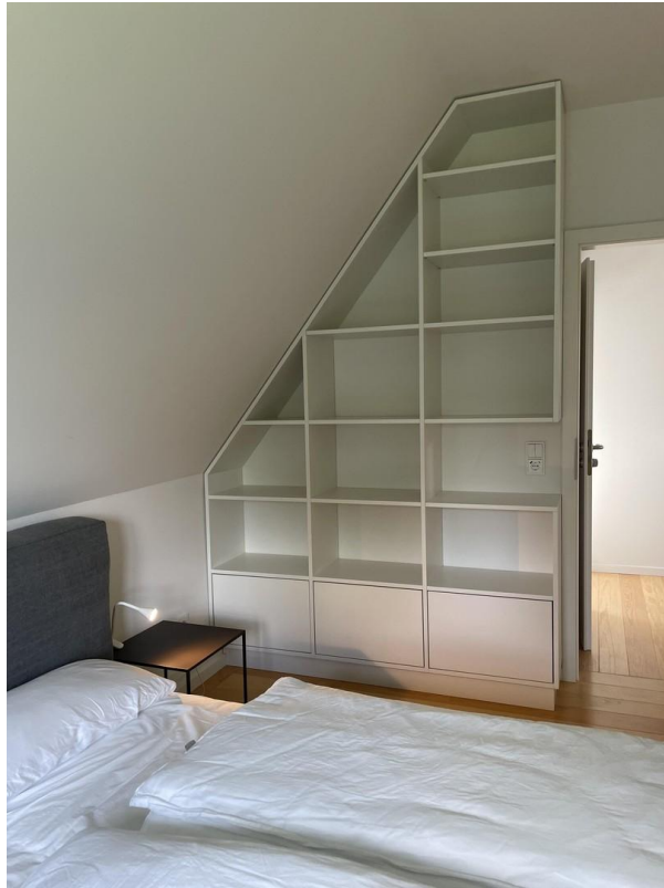
Einbauregale vom Tischler