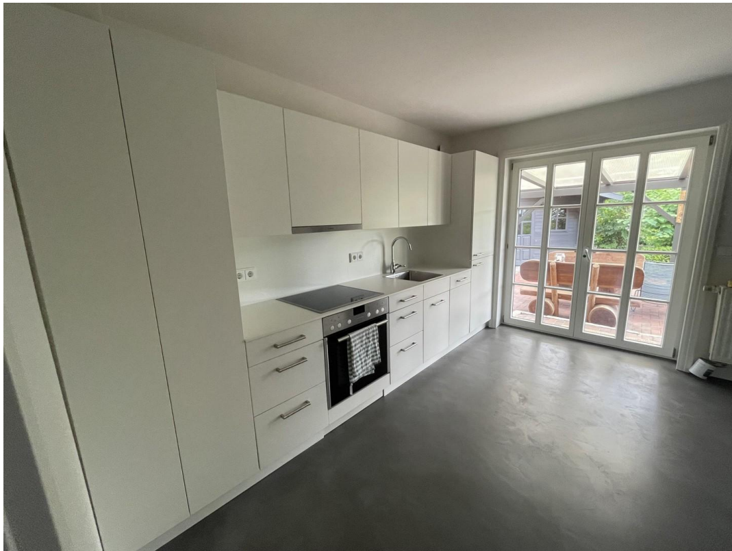
Küche voll ausgestattet