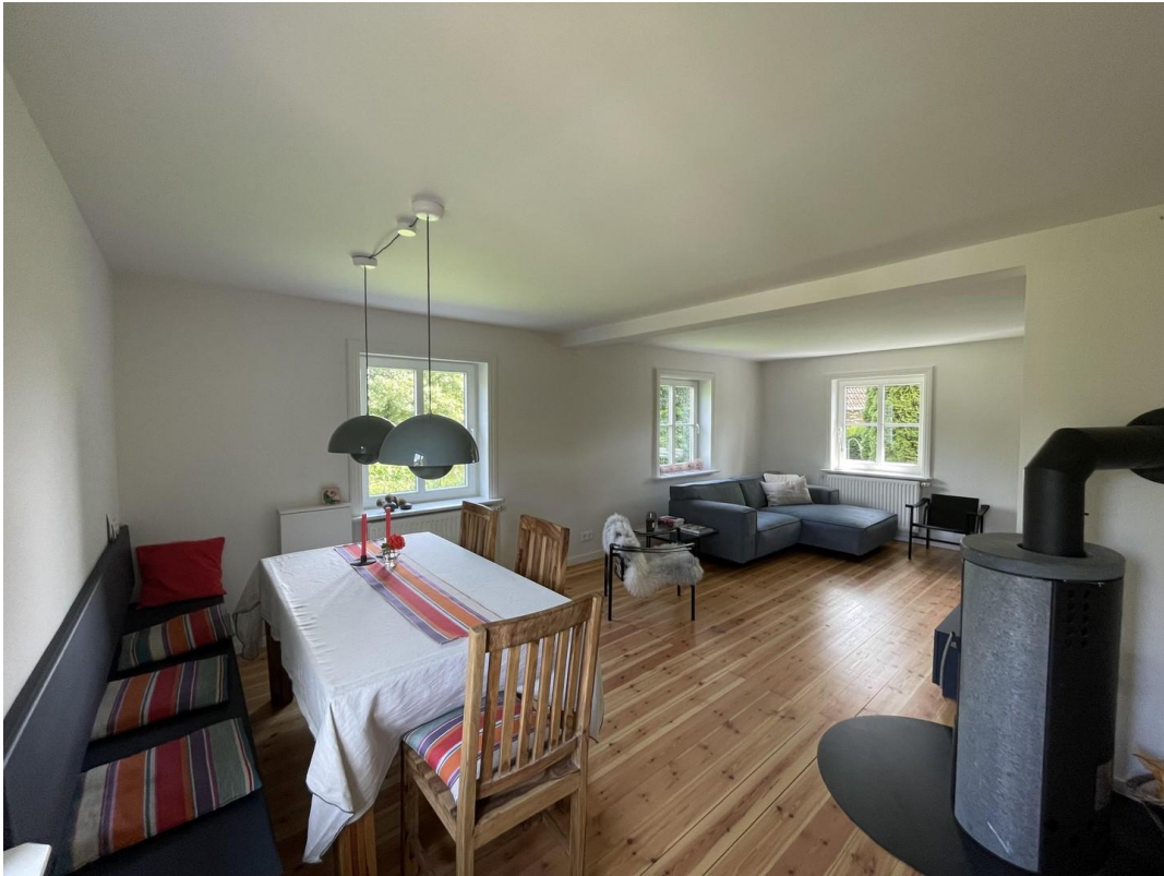
Wohn- und Esszimmer