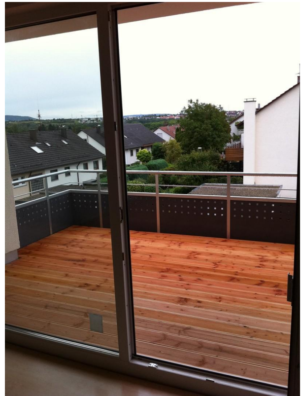
Balkon mit Ausblick (OG1)