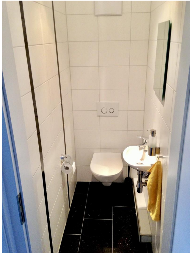
Gäste WC OG1