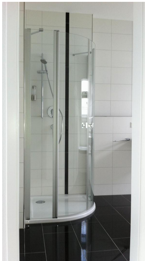
Dusche (im Bad)