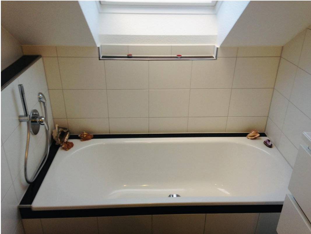
Badewanne im DG