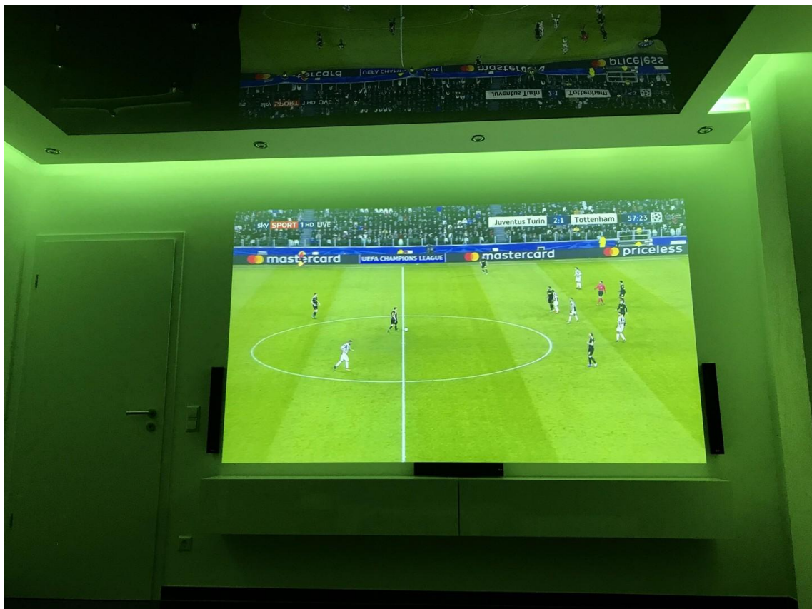
Home-Kino(wand) im DG