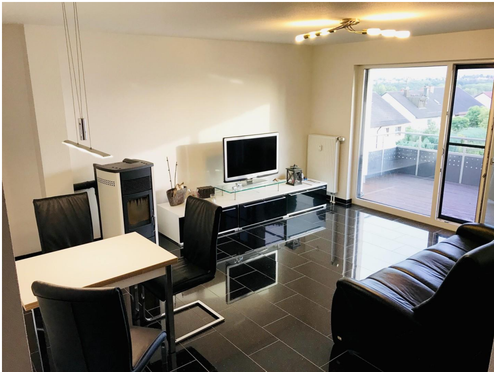
Wohnzimmer im OG 1