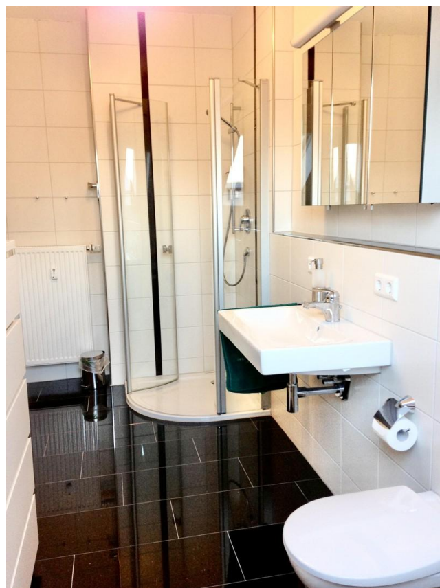
Bad im DG