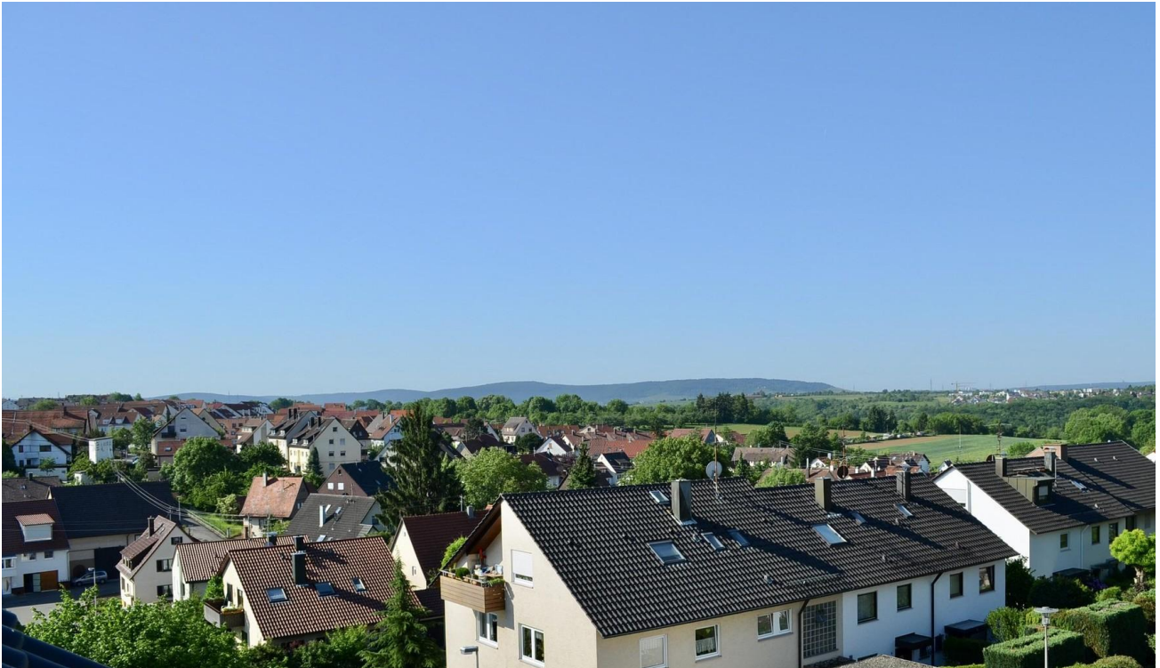
Ausblick vom DG (Home-Kino)