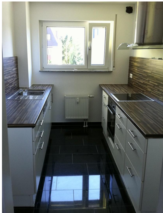
Küche im OG1