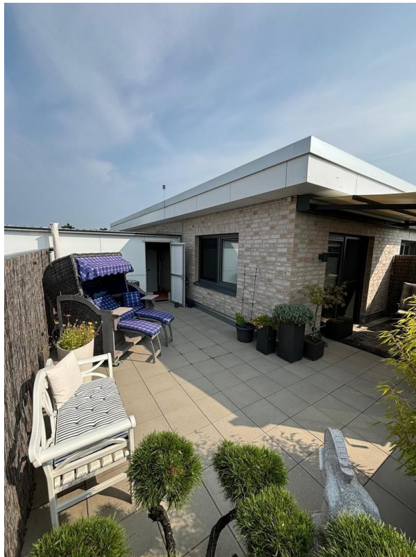
Dachterrasse mit Abstellraum